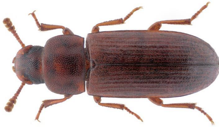
Slika 1. Imago kestenjastog brašnara