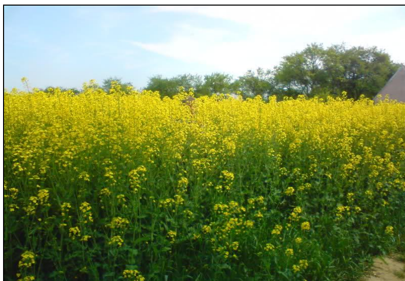
Slika 18. Uljana repica

Leguminozni siderati: lupine, grahorice, bob, smiljkita, seradela.