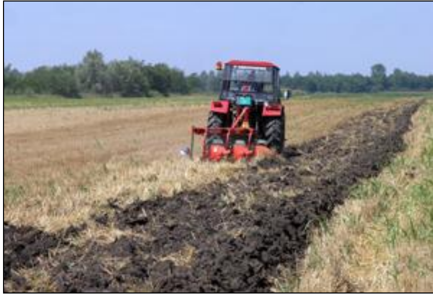
Slika 17. Unošenje posliježetvenih ostataka u tlo