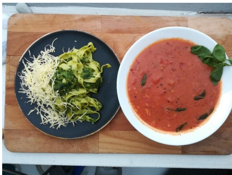
Slika 1. Pesto alla genovese i juha od rajčice s bosiljkom pripremljena od TR br. 6

Za bosiljak ( Ocimum basilicum L. ), prema istraživanjima zemljopisne rasprostranjenosti, postoje tri centra: tropsko i suptropsko područje Afrike, tropska Azije te tropska Južna Amerika. Prema povijesnim izvorima u nekim područjima Azije bosiljak se uzgaja već 5000 godina (Carević-Stanko, 2013.). Smatra se da je domovina bosiljka Indija i Iran (Garcke, 1972.). Jedan je od najpoznatijih i najkorištenijih kulinarskih začina zbog svojih osjetilnih aroma i mirisa. Prepoznat je kao ljekovita i medosnosna biljka te prirodni repelent za komarce, muhe i ose (Putievsky i Gai-Ambosi, 1999.; Parađiković, 2014.; Vojnović, 2019.; Strzelecka, 2000.). Bosiljak je moguće uzgajati kako na otvorenom tako i u zaštićenim prostorima, staklenicima i plastenicima (Nurzynska-Wierdak i sur., 2012.). Koristi se kao svježi, smrznuti, suhi, u proizvodnji eteričnog ulja, medicini i dr. Kao svjež začim koristi se u umacima, salatama, gulašima, no najpoznatije je talijansko jelo " Pesto alla genovese " (Slika 1.) koje u najvećem omjeru sadrži bosiljak. Radi svojih nutritivnih vrijednosti bosiljak je zdravije koristiti u svježem stanju (Radovich, 2000.). Kao sušeni začim najviše se koristi u francuskoj, talijanskoj, meksičkoj te grčkoj kuhinji u kombinaciji s rajčicom (Slika 1.)