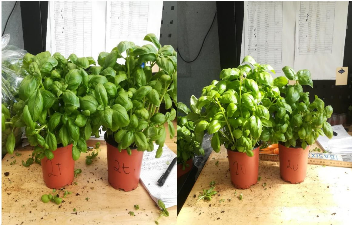
Slika 12. Završni izgled tretmana 2