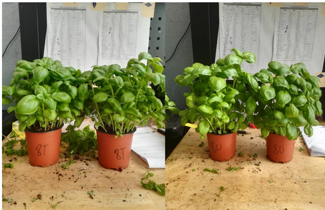
Slika 18. Završni izgled tretmana 8