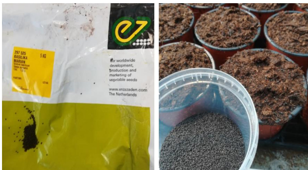
Slika 6. Sjeme Ocimum basilicum L. nizozemskog proizvođača Enza Zaden

U napunjene lončice nakon zalijevanja i zaštite od štetnika, obavljene s ekološkim sredstvom Gnatol SC u vodenoj otopini, koncentracije 100 mL/5L, izvršena je sjetva sjemena (Slika 6.) Ocimum basilicum L. , nizozemskog proizvođača Enza Zaden.