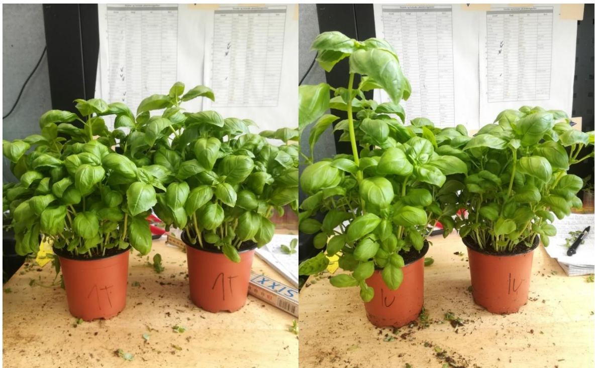
Slika 11. Završni izgled tretmana 1

Nakon žetve zabilježeni su morfološki parametri bosiljka, visina biljke i svježe masa biljke. Najveća visina biljke izmjerena je kod tretmana 6U, zatim 5U te 4U (19,26; 18,67; 17,39 cm) te kod tih tretmana je zabilježena i najveća masa, koja iznosi kod tretmana 5 56,00 g, tretmana 6U 55,10 g te tretmana 4U 54,15 g. El-Ziat (2015.) u svojoj disertaciji navodi kako je u obje godine istraživanja kod biljaka bosiljka tretiranim pilećim gnojem zabilježena veća visina biljaka. No, ako uzmemo u obzir odnos mase i visine biljke te vizualnu procjenu samih biljaka (slika 11., slika 12., slika 13., slika 14., slika 15., slika 16., slika 17., slika 18.), tada podvarijante T tretmana samo s pilećim gnojivom (4-6) pokazuju najbolju kvalitetu biljke. Visina biljaka podvarijante U u odnosu s masom nadzemnog dijela upućuju na izduženost biljaka. U odnosu na kontrolu kod biljaka uzgajanih na tretmanima sa biljnim gnojivima utvrđena je veća masa i visina što je u skladu s istraživanjem Chafi i Bensoltane (2009.) koji navode isto. Najniža visina i masa biljke zabilježeni su kod tretmana 2U i iznosili 12,78 cm, a masa 33,65 g.