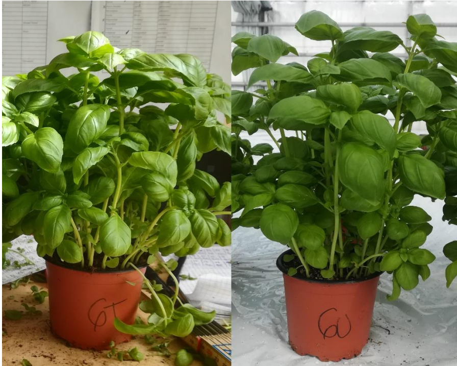
Slika 16. Završni izgled tretmana 6