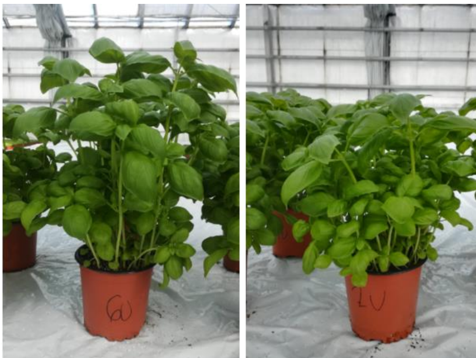
Slika 9. Najviša (tretman 6U) i najniža (tretman 2U) visina nadzemne mase