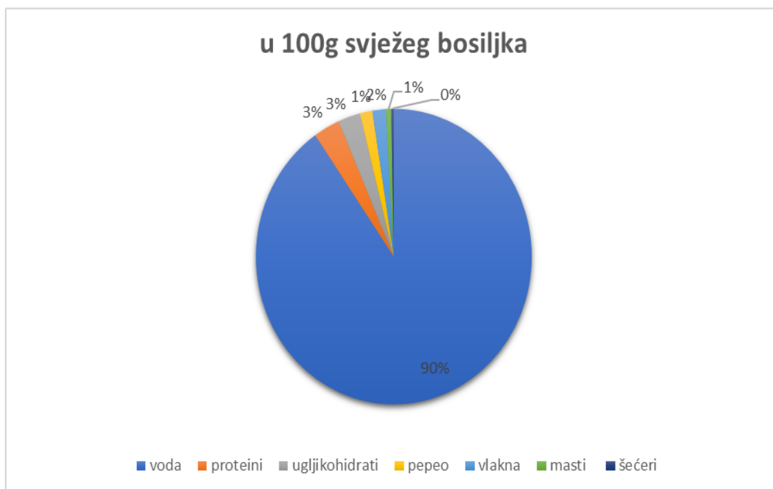
Grafikon 1. Postotak makro nutrijenata u 100 g svježeg bosiljka

Grafikon 1. i grafikon 2. daju prikaz ostalih nutritivnih komponenti svježe herbe bosiljka.