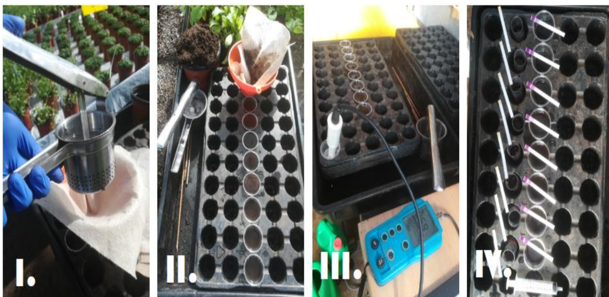
Slika 8. I. metalna preša, II. uzimanje uzoraka za analizu, III. mjerenje EC i pH otopine tla, IV. nitratni test

U istoj otopini mjerena je koncentracija različitih oblika dušika pomoću nitratnih trakica Merck KgaA, Njemačka (Slika 8.). Najprije su mjereni nitriti i nitrati uranjanjem trakica u vodenu otopinu supstrata. Za mjerenje amonijačnog dušika uzelo se 5 mL vodene otopine supstrata svakog tretmana i u njega dodalo deset kapi natrijevog hidroksida te je trakicama određena vrijednost.