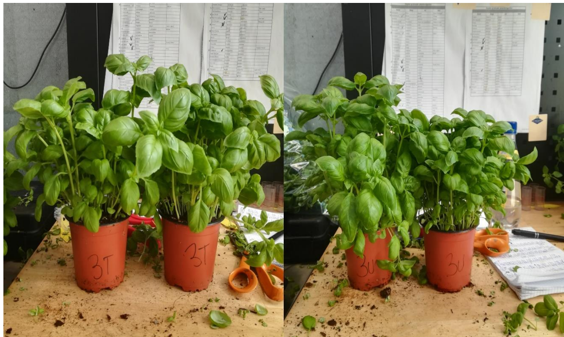
Slika 13. Završni izgled tretmana 3