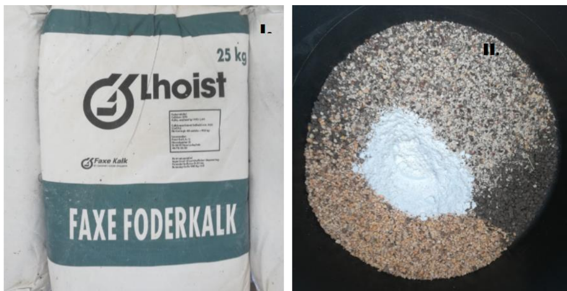
Slika 4. I. Vapnenac, II. Smjesa dodanih tvari tretman 8