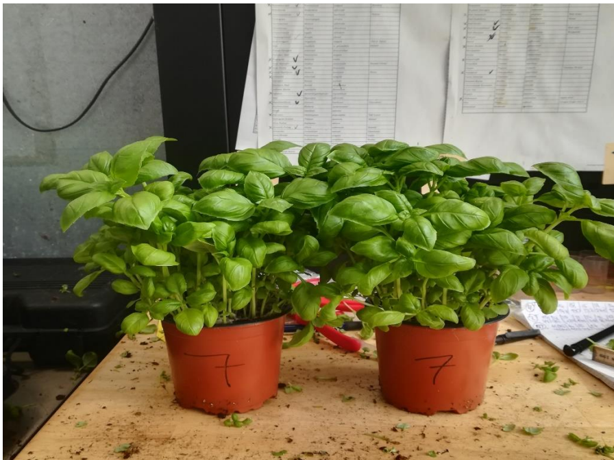
Slika 17. Završni izgled tretmana 7