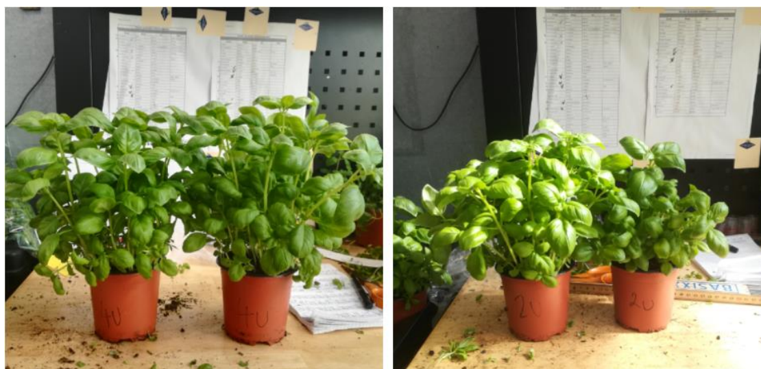
Slika 10. Tretman 4U s drugom najtežom masom 54,15 g i najlakši tretman 2U 33,65 g

Sadržaj makroelemenata u listu bosiljka statistički se značajno razlikovao u ovisnosti o ispitivanim tretmanima. Kod tretmana 2T utvrđen je značajno veći sadržaj N, P i Ca u odnosu na ostale tretmane. Značajno niže vrijednosti N u listu bosiljka u odnosu na kontrolne tretmane zabilježene su kod biljaka uzgajanih na tretmanima 3T, 4T, 5T i 6T. Također, i kod P su biljke uzgajane na spomenutim tretmanima te tretmanu 8 sadržavale značajno niže vrijednosti u odnosu na kontrolne tretmane. (Tablica 12.)