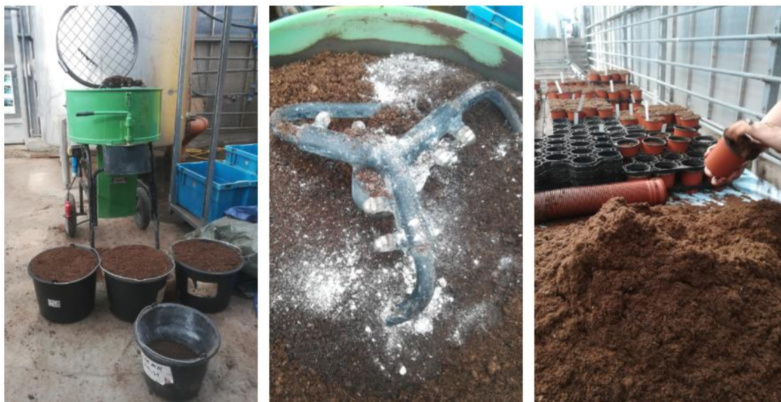
Slika 3. Prikaz električne miješalice i njenog rada, količina supstrata i organskog gnojiva u plastičnim kantama te ručno punjenje lončića

Omjer hraniva sa 60 kg treseta bio je raspoređen u 64 lončića. Za tretman 1 i tretman 7 korišteno je 0,72 g ekološkog kokošjeg gnojiva, 0,18 g brašna boba, 0,18 g brašna lupine odnosno smjesa tih dvaju brašna. U tretmanu 2 izostavljeno je organsko brašno boba te dodano 0,72 g ekološkog kokošjeg gnojiva i 0,33 g brašna lupine. U tretmanu 3 izostavljeno je brašno lupine te dodano 0,72 g ekološkog kokošjeg gnojiva i 0,42 g brašna boba. U tretmanu 4 dodana je nedovoljna količina ekološkog kokošjeg gnojiva u količini od 1,14 g, koja ne zadovoljava potrebe bosiljka za dušikom. U tretmanu 5 dodana je teorijski preporučena količina ekološkog kokošjeg gnojiva za potrebe bosiljka za dušikom od 1,56 g. Tretman 6 imao je veću količinu od teorijski preporučene te je iznosila 1,98 g i u zadnjem tretmanu 8 koristilo se ekološko peletirano kokošje gnojivo. Uz sve tretmane se dodavao vapnenac ( \text{CaCO}_3 ) u koncentraciji od 0,108 g (Slika 4.). Omjeri koncentracije hraniva po tretmanima prikazani su u tablici 2.