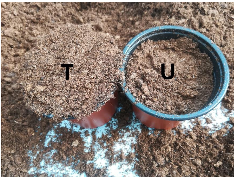
Slika 5. "T" (dodatna količina treseta oko 40 g/lonč.) i "U" (bez dodatka)

U napunjene lončice nakon zalijevanja i zaštite od štetnika, obavljene s ekološkim sredstvom Gnatol SC u vodenoj otopini, koncentracije 100 mL/5L, izvršena je sjetva sjemena (Slika 6.) Ocimum basilicum L. , nizozemskog proizvođača Enza Zaden.