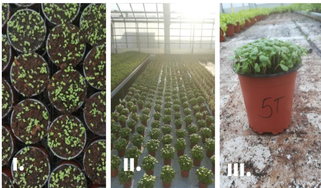
Slika 7. I. Biljke nakon skidanja plastike, II. Razmještaj biljaka na stolu, III. Izgled biljke nakon dva tjedna