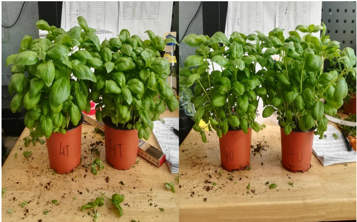
Slika 14. Završni izgled tretmana 4