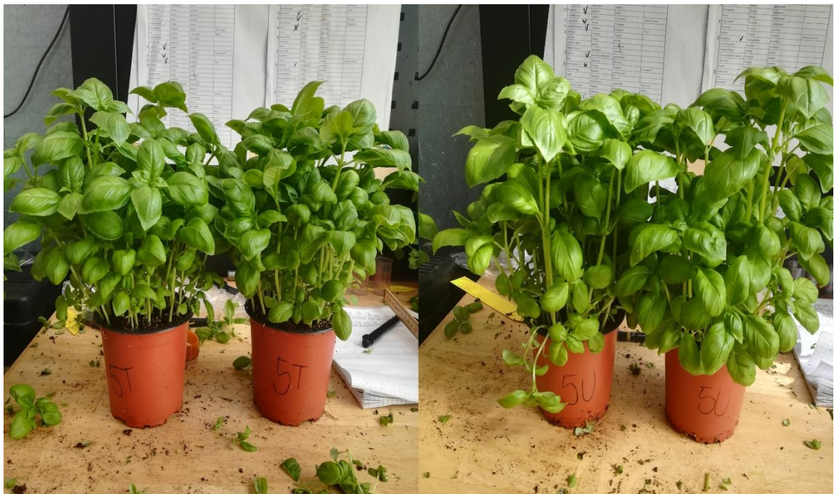
Slika 15. Završni izgled tretmana 5