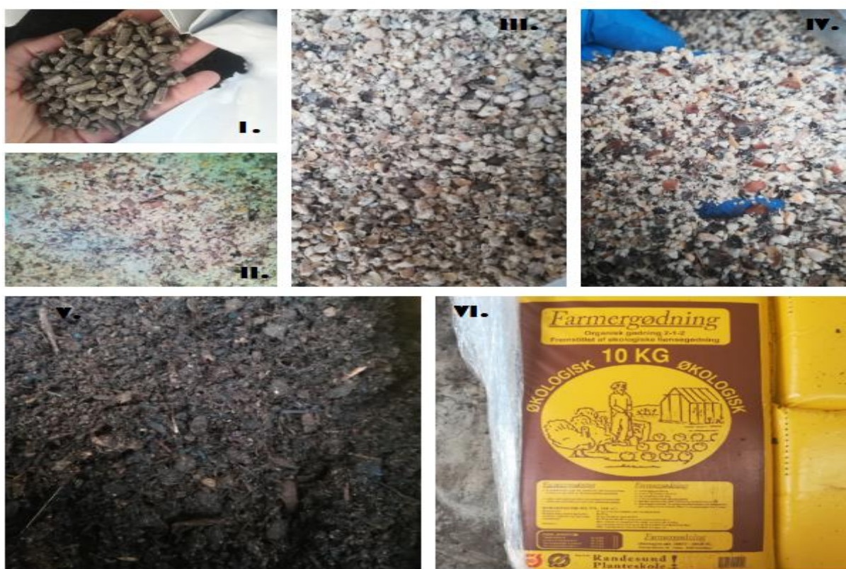
Slika 2. I. Ekološko peletirano kokošje gnojivo, II. Smjesa boba i lupine, III. Bob, IV. Lupina, V. Ekološko kokošje gnojivo, VI. Ambalaža ekološkog pilećeg gnojiva

U istraživanju koristile su se različite vrste organskih gnojiva kao i mješavine istih. Glavni cilj bio je pronaći najbolji omjer ekološki proizvedeno kokošjeg organskog gnojiva koji bi izostavio uporabu ostalih. Kao organska gnojiva korišteni su: brašno boba ( Vicia faba L. ), brašno lupine ( Lupinus angustifolium L. ), smjesa brašna boba i lupine, ekološko peletirano kokošje gnojivo i ekološki proizvedeno kokošje organsko gnojivo (Slika 2).