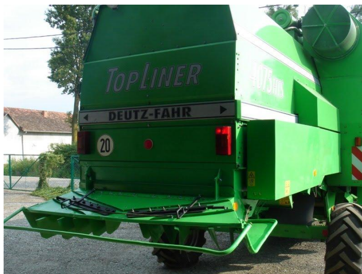
Slika 7. Sječkalica kombajna Deutz Fahr topliner 4075 hts

Sječkalica, sječka ili „tarup“, sve su to nazivi završnog dijela procesa u radu kombajna koja je sastavnica svake modernije izvedbe kombajna, koja ima zadatak svu izvršenu žitnu masu samljeti i usitniti te pravilno rasporediti po strništu parcele na kojoj se obavlja žetva. Nalazi se na repu kombajna te stoji horizontalno u odnosu na vršalicu. Sastoji se od osovine i valjka na kojemu su horizontalno poredani noževi u pravilnom razmaku. Kompletna sječkalica na kombajnu „ Deutz fahr 4075 “ sastoji se od tri redova noževa te u svakome redu po dvanaest noževa koji se pokreće pomoću dvožilnog remena koji dobiva snagu od pogonskog agregata kombajna, te razbacivača ili tzv. „lepeze“ koja razbacuje žetvene ostatke po parceli.