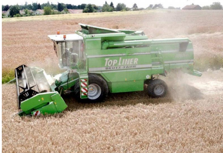
Slika 3. Kombajn Deutz Fahr topliner 4075 hts

Radi se o kombajnu koji je proizveden 1998., čija širina uređaja za košnju iznosi 5,40m, kombajn ima 6 slamotresa, šesterocilindrični redni motor sa zračnim hlađenjem (Slika 3.). Oznaka hts nam govori da je kombajn opremljen s turboseparatorom odnosno dodatnim bubnjem i podbubnjem koji ima zadaću boljeg i lakšeg izvršavanja žetvene mase.