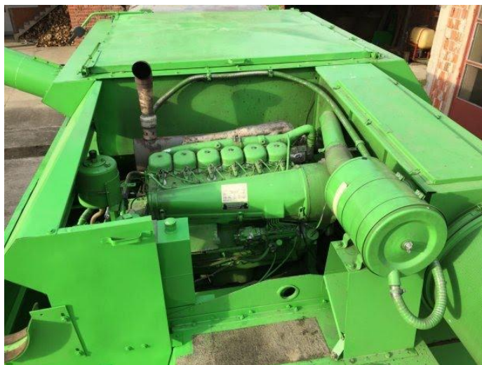
Slika 8. ? kombajna Deutz Fahr topliner 4075 hts

Kombajn Deutz Fahr topliner 4075 hts ima ugrađen motor SUI koji je šesterocilindricni, a snaga mu iznosi 176 kw, odnosno 236 ks. Motor karakterizira zračni rashladni sustav zbog čega moramo voditi veliku brigu o čistoći motora odnosno potrebno je osigurati da zrak nesmetano struji između rebra koji se nalaze na glavama i cilindrima motora. Kombajn radi u izrazito teškim uvjetima (visoke temperature, puno prašina) zbog čega je u vrijeme žetve potrebno čistiti kombajn, a naročito motor i po nekoliko puta dnevno.