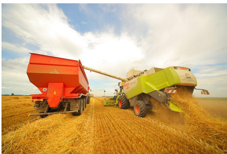
Slika 2. Žetva u 21. stoljeću