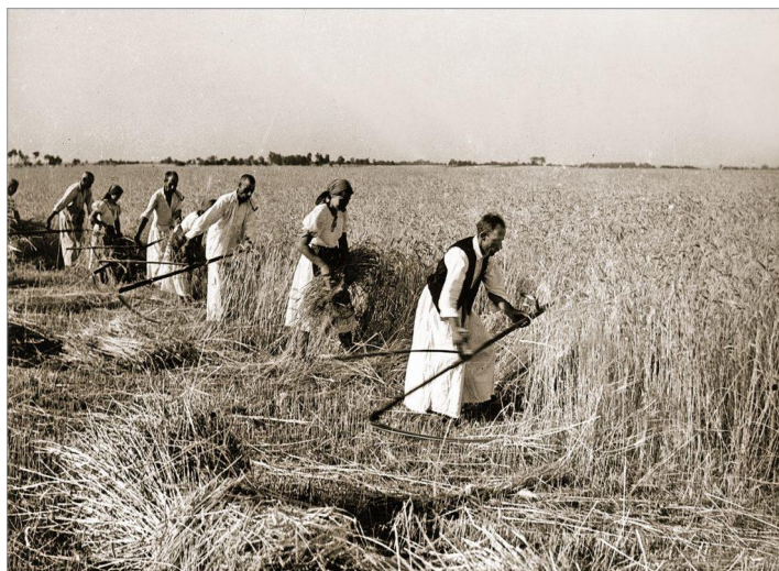
Slika 1. Žetva, prva polovina 20. stoljeća