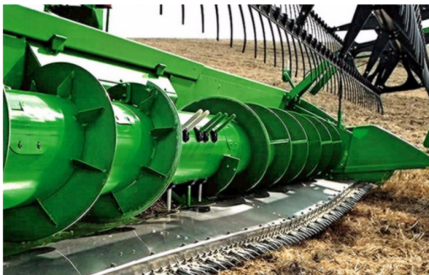
Slika 3. Heder kombajna Deutz Fahr topliner 4075 hts

Heder kombajna (Slika 4.), motovilo s lopaticama naginje masu žita prema kosi i polaže je na stol hedera. Spiralni transporter hedera dovlači pokošenu masu prema sredini do ulaza u elevator hedera, koji je svojim letvicama dalje transportira do vršalice kombajna. Heder se podiže i spušta hidraulički, a time se ujedno regulira i visina reza. Hidrauličkim se uređajem podiže i spušta vitlo. Svi radni elementi hedera mogu se odjednom uključiti ili isključiti, neovisno o pogonu vršalice. Siguran rad i sprječavanje lomova na hederu osigurano je sigurnosnom spojnicom.