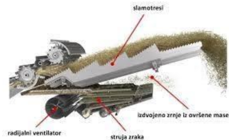
Slika 6. Shematski prikaz rada slamotresa