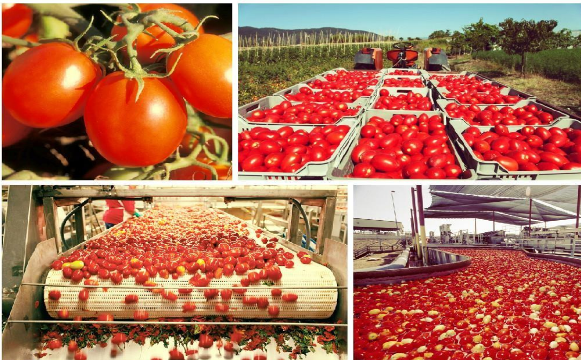
Slika 2: Proizvodnja, berba i prerada rajčice

Brojna istraživanja bave se mogućim antikancerogenim učinkom rajčice ( Lycopersicon esculentum Mill.) i proizvoda od rajčice. Osim antikancerogenog djelovanja, rajčica je najvažniji izvor likopena, karotenoida koji je snažan antioksidans. Proizvodi od rajčice povećavaju plazmatsku koncentraciju likopena te dokazano djeluju na smanjenje rizika od nastanka karcinoma prostate za 23% (Giovannicci i sur., 2002.). Energetska vrijednost rajčice u 100 g iznosi 25 kcal. Najzastupljeniji minerali u plodu rajčice su Na, Mg, P i Fe; ima ih više nego u pilećem mesu, ribi i mlijeku. Rajčica je važan izvor vitamina E, K, B 1 - B 6 i C. U ljudskoj prehrani rajčica se koristi najviše u svježem stanju prerađuje se u koncentrate, kečap, sok, pelate i razne druge prerađevine.