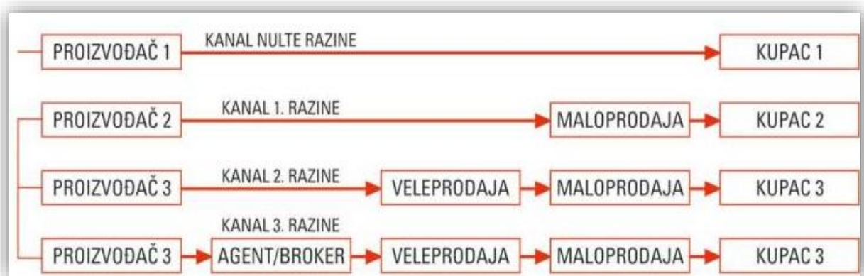
Slika 7. Kanali distribucije za krajnju proizvodnju

Mnogi proizvođači nisu u finansijskoj mogućnosti obavljati izravnu prodaju stoga biraju posrednike preko kojih će poslovati. Posrednici u prodaji proizvoda su specijalizirani ljudi koji su upućeni u tržište, prodaju, ekonomsko stanje te koji znaju balansirati između nabave, prodaje i dostave proizvoda.