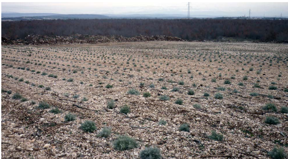
Slika 7. Plantaža smilja na krškom tlu

Ručna sadnja traži više ulaganja prilikom podizanja nasada, dok sadnja strojem ima veću brzinu rada i direktno zalijevanje prilikom sadnje čime se pospješuje prijem sadnog materijala. Presadnice se sade u redove na razmak od 50 do 70 cm (Slika 7.). Razmak između biljaka treba biti od 30 do 40 cm. Sadnja na razmaku 50 x 30 zahtjeva 66 600 presadnica/ha. Sadnja na razmaku 70 x 30 zahtjeva 47 600 presadnica/ha. Iako smilje nema veće zahtjeve za vlagom, mlade nasade poželjno je navodnjavati u ranim fazama razvoja biljke.