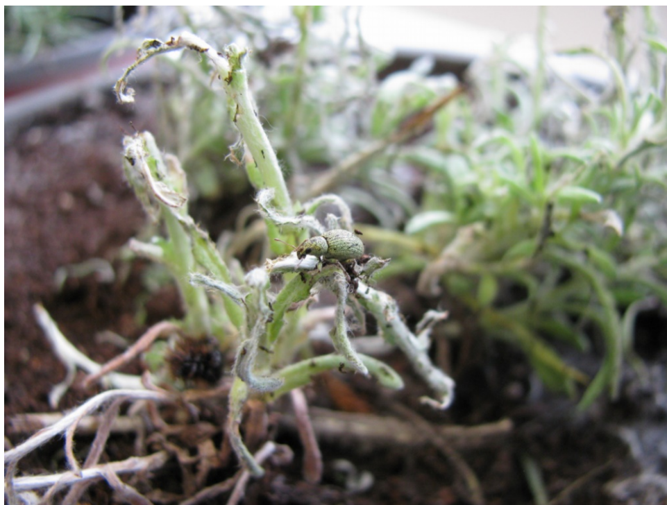
Slika 8. Oštećenje nastalo uslijed napada srebrnog listojeda