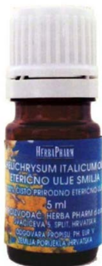
Slika 4. Eterično ulje smilja