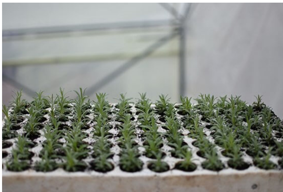
Slika 6. Sadnice smilja

Gustoća skolpa prilagođava se mehaniziranom izvođenju radnih operacija (Beljo i sur., 2016.). Sklop nasada može biti različit: jednored, dvored ili tored.