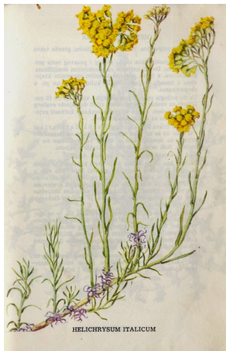
Slika 2. Shematski prikaz biljke

Podzemni izdanak smilja je razgranat i prodire duboko u tlo odakle crpi mineralne tvari potrebne za rast i razvoj. Iz drvenastog vretenastog rizoma svake se sezone razvija nekoliko desetaka stabljika koje nose cvijet (Slika 2.). Brži protok vode osiguran je širim provodnim nitima u morfologiji ksilema, čime su biljke prilagođene sušnom vremenu.