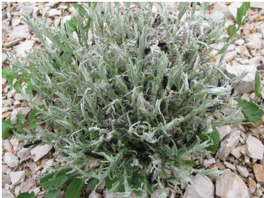
Slika 9. Grm smilja uslijed napada gusjenica stričkovog šarenjaka

Šampinjonske mušice iz porodice Scieridae su dugo poznate i opisivane kao štetnici koji prate uzgoj jestivih gljiva, pa se kod nas koristi naziv šampinjonske mušice. Prisutne su svugdje u prirodi i važan su sastavni dio naše faune. Imago ne radi štetu, ali ličinke su iznimno opasne. Ličinke izbjegavaju dnevno svjetlo pa se zavlače u supstrat. Na površinu izlaze samo noću, a u nedostatku hrane međusobno se proždiru. Zadnjih godina šampinjonske mušice sve se više navode kao ekonomski značajni štetnici povrća, cvijeća, ukrasnog i aromatičnog bilja (Beljo i sur., 2016.). Zabilježene su štete na presadnicama smilja koje su najčešće uzgajaju u stiropornim kontejnerima. Ličinke se hrane u korijenu i na korijenovom vratu, ispod kore i na biljkama smilja koje su bile u fazi sušenja. Štete su najveće ako napadaju bazalne dijelove tek poniklih biljčica ili tek oblikovano korijenje reznica. Najčešći simptomi ovakvih napada su slab porast, ali i sušenje biljaka. Danas se za suzbijanje najviše koriste nematode ( Steinernema feltiae ), koje se mogu miješati sa supstratom ili se miješaju s vodom pa se u supstrat unose zalijevanjem.