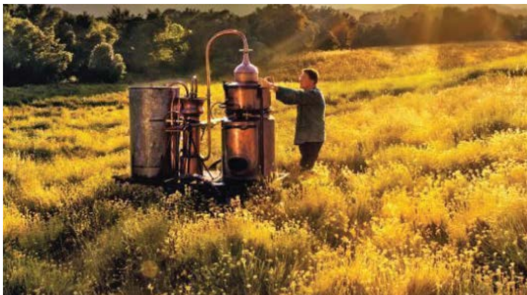
Slika 11. Proizvodnja eteričnog ulja

Tijekom proizvodnje eteričnog ulja, kao nusproizvod dobiva se hidrolat ili mirisna vodica. Najkvalitetniji, odnosno hidrolat s najintenzivnijim mirisom dobiva se tijekom prve frakcije koja traje oko 15 minuta. Što destilacija traje dulje, mirisna vodica bit će manje zasićena kemijskim komponentama (Plietić, 2012.). Hidrolat se primjenjuje u kozmetičkoj industriji i ima snažan utjecaj na regeneraciju kože i poboljšava cirkulaciju.