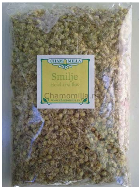
Slika 5. Čaj od smilja