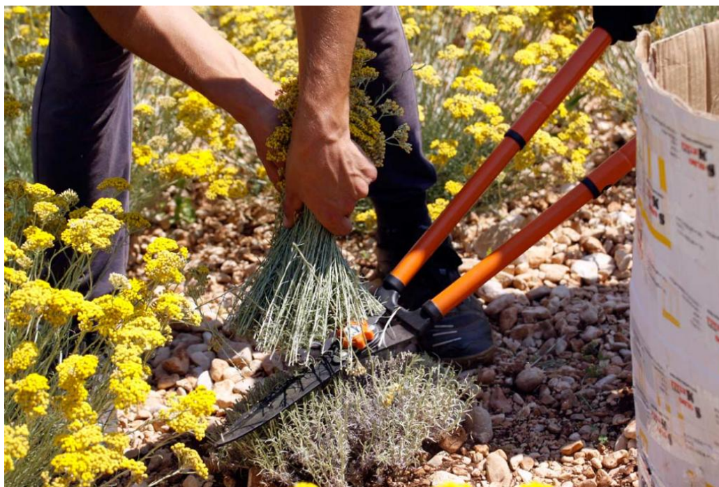
Slika 10. Ručna žetva smilja

Berba smilja za proizvodnju eteričnog ulja je kasnija u odnosu na onu za proizvodnju suhog cvijeta i počinje kada je otvoreno 50 % cvjetova. Osim cvjetova koristi se i stabljika. Za proizvodnju eteričnog ulja se obavlja u trenutku pune tehnološke zrelosti. Odnosno kada je biljka u fazi pune cvatnje. Odsijecaju se cvatovi iznad prvih listova na dužinu 15 do 20 cm. Za proizvodnju cvijeta žetva se obavlja kada je jedna trećina cvjetova u cvatu otvorena, jer je tada boja cvjetova najintenzivnija. U toj fazi cvjetovi sadrže oko 65 % vlage.