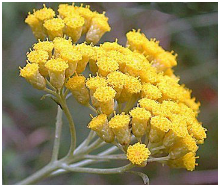
Slika 3. Cvjetne glavice

Cvatovi su skupljeni u glavice i sadrže mnogo cvjetova (Forenbacher, 2001.). Cvjetovi su cjevasti (Bačić i Sabo,2006.), dvosploni, sitni i dugi oko 4 mm (Slika 3.). Ovojni listiću su svijetložuti (Rogošić, 2001.). Sitni cvjetići skupljeni su u karakteristične žute cvati koji cvatu od svibnja do kraja srpnja, odnosno početka kolovoza. Cvati zadržavaju svoju karakterističnu žutu boju nakon cvatnje i sušenja. Svaka stabljika završava cvijetovima. Cvijetovi grma su jednake visine jer su drške gornjih cvijetova kraće, a donjih dulje. Biljka je dvodomna. Plod je sitna roška (achenium). Sjeme je duguljasto, crne boje i vrlo sitno (Beljo i sur., 2016., Kovačić i sur., 2008.). Jedan gram sjemena sadrži 3300 – 3700 zrna.