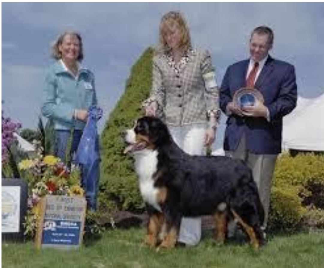
Slika 3. Izložbeni primjerak bernskog planinskog psa