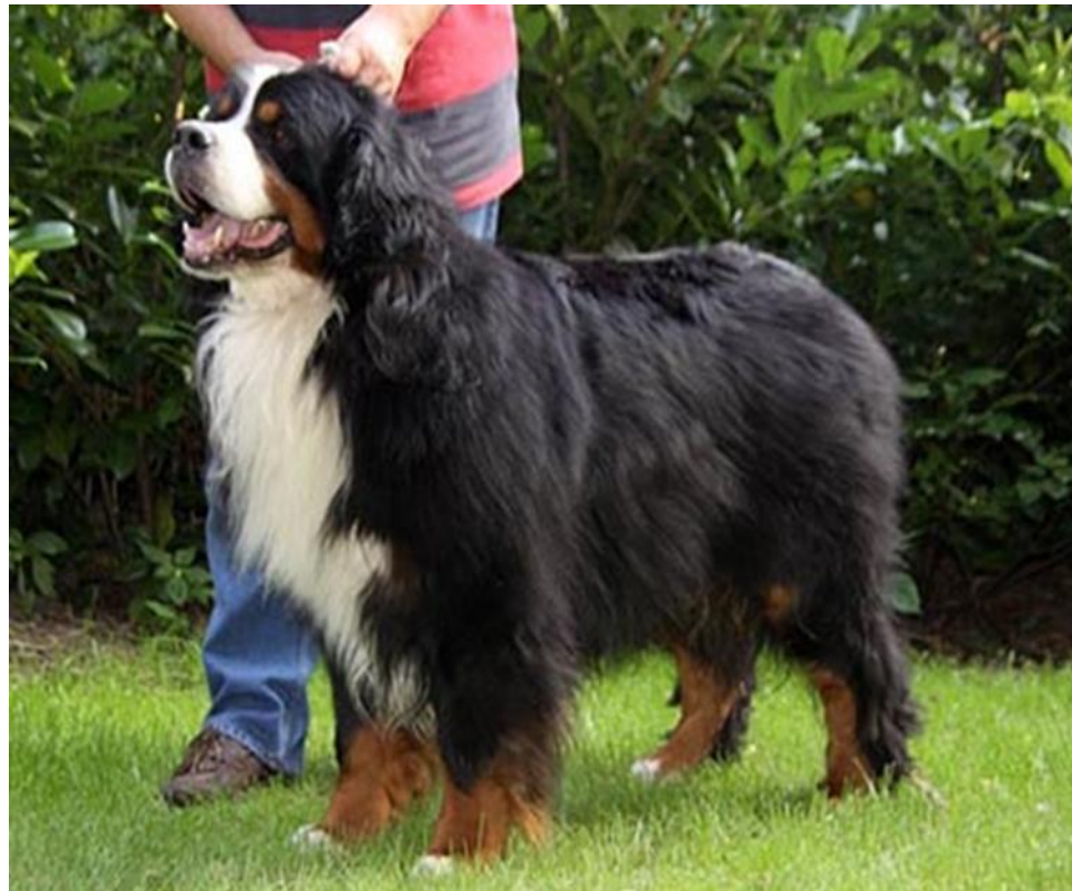
Slika 4. Zdrav, dobro njegovan mužjak bernskog planinskog psa