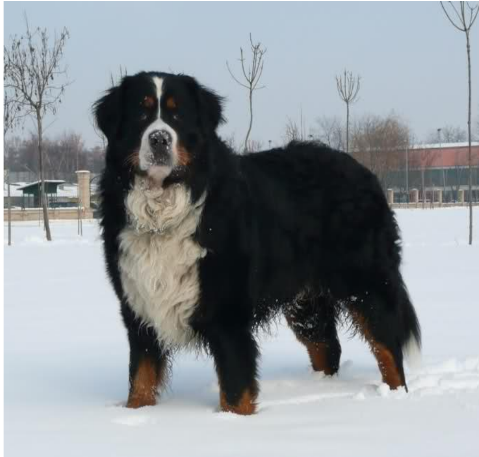
Slika 3. Bernski planinski pas u snijegu

za ljude kad slobodno šecu ulicom na koje neće ni obraćati pažnju ako ga se ne zove, jer nije agresivan.