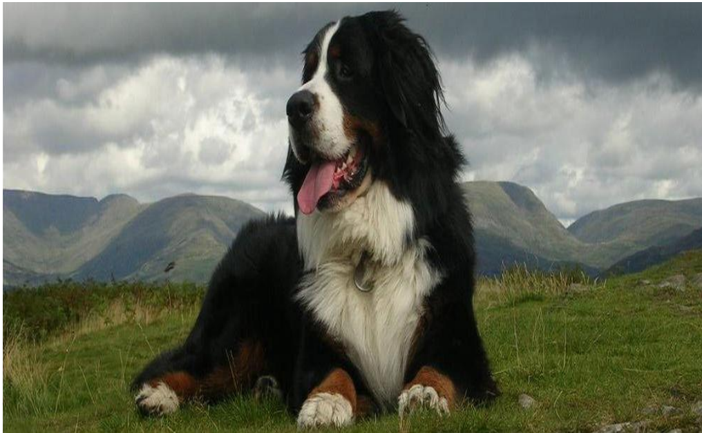
Slika 1. Tipičan primjerak bernskog planinskog psa

Jedan je od četiri pasmine sennenhund , psi iz švicarskih Alpa. Naziv Sennenhund potiče od njemačkog, Seene (alpski/planinski pašnjaci) i Hund (pas), Berner (bernski) odnosi se na područje pasmine porijekla, švicarski kanton Bern.