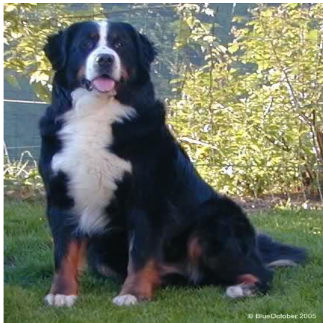
Slika 6. Pravilno njegovan i održavan pas

Bernski planinski pas se linja tijekom cijele godine, a najteže linjanje je tijekom sezonskih promjena. Obično će bernski planinski pas zahtijevati samo jedno četkanje tjedno, a više u proljeće i jesen, da bi krzno bilo uredno i ne bi bilo previše dlaka, čuperaka po kući, dvorištu i odjeći vlasnika. Dugodlakim psima kao što je bernski planinski pas potrebno skidati mrtvu dlaku. Ovaj pas zahtijeva kupanje jednom svakih par mjeseci, ovisno o tome koliko je visoka njegova razina aktivnosti i koliko često provodi na zemlji. Kako bi spriječili da voda ulazi u uši i oči, glavu tijekom tuširanja treba izostaviti. Oči bi trebalo jednom tjednom prebrisati vatom po obodu mlakim čajem od kamilice.