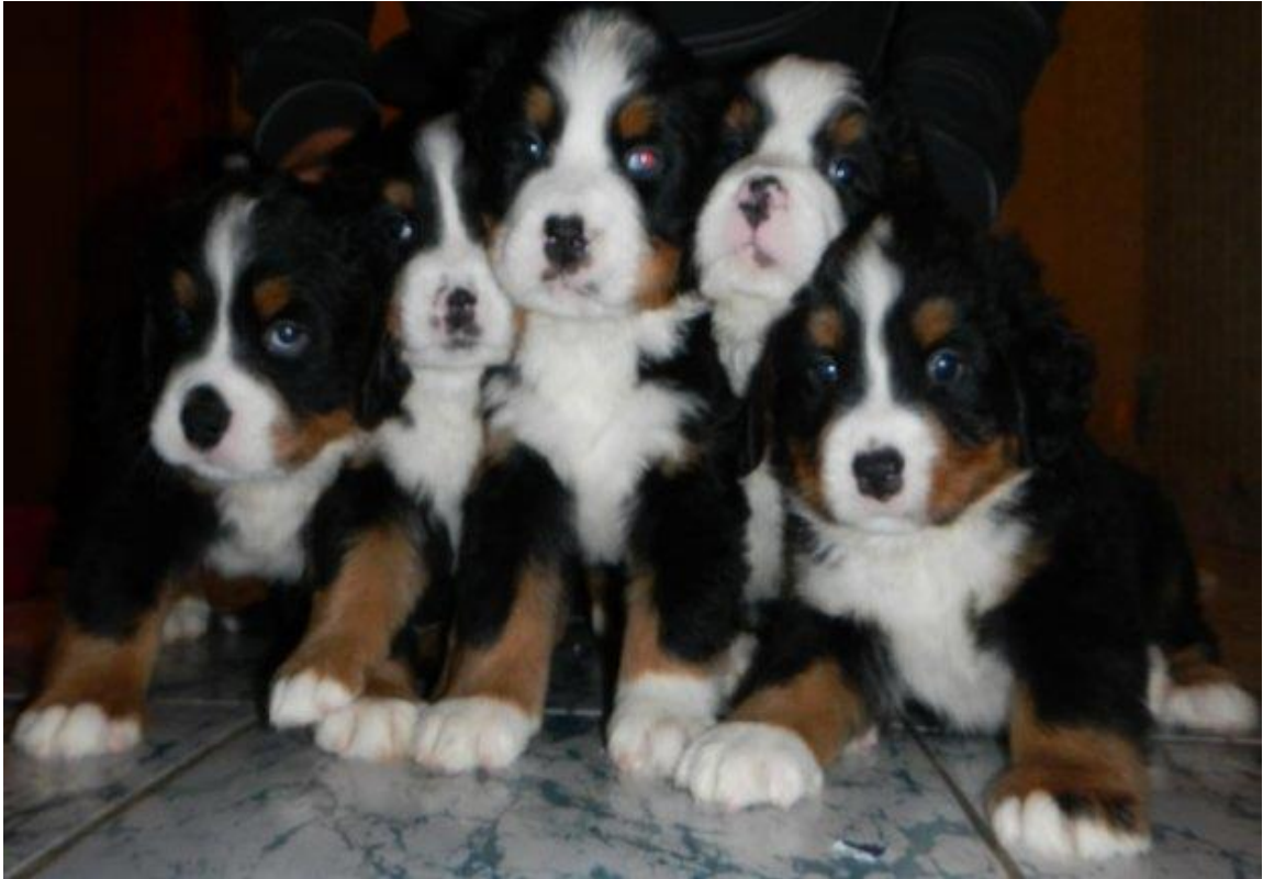
Slika 9. Štenci bernskog planinskog psa

Kad se nabavlja štene za ozbiljniji uzgoj u suradnji sa veterinarom trebalo bi obratiti pažnju na displaziju kukova, displaziju laktova, osteohondritis, kataraktu, glaukom, te ispitati krv na Willebrandovu bolest kod roditelja jer su to česte i uglavnom nasljedne bolesti.