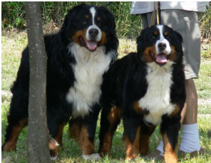
Slika 4. Spolni dimorfizam bernskog planinskog psa

Snažan i čvrst, pri tome nije težak. Bernski planinski pas liči na velikog švicarskog pastirskog psa od kojeg se razlikuje po nešto manjim dimenzijama i po dugačkoj valovitoj dlaci trobojnoj, karakterističnoj za svoju pasminu. Mužjaci su krupniji od ženki. U pravim uvjetima držanja nemaju prekomjernu težinu.