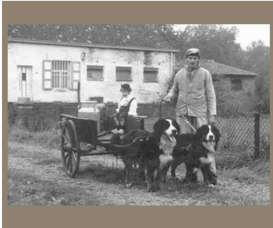
Slika 2. Povijesna upotreba bernskog planinskog psa

Ova pasmina pasa je prvi put prikazana 1902. god. u švicarskom Dog Show u Ostermundigenu. Dürrbächler (dirbahler) se upisuje 1904. god. u švicarsku rodovnu knjigu pasa dok 1907. godine kinolog Albertheim prvi daje opis pasmine. U istoj godini je osnovan Dürrbach klub, koji je preimenovan 1912. godine u Klub bernski planinski pas. Trenutno važeći standard pasmine usvojen je 1993. godine.