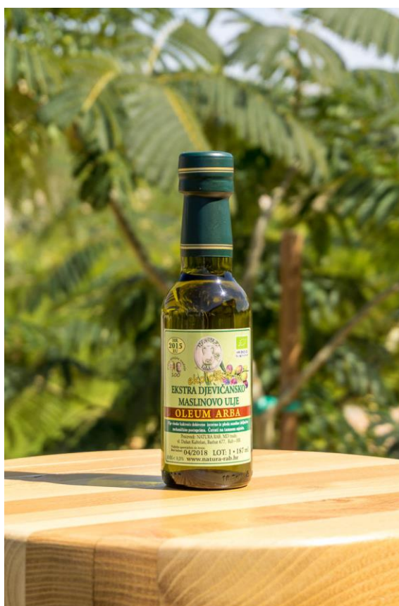
Slika 7. Ekstra djevičansko ekološko maslinovo ulje „ Oleum Arba “, 187 ml