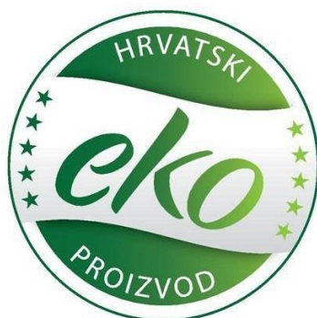
Slika 15. HR eko znak u boji, (izvor: www.ekorazvoj.hr )