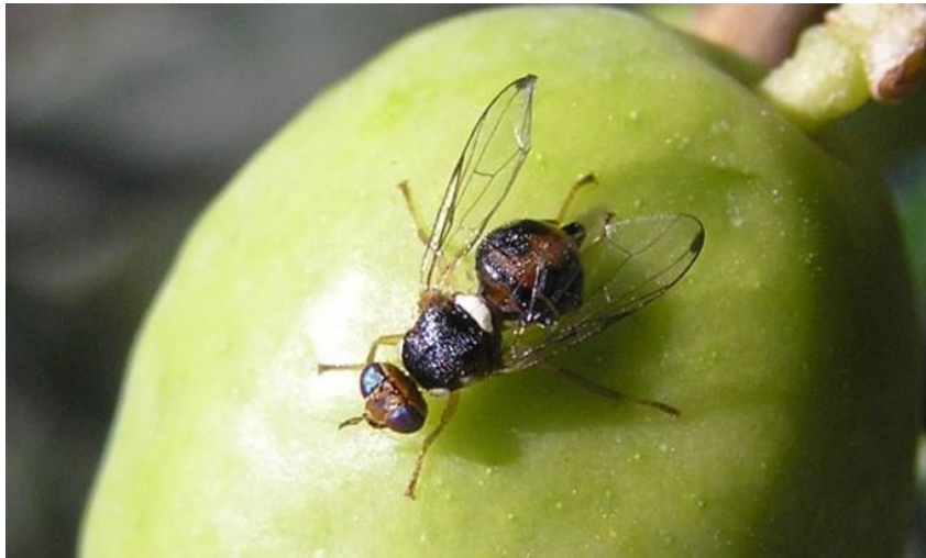
Slika 3. Maslinina muha, (izvor: www.chromos-agro.hr )