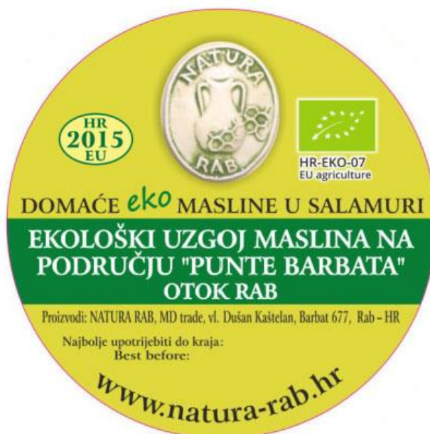
Slika 11. Etiketa za domaće eko masline u salamuri, (izvor: www.natura-rab.hr )