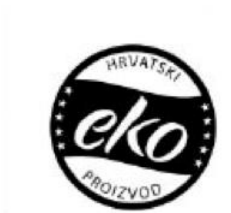
Slika 16. HR eko znak crno bijeli, (izvor: www.ekorazvoj.hr )