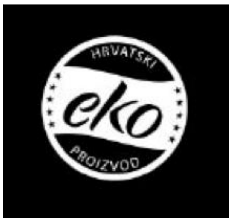
Slika 17. HR eko znak negativ