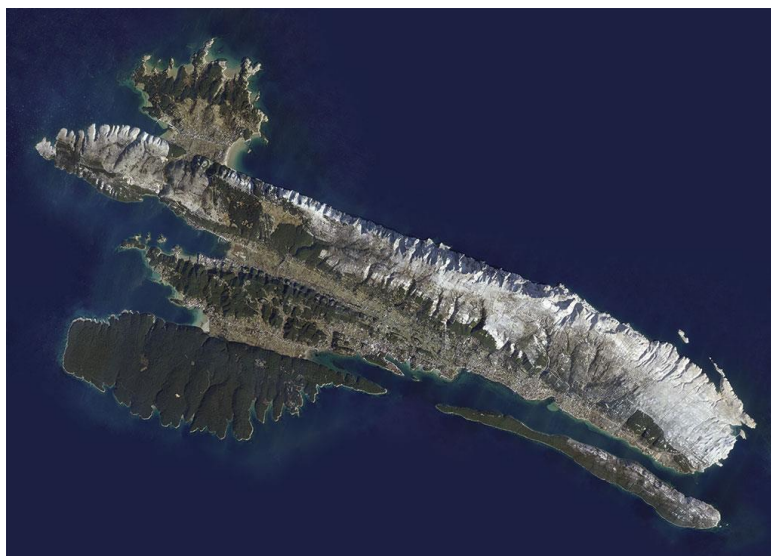
Slika 5. Geografski položaj otoka Raba, (izvor: www.bing.com )

Smješten u Kvarnerskom zaljevu između 44^{\circ}41' i 44^{\circ}51' sjeverne geografske širine, otok Rab okružen je brojnim drugim otocima i otočićima. Ovaj otok dug 22 kilometra i širok 11 kilometara pruža se od sjeverozapada prema jugoistoku, a od kopna ga dijeli Velebitski kanal (Slika 5.). Vrijeme na Rabu vrlo je ugodno: topla ljeta izmjenjuju se s blagim zimama u posebnoj vrsti mediteranske klime. Ima otprilike 2600 sunčanih sati godišnje (što je samo 9 oblačnih dana tijekom ljeta). Temperature sežu od 8 do 17 °C u travnju, pa sve od 17 do 28 °C u srpnju i kolovozu, uz prosječnu temperaturu mora od 25°C. Više od 30% površine otoka pokriveno je raznovrsnim biljem, od mirisnog grmlja na krškim obroncima Kamenjaka do bujnih šuma bora i hrasta u kojima obitavaju zečevi, fazani i ptice grabljivice, a na susjednom se otoku Svetom Grguru čak mogu naći i jeleni. Zbog svog tog zelenila, Rab se zove i smaragdnom otokom ( www.rab-visit.com ).