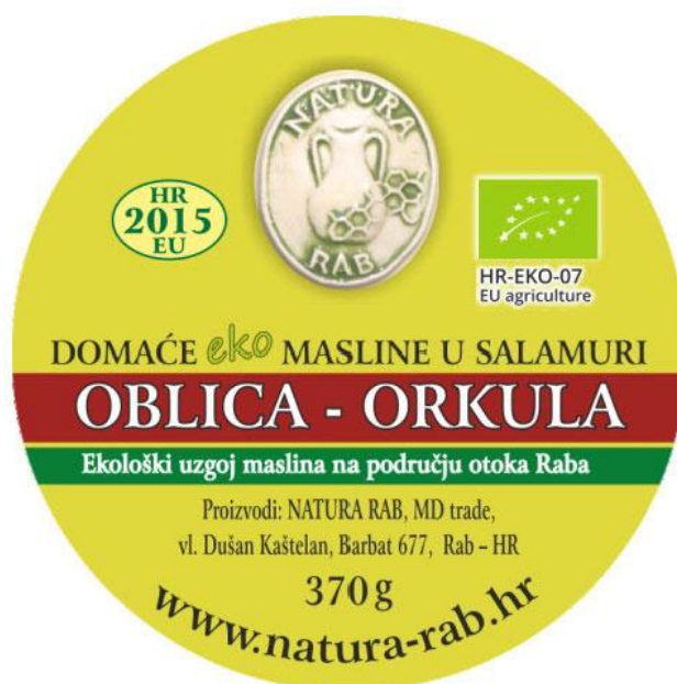
Slika 10. Etiketa za domaće eko masline u salamuri, (izvor: www.natura-rab.hr )