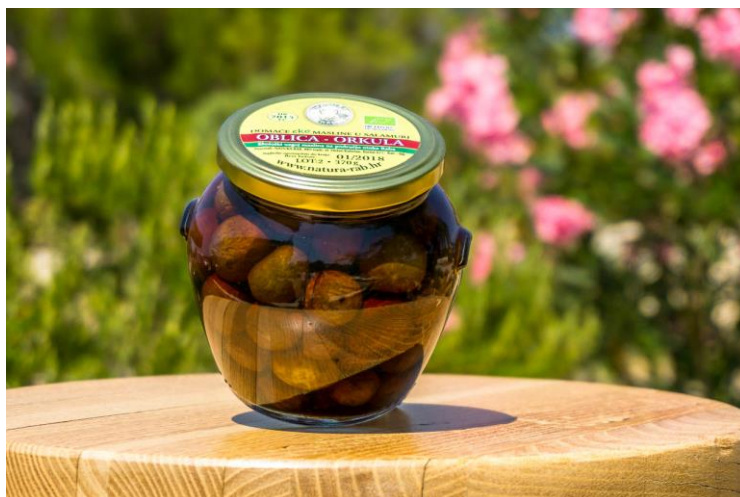
Slika 9. Domaće eko masline u salamuri, (izvor: www.natura-rab.hr )