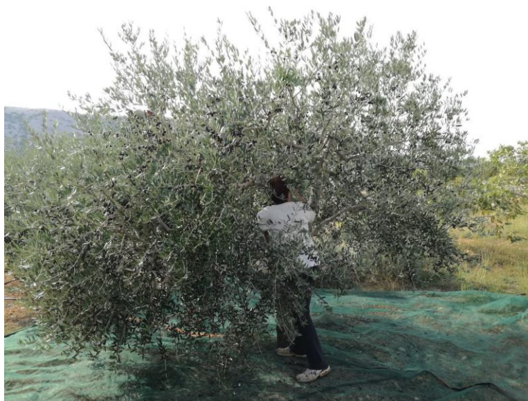
Slika 4. Ručna berba, (izvor: www.natura-rab.hr )