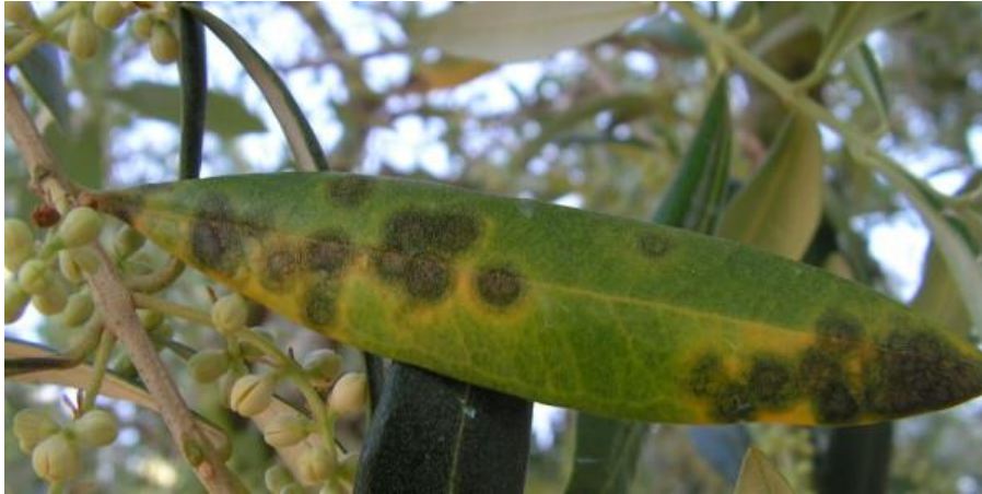
Slika 2. Paunovo oko