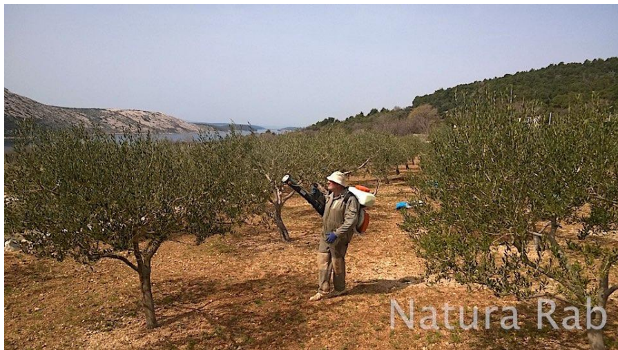
Slika 1. Zaštita maslina od štetočinja

Masline za jelo (za potrošnju „za stolom“) beru se u jesen kada su još nedozrele (Slika 4.). Beru se ručno, a jedna osoba može ubrati 10 do 20 kg u sat vremena. Crne masline za jelo beru se u punoj zrelosti. One koje se ne iskoriste svježe mogu biti odvojene za proizvodnju ulja. U studenom i prosincu obavlja se berba maslina za proizvodnju ulja. Plodovi se s grana mogu trgati pomoću neke vrste češljeva, koji mogu biti pokretani i mehanički (komprimiranim zrakom) i padaju u mreže prethodno rastrte na zemljište ispod masline. Brstovi se mogu udarati duljim ili kraćim palicama, upotrebljavanju se i strojevi koji imaju dijelove za mrdanje (zakače se za biljku i svojim vibracijama uzrokuju padanje plodova). Masline spontano opadaju s drva i završavaju na mrežama, koje ostaju rastrte ispod biljke čitavo razdoblje berbe.