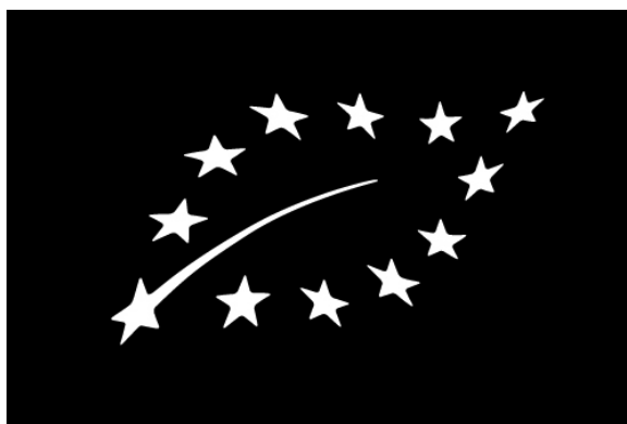
Slika 13. Eko znak EU crno bijeli, (izvor: www.ekorazvoj.hr )