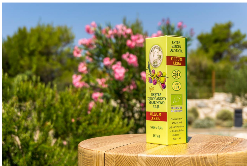
Slika 6. Ekstra djevičansko ekološko maslinovo ulje „ Oleum Arba “, 187 ml, (izvor: www.natura-rab.hr )