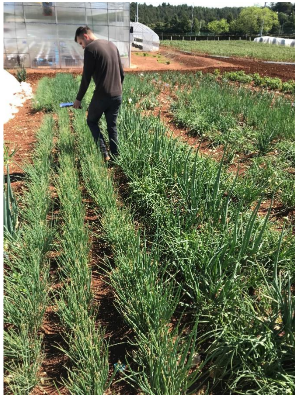
Slika 3. Mjerenje vegetacijskog indeksa

Izvor: https://agriculture.trimble.com/product/greenseeker-handheld-crop-sensor/