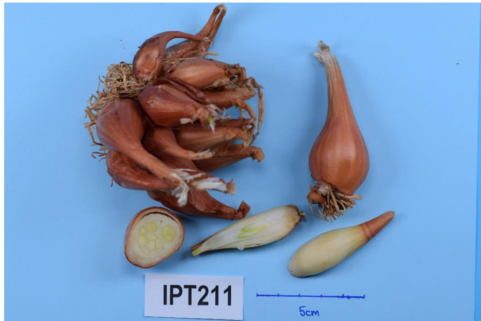
Slika 21. Primka IPT211

vrste većina primki se značajno razlikovala od primki IPT211 i IPT021, a u nastavku su navedene primke koje se nisu razlikovale: IPT176, IPT208, IPT216, IPT218, IPT225, IPT230. Najmanje očitavanje komponente b* bilo je kod primke IPT232 ( 15,1 \pm 2,34 ), koja pripada vrsti A. cepa Aggregatum. Vrijednosti za komponentu a* nisu bile signifikantno različite.