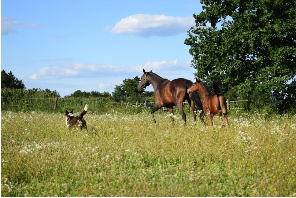
Slika 3. Kobila sa ždrijebetom