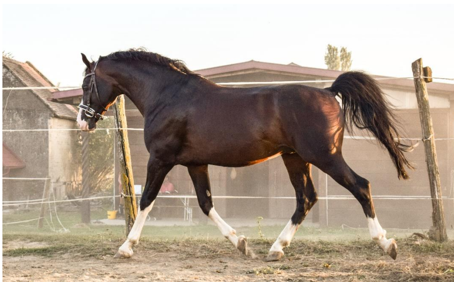
Slika 5. Rasplodni pastuh