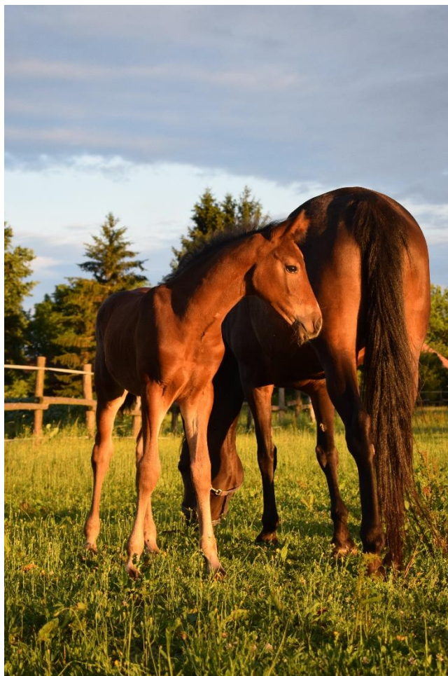
Slika 6. Ždrijebe s kobilom

Period hranidbe mlijekom traje 5 do 6 mjeseci. Zbog vrlo intenzivnog porasta ždrebadi mlijeko brzo postane nedovoljan izvor hranjivih tvari. Zato se već krajem drugog tjedna života ide sa prihranjivanjem ždrebadi suhom hranom. Od suhe hrane koristi se kvalitetno sjeno i zob, pšenično posije, a može se ždrijebe zajedno držati sa majkom na ispaši. Osim toga ždrijebe se može hraniti sa kompletnom krmnom smjesom za dodatnu hranidbu (Mitošević i Grulić, 2003.).