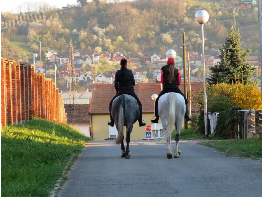
Slika 4. Rekreativni konji u terenskom jahanju