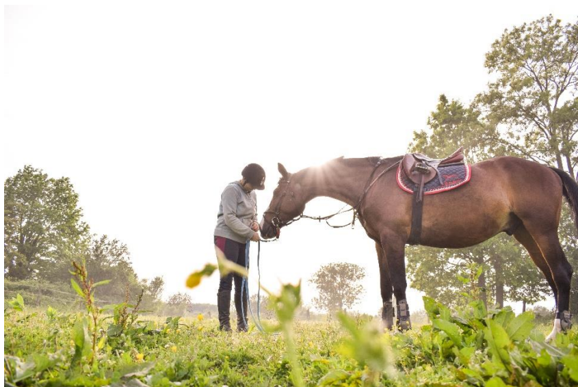
Slika 7. Sportski konj