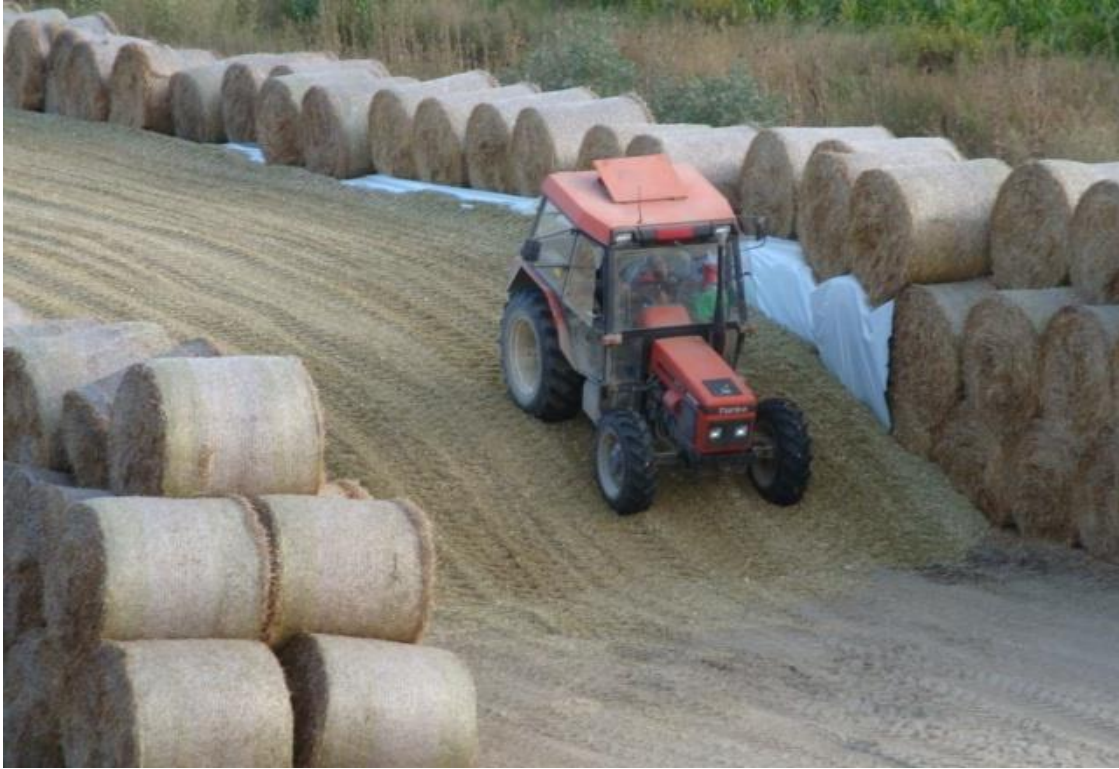
Slika 4 Nagazivanje mase (silaza)