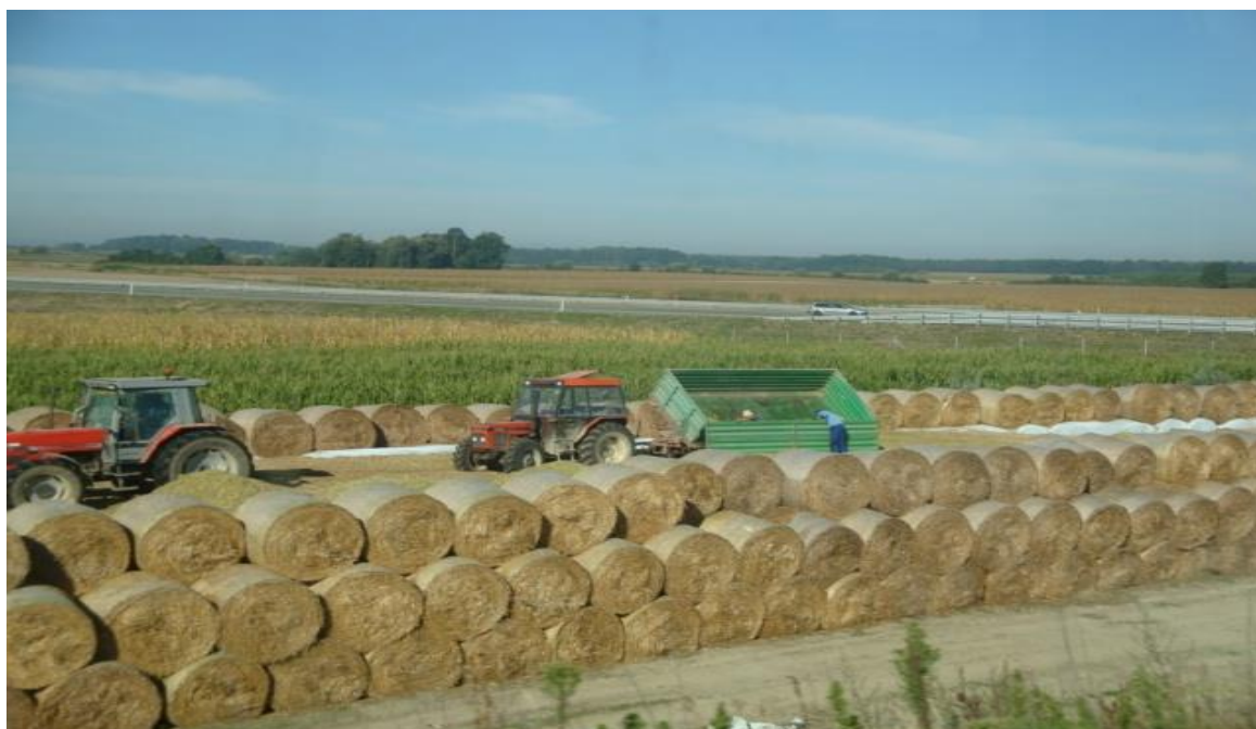
Slika 3 Improvizirani silosi na istraživanom OPG-u Foto: Matej Kovaček, 2019.