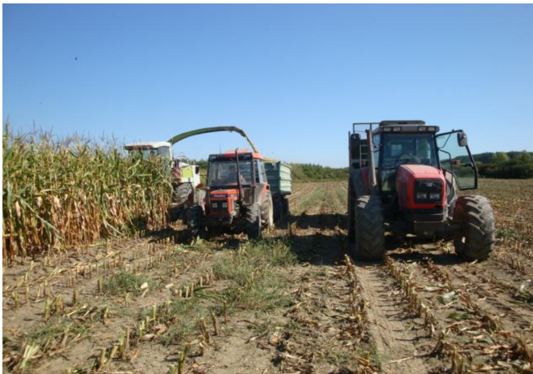
Slika 2 Košnja silažnog kukuruza