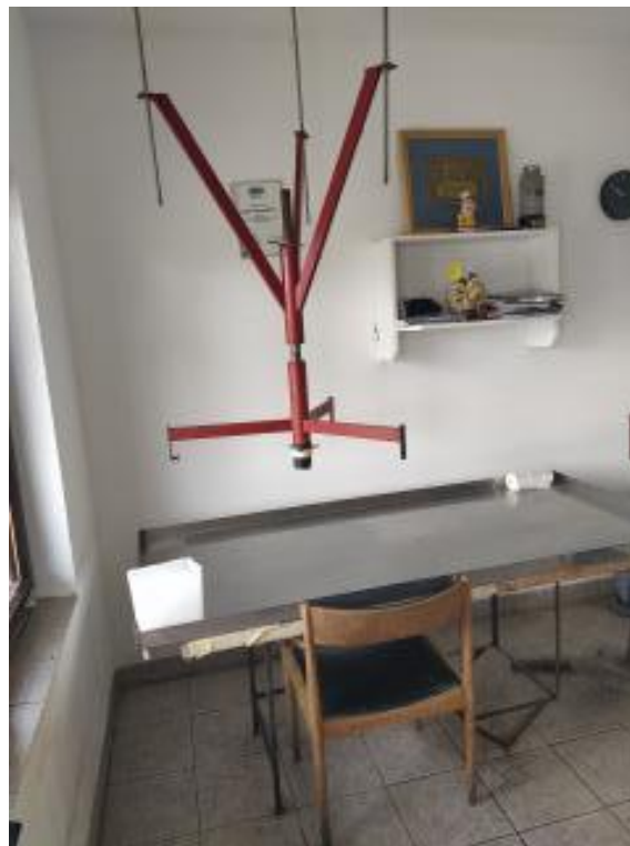
Slika 1. Stroj za pakiranje mlijeka

Proizvodni proces sastoji se od toga da se na vlastitim ratarskim površinama proizvodi krma potrebna za hranidbu goveda, posebice muznih krava od kojih se dobiva mlijeko, koje zatim kreće putem prodaje. Proizvedeno sirovo mlijeko pakira se u pakiranja od 2 do 5 litara i razvozi po okolnim selima (Slika 1.), a ostatak mlijeka dalje se plasira mliječnoj industriji Dukat.