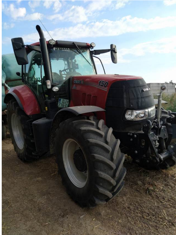
Slika 4. Traktor Case