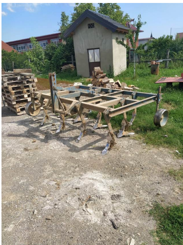
Slika 7. Gruber