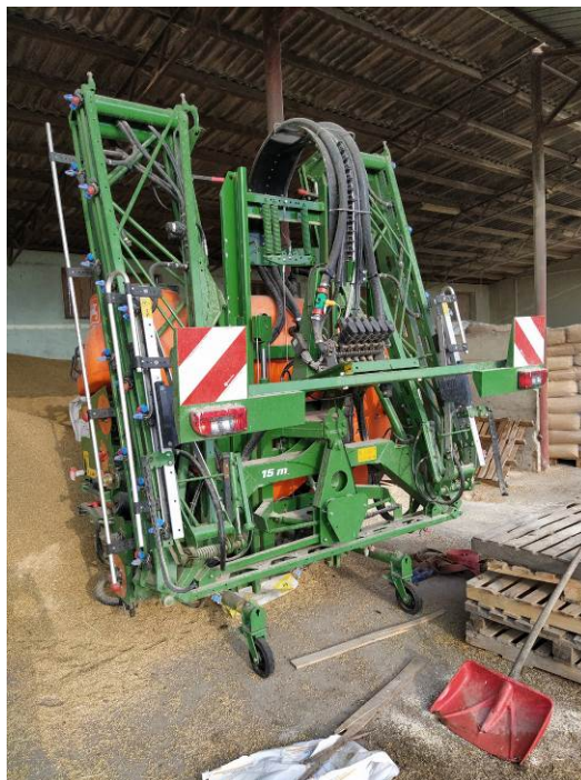
Slika 9. Traktorska šprica