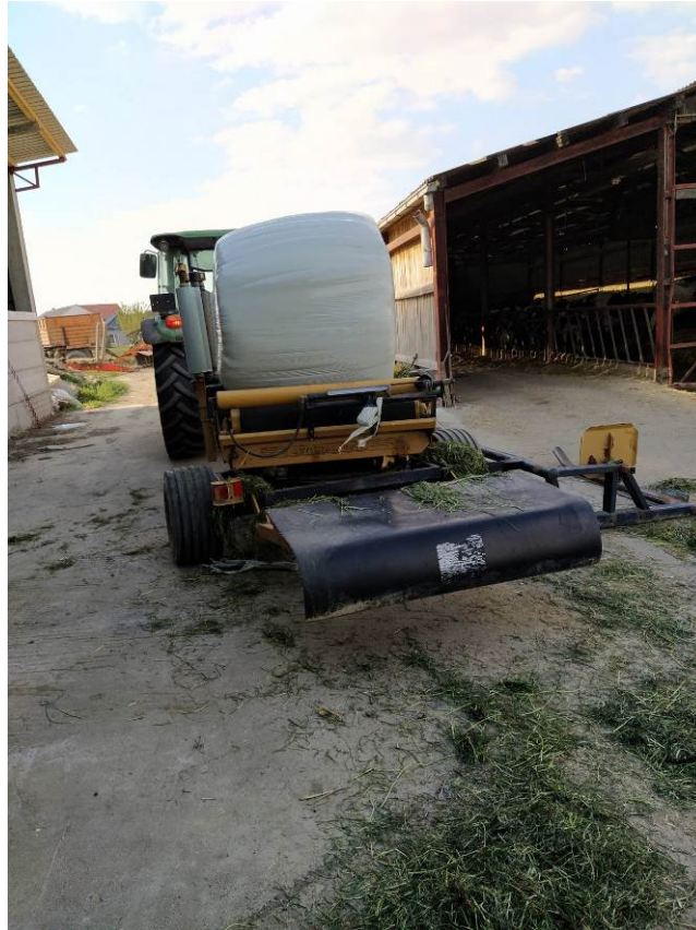
Slika 14. Spremanje sjenaže