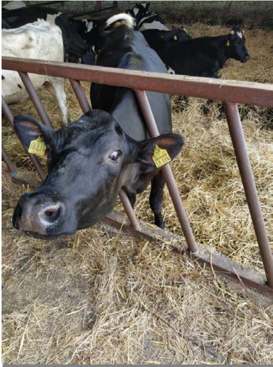
Slika 15. Holstein