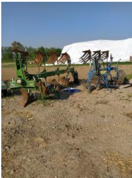
Slika 6. Plugovi premetnjaci