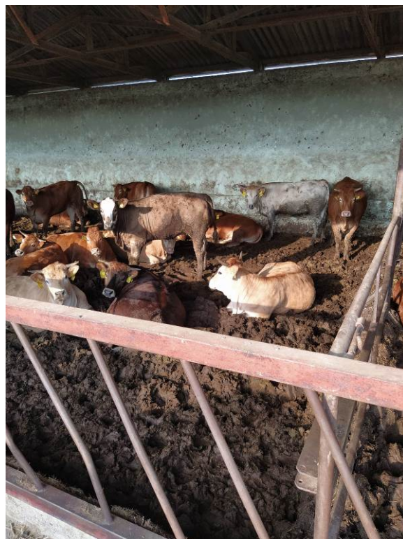
Slika 17. Junad u tovu