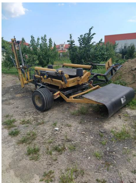
Slika 12. Omotač za sjenažu