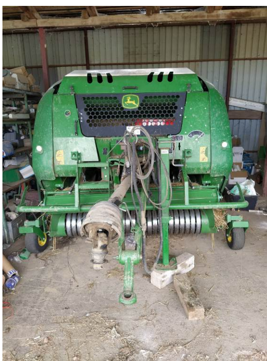
Slika 11. Presa za sijeno i slamu