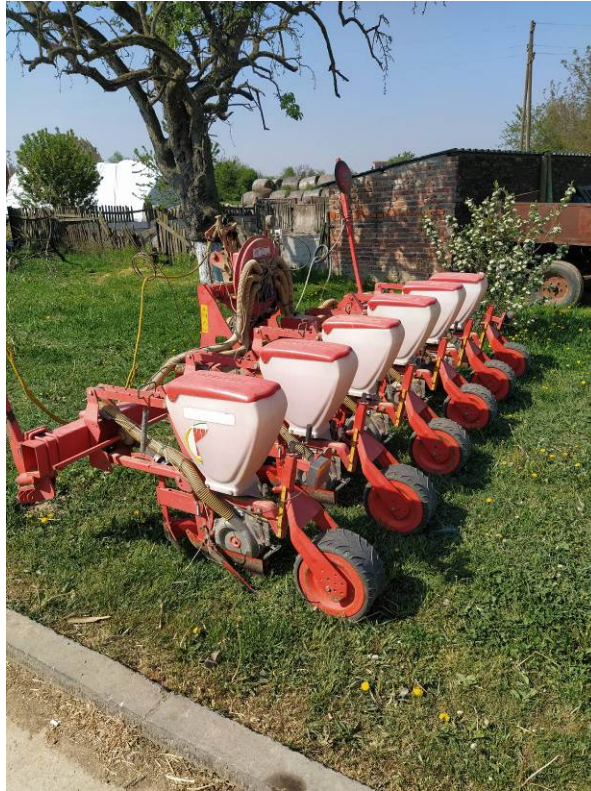
Slika 8. Sijačica za kukuruz