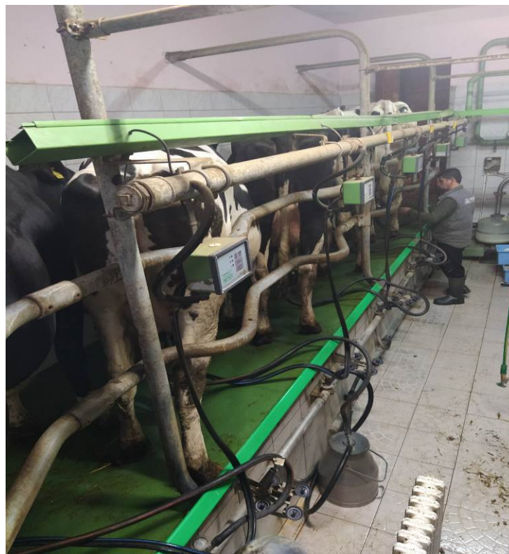
Slika 2. Mužnja krava

Što se tiče proizvodnje mlijeka ona se temelji na dvije vrste pasmine goveda, a to su Holstein pasmina koja je više zastupljena te ujedno i najpoznatija mliječna pasmina i Simentalska pasmina koja je manje zastupljena na farmi. Proizvodnja sirovog mlijeka ostvaruje se kroz dvije smjene strojne mužnje i to u jutarnjim satima, te potom u večernjim satima. Mužnja se obavlja na principu riblje kosti (2x5) tj. muze se 10 krava odjednom (Slika 2.) Za tov junadi uzgajaju se pasmine: Limousine, Angus i Plavo belgijsko govedo.