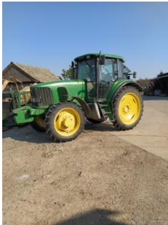
Slika 5. Traktor John Deere