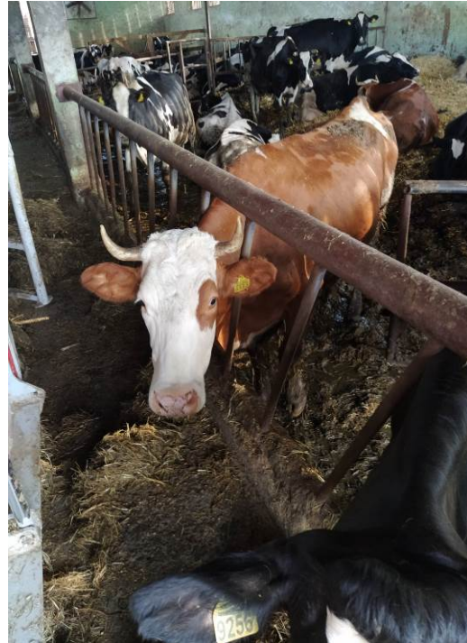
Slika 16. Simental