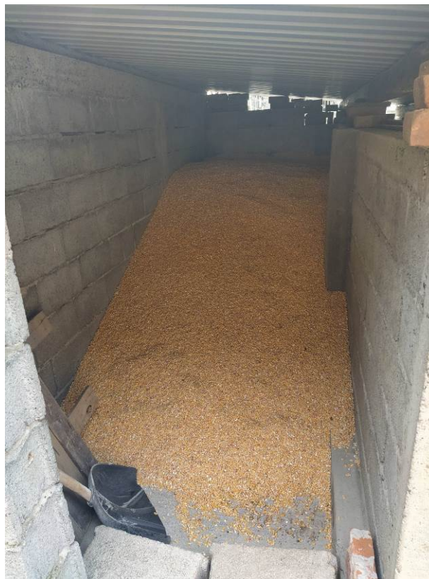
Slika 13. Kukuruz u silosu