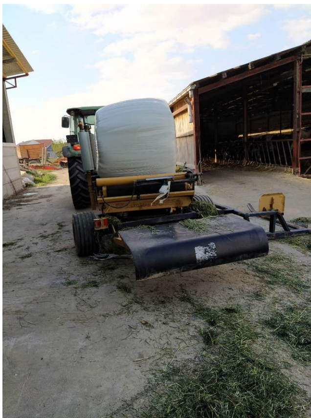
Slika 14. Spremanje sjenaže