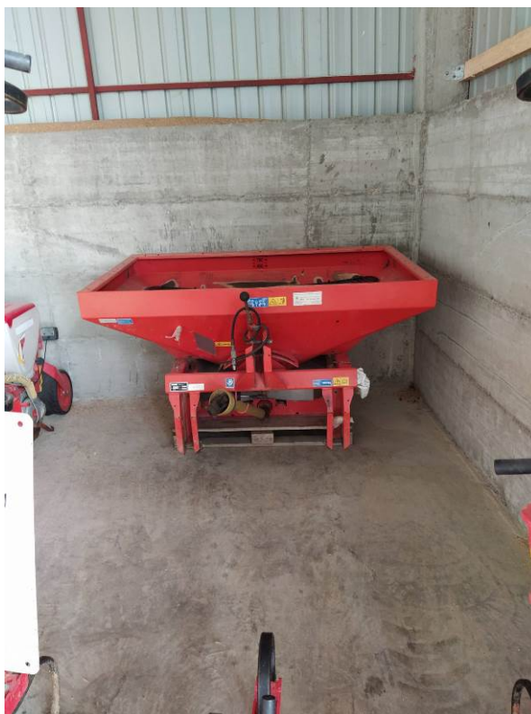
Slika 10. Rasipač mineralnog gnojiva