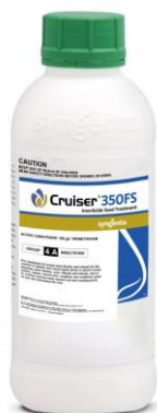
Slika 4. Insekticid Cruiser 350FS

Sredinom travnja kukuruz je tretiran Laudisom 2l/ha. Laudis je sistemski herbicid za suzbijanje nekih jednogodišnjih travnih i širokolisnih korova u merkantilnom kukuruzu te kukuruzu za zrno i silažu. Tretiranje je obavljeno prskalicom marke Agromehanika 1000 l priključenom na traktor Deutz fahr. Od mjera njege treba spomenuti samo jednu međurednu kultivaciju koja je obavljena je 10. svibnja 2017. i 14. svibnja 2018.godine kultivatorom koji obuhvaća 4 reda.