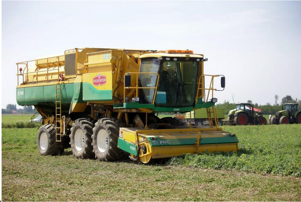
Slika 8. Žetva graška