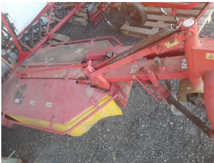
Slika 10. Traktorska kosilica

Košnja se obavlja traktorskim kosilicama (Slika 10.). Nakon toga lucerna se ostavlja na polju dok se ne osuši. Kada se jedna strana osuši, grabljama se okreće na drugu stranu kako bi se i ona dobro osušila. Zatim se grabljama skuplja više redova u jedan veći red i na kraju dolazi baliranje, sijeno je spremno za odvoz s polja i spremanje u prostorije predviđene za to.