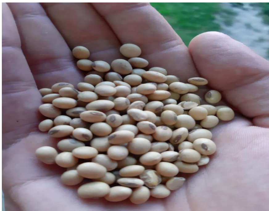
Slika 6. Sjeme soje