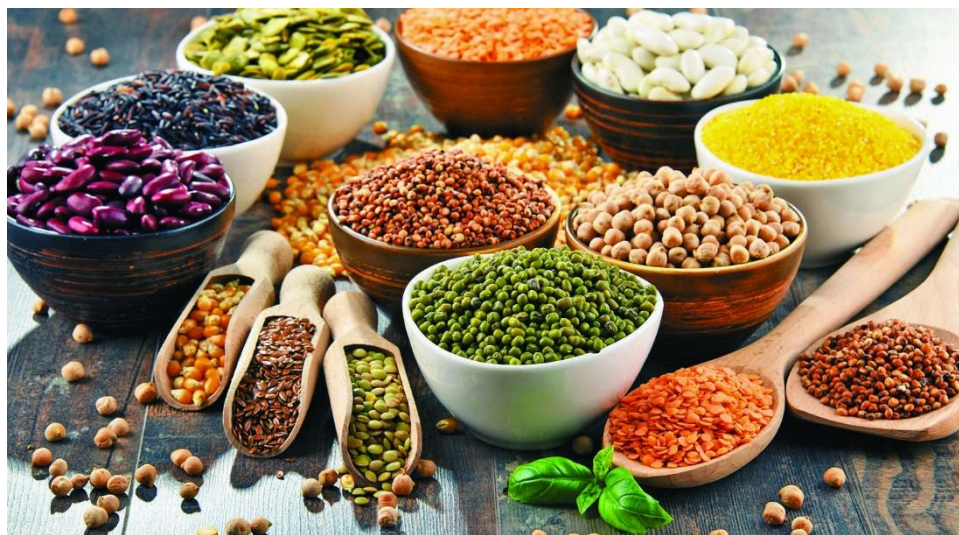
Slika 1. Mahunarke

Leguminoze su porodica koja je poznatija pod nazivom mahunarke. Mahunarke formiraju plod koji se naziva mahuna. Jedna od najvećih prednosti mahunarki je simbioza s bakterijama koje fiksiraju dušik iz atmosfere u tlo, što utječe na manju potrebu za prihranom mineralnim oblikom dušika, a samim time smanjuju se troškovi poljoprivredne proizvodnje. Mahunarke su odličan predusjev za strne žitarice jer ostavljaju puno dušika u tlu koje sljedeća kultura može iskoristiti. Najznačajniji predstavnici mahunarki su soja, grah, grašak i bob (Slika 1.) zbog svojih visokih nutritivnih vrijednosti. Mahunarke su bogate ugljikohidratima te su dobra prehrana i za ljude i za životinje. Zbog svoje nutritivne vrijednosti, kemijskog sastava i velike količine bjelančevina zrno i plod mahunarki često se koriste u ljudskoj prehrani. Preradom mahunarki dobivaju se različiti prehrambeni proizvodi, a nusproizvodi se koriste u prehrani životinja. Također, za prehranu domaćih životinja može se koristiti zeleni dio biljke u svježem ili suhom stanju. Isto tako zrno mahunarki može se koristiti kao koncentrat u pripremi stočne hrane. Tako se na primjer preradom soje dobiva kvalitetno ulje i margarin, a nusproizvodi su pogača i sačma koje koristimo u prehrani stoke.