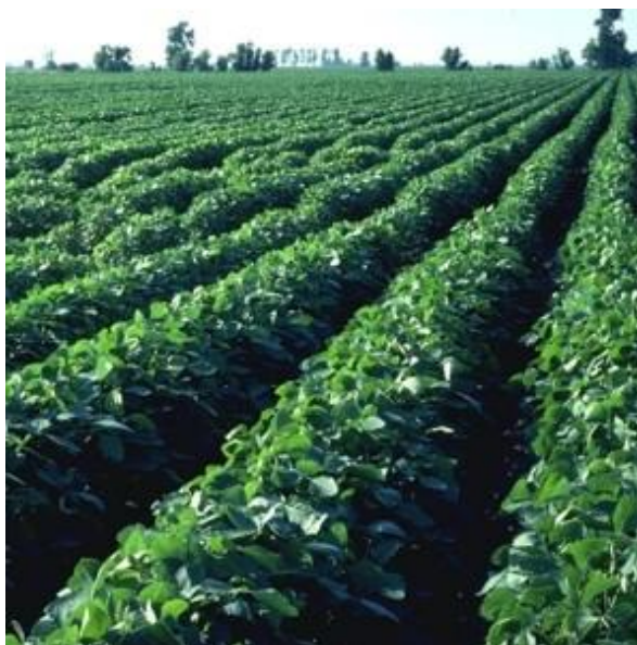
Slika 3. Usjev soje