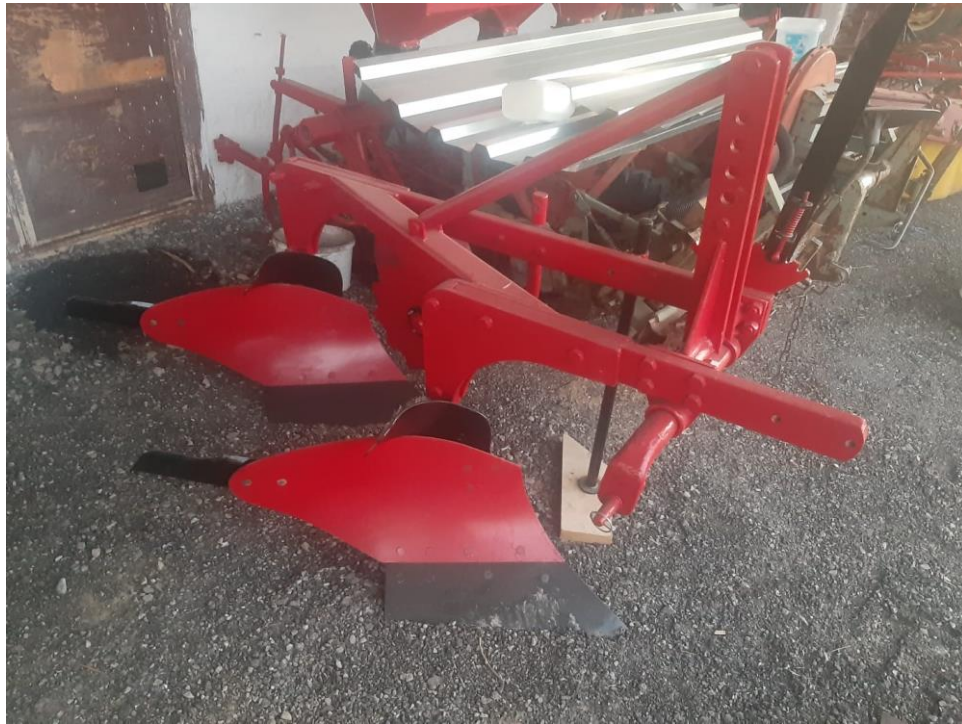
Slika 4. Plug