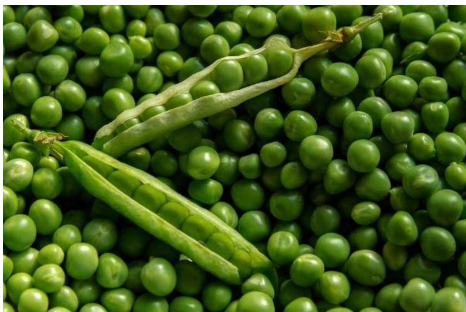
Slika 7. Mahuna i zrna graška

Grašak ( Pisum sativum L.) se dijeli na krupnosjemeni i sitnosjemeni grašak (Slika 7.). Krupnosjemeni grašak dolazi s područja Sredozemlja, dok sitnosjemeni, poput soje, dolazi iz Azije, točnije sa jugozapadnog i središnjeg dijela Azijskog kontinenta (Gagro, 1997.). Grašak je postao poznatiji zahvaljujući redovniku i genetičaru, Gregoru Mendelu. Biljka graška potječe još iz davne 9750. godine prije Krista, a svijetom se širila putem trgovačkih pravaca i pomoću ratovanja (Stjepanović i sur., 2012.). Značaj graška iznimno je velik, jer najvećim dijelom služi čovjeku za prehranu. Grašak ima veliku hranjivu vrijednost te otprilike sadrži 13% vode i 87% suhe tvari. Najveći dio suhe tvari čine ugljikohidrati kojih ima preko 50% i bjelančevine kojih ima oko 20 do 30% (Gagro, 1997.).