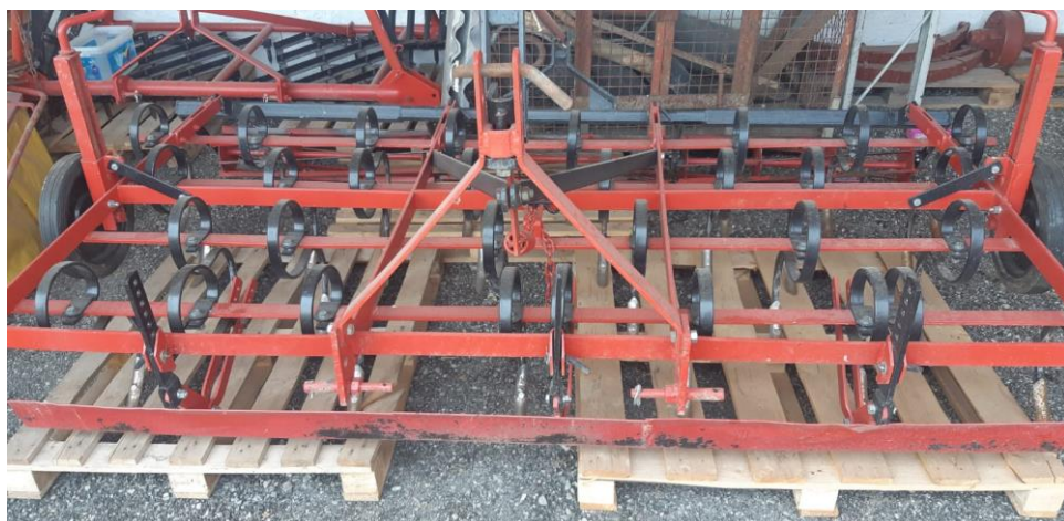
Slika 5. Sjetvospremač

Predsjetvenom obradom tla, tlo se obrađuje pomoću poljoprivredne mehanizacije kao što je: tanjurača, drljača, sjetvospremač itd. (Slika 5.). Tlo prije sjetve mora biti usitnjeno, prozračno i rahlo kako bi sjeme imalo lakši pristup vodi, kisiku, mineralima i hranjivim tvarima.