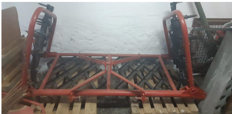
Slika 9. Drljača

se i suzbijanje korova zbog toga što se biljka bori s ostalim korovnim vrstama za svjetlost, hranjiva, vlagu.