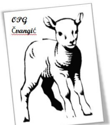
Slika 13. Figurativni žig Opg-a Čvangić

U cilju što učinkovitije promocije i komunikacije s kupcima planiramo brendirati proizvodnju i zaštititi figurativni žig. Prijava žl nalazi se u privitku.