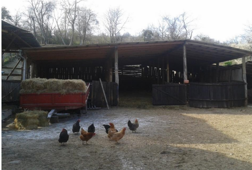
Slika 1. Ovčarnik