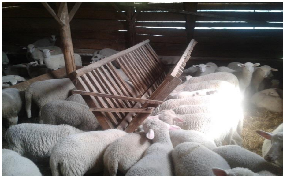
Slika 5. Prihrana dojne janjadi koncentriranom krmnom smjesom

Hranidba janjadi kao i način držanja se razlikuju od načina na koji se uzgajaju ovce. Prvo treba uzeti u obzir da janjad prvih nekoliko tjedana samo siše majčino mlijeko, a tek kasnije se uvodi prihrana koncentriranim krmnim smjesama te voluminozna krma. Kasnije u tovu, nakon odbića, janjad se u potpunosti hrani koncentriranim krmnim smjesama te suhom voluminoznom krmom.