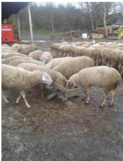
Slika 3. Prihrana ovaca zimi

Poluintenzivan način uzgoja ovaca određuje i način hranidbe te velikim dijelom utječe na smanjenje troškova hranidbe, a onda i sveukupnih troškova gospodarstva. U zimskom dijelu godine ovce se hrane koncentriranim krmivima (oko 10-15%), krmiva su sastavljena od suhog kukuruza u zrnu, ječma, tritikala i zobi te se uz njih hrane kvalitetnim voluminoznim krmivima (sijeno, suha lucerna, suhe djetelinsko travne smjese itd.). Kao što je prethodno i navedeno ovce su većinski dio godine na ispaši i hrane se zelenom voluminoznom krmom, no ako vremenski uvjeti to zahtijevaju uvodi im se i prihrana (npr. u sušnom dijelu godine kada priroda ne obiluje zelenom pašom).