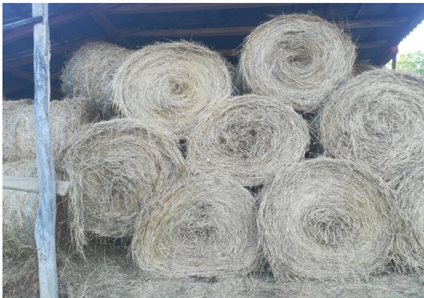
Slika 2. Skladištenje suhe voluminozne krme

Sustav uzgoja ovaca na OPG-u Bošnjaković je poluintenzivan, što znači da su ovce na ispustu u paši za vrijeme vegetacije, a to podrazumijeva veći dio godine, dok su zimi smještene u ovčarniku uz redovni ispust jednom ili dva puta na dan. Osim ovčarnika na gospodarstvu su smješteni i drugi objekti kao što su: objekti potrebni za smještaj tovine janjadi, dio za prihranu dojne janjadi, posebni prostori za ovce s malom janjadi, prostorije za odvajanje bolesnih jedinki, spremišta hrane tokom zimskih mjeseci, objekti za mehanizaciju itd.