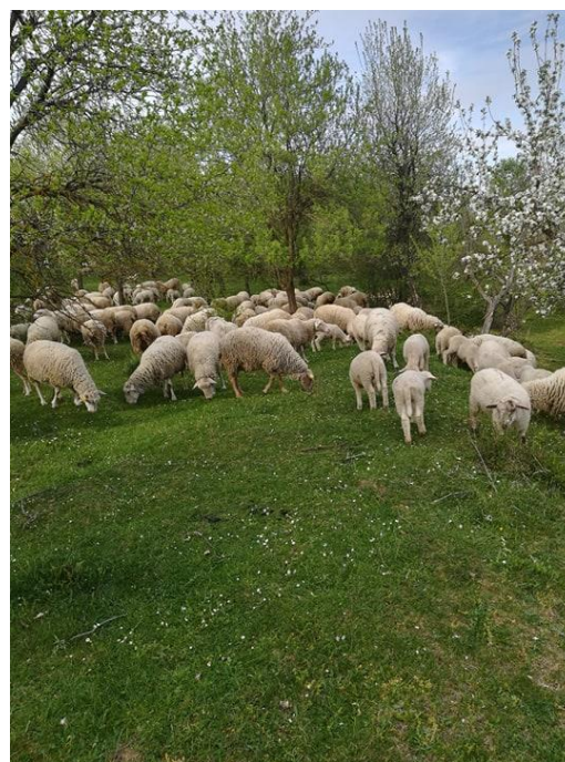
Slika 4. Ovce na paši