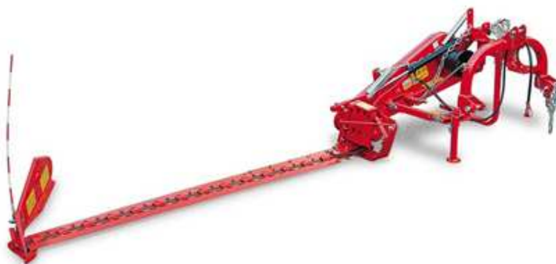
Slika 7: Oscilirajuća kosilica sa kosom i prstima (Savjetodavna, 2015.)

Oscilirajuće kosilica sa prstima ima noževe trapezastog oblika i nepokretne prste koji služe kao protuteža. Razmak između prstiju određuje visinu košnje jer savijaju biljku do prsta i odrežu je. Možemo ih podijeliti na uređaje za visoki, srednji i niski rez. Prednosti ovakvog tipa kosilice su što zahtijevaju malu pogonsku snagu, dok su im glavni nedostaci spor radni učinak i osjetljivost na neravnine.