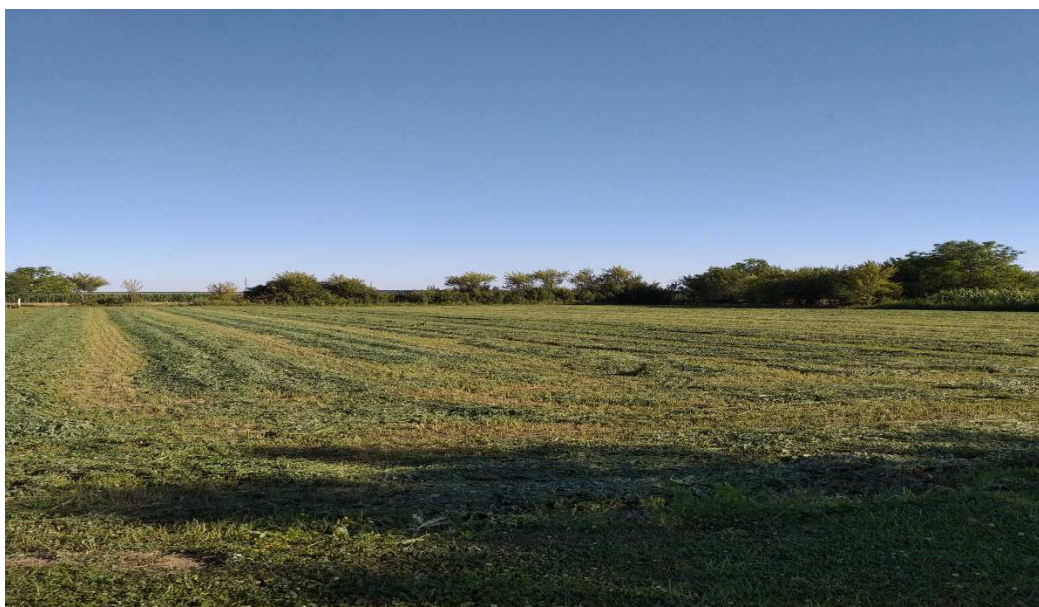
Slika 5. Pokošena livada.

Terminski, košnja prvog otkosa lucerne u Istočnoj Slavoniji trebala bi biti do 5. svibnja. Kašnjenje sa prvim otkosom smanje se broj porasta sa pet na četiri.