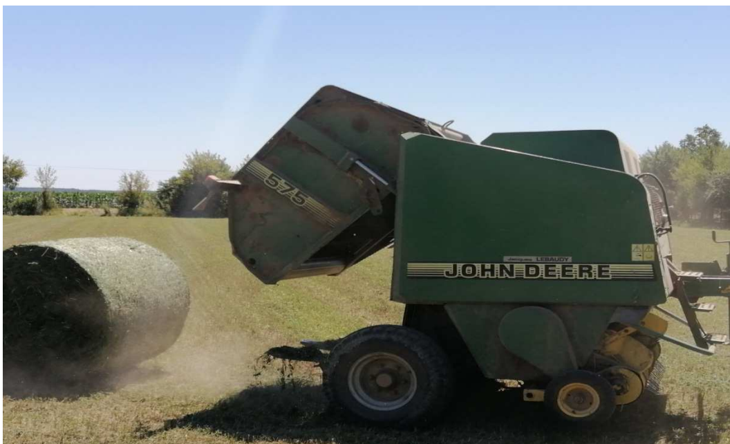
Slika 14: Preša za valjčaste bale.

U preši s komorom stalnog oblika ista od početka namatanja bale zadržava dimenzije gotove bale. Konačni promjer bale nije moguće mijenjati, a zbijenost, odnosno gustoća bale povećava se kako se komora puni navode Zimmer i sur. (2009.). Jezgra unutar bale je prozračna dok je vanjski dio zbijen da štiti od oborina. Vlaga kod ovakvih bala se tolerira do 15%.