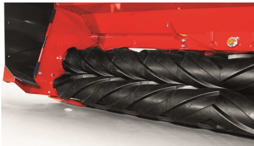
Slika 9: Gnječilice sa valjcima. Sip (2020.)

Osim osnovnih izvedbi kosilica preporuča se i korištenje gnječilicama (kondicionerima) (slika 9) i lomilice sa prstima (slika 10) koje mehanički usitnjavaju stabljiku i dolazi do ravnomjernijeg sušenja stabljike i lista. Stjepanović i sur (2010.) navode da se korištenjem kosilice sa kondicionerom ubrzava sušenje krme u polju pa se u ranim večernjim satima (oko 17 h) dobiva oko 40 do 70% suhe mase, a košnjom bez kondicionera dobiva se oko 32% suhe mase. Ubrzavanjem procesa sušenja smanjujemo mogućnost da sijeno pokisne i da se smanji sadržaj suhe tvari.