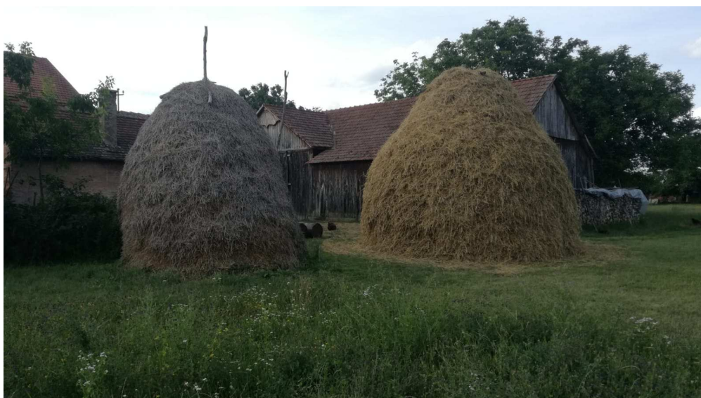
Slika 6. Stog sijena.

Zbog količine šećera i škroba (NET) koji su najniži u jutarnjim satima jer ih biljka tijekom noći koristi za disanje vrlo je važno odrediti u kojem dobu dana ćemo kositi kako bi imali najmanje gubitke hranjivih tvari. Gubici koje ima krma tijekom disanja noću povećavaju se s vlagom u voluminoznoj krmi i temperaturom okoline. U praksi to znači da započinjemo kositi kad se osuši rosa ili ovisno o dijelu R. Hrvatske, oko 10 sati prije podne navodi Gospodarski (2010.).