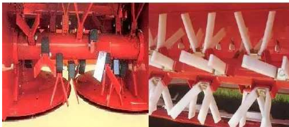
Slika 10: Lomilica s prstima. Stjepanović i sur. (2009.)

Osim osnovnih izvedbi kosilica preporuča se i korištenje gnječilicama (kondicionerima) (slika 9) i lomilice sa prstima (slika 10) koje mehanički usitnjavaju stabljiku i dolazi do ravnomjernijeg sušenja stabljike i lista. Stjepanović i sur (2010.) navode da se korištenjem kosilice sa kondicionerom ubrzava sušenje krme u polju pa se u ranim večernjim satima (oko 17 h) dobiva oko 40 do 70% suhe mase, a košnjom bez kondicionera dobiva se oko 32% suhe mase. Ubrzavanjem procesa sušenja smanjujemo mogućnost da sijeno pokisne i da se smanji sadržaj suhe tvari.