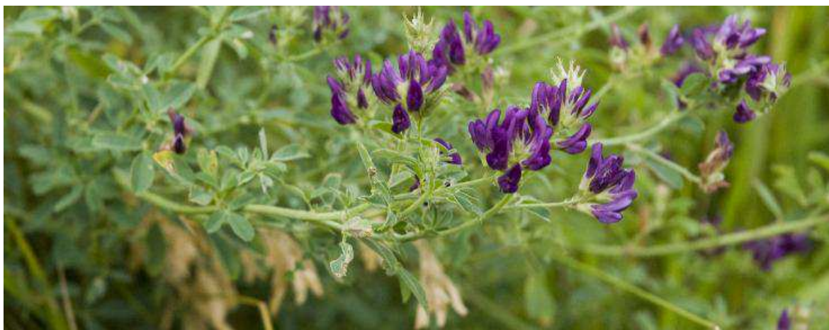
Slika 3. Lucerna ( Medicago sativa L.) (Agronomija, 2017.)

Iako je uzgajana još od sedmog stoljeća u Mezopotamiji i Arabiji, lucerna se uzgaja u našim krajevima posljednjih 150 godina. Danas je postala najvažnija krmna kultura na oranicama. Kosidba je najčešći način korištenja lucerne. Stjepanović i sur. (2009.) navode da se kao optimalnu fazu u košnji lucerne u intenzivnoj proizvodnji može smatrati fazu pupanja do početka cvjetanja, jer se tada postižu najveći prinosi hranjivih tvari po jedinici površine.