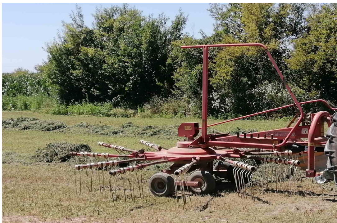
Slika 11: Rotacijske grablje. Foto: Marija Vidić (2020.)

Za raširivanje, natresanje i okretanje pokošene mase upotrebljavaju se grablje koje se nazivaju natresači i okretači sijena navode Zimmer i sur. (2009). U ovom procesu važno nam je da se okretač može prilagođavati širini otkosa.