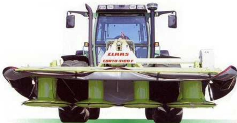
Slika 8: Prednja nošena rotacijska kosilica s bubnjevima. Savjetodavna (2015.)

Prema Rotzu i Shinnersu (2007.) rotirajuće kosilice sa bubnjevima prevladavaju u korištenju za košnju sijena unatoč nedostacima kao što su zahtjevi za velika pogonsku snagu, zahtijevaju dvostruko više snage od diskosnih i imaju neravnomjernu košnju što otežava sušenje mase. Gubici prinosa kod obje vrste kosilica u sličnim uvjetima su otprilike jednaki.