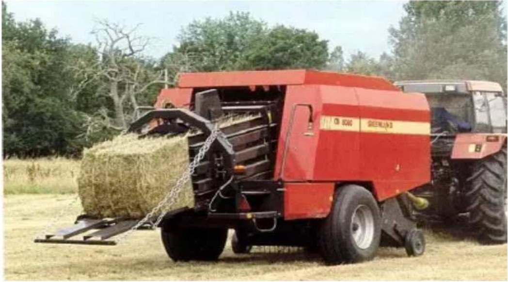
Slika 13: Preša za velike četvrtaste bale. Zimmer i sur. (2009.)