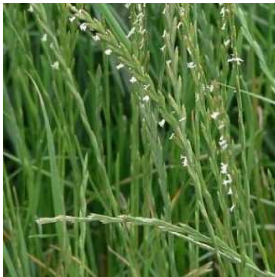
Slika 4. Engleski ljulj ( Lolium perenne L.) (Agroklub, 2020.)