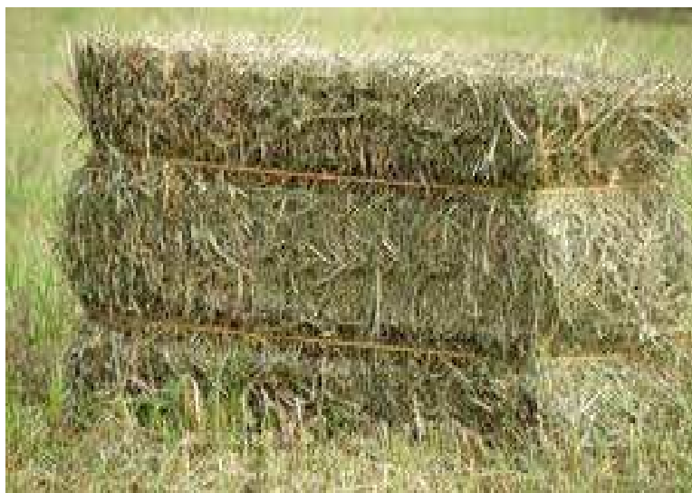
Slika 12: Četvrtasta bala. Agrologistika (2019.)

Velike vučene preše oblikuju bale prema transportnom sredstvu. Širina i visina bala može biti ista ili različita. Dužina također varira, ovisno ovrsti suhe mase koju baliramo, može biti od 60 cm (sjenaža) do 240 cm (slama). Kod takvih preša prešanje je u pravcu rada, a vezanje bala obavljaju četiri ili šest vezača (Zimmer i sur. 2009.). Preporučljiv sadržaj vlage u ovakvom tipu bala je 12-16 % ali kod dužeg skladištenja preporučljivo je 12 %. Prednosti ovakvih bala su lakši transport na veće udaljenosti i lakše skladištenje od okruglih bala.