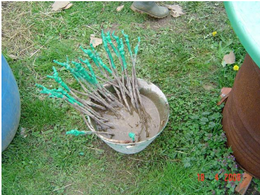
Slika 9. Priprema cijepa za sadnju

Cijepljene europske plemenite loze na podlogu je ustvari jedini racionalni način borbe protiv trsnog ušenca jer na korijenu američke loze ne čini štetu. Osim cijepljenja loze, vinogradari u želji da spase svoj vinograd pribjegli su očajnim mjerama poput plavljenja vinograda vodom. Korištenje insekticida na bazi cijanida koja su bila neizmjereno skupa također su bila jedna od mjera borbe protiv filoksere