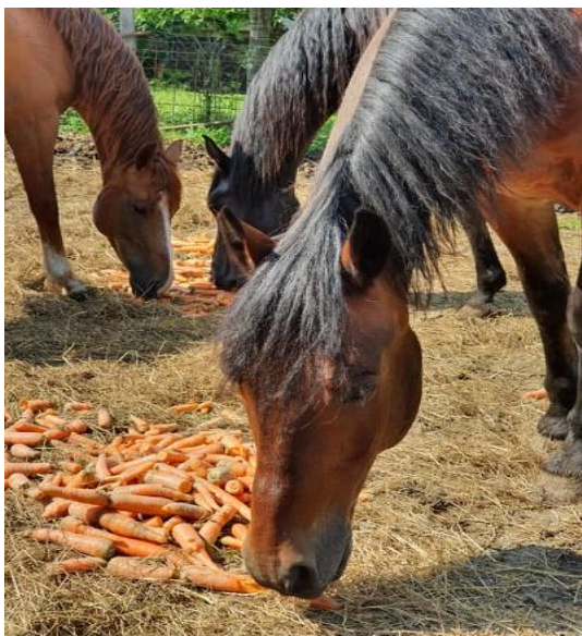
Slika 11. Stočna mrkva i jabuke (Izvor: Mesarić,2020.) Slika 12. Stočna mrkva (Izvor: Mesarić,2020.)