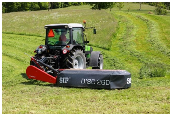
Slika 13. Pikaz roto kose SIP 260

Lucerna se proizvodi na oko jedan hektar za potrebe hranidbe konja najviše tijekom zimskog perioda. Intenzivno se iskorištava 3 godine. U prosjeku se kosi 5 puta godišnje u fazi početka cvatnje košnja se obavlja rotacijskom SIP kosom (slika 13.), a proizvodnja sijena je oko 17 tona godišnje. Sušenje se odvija na polju. Kod sušenja bitno je u pravo vrijeme pokupiti sjeno iz razloga što može doći do značajnih gubitaka (Tablica 9.). Razlog tome je što list puno brže gubi vlagu od stabljike te ako se presuši otpada. Prema Rotzu (1988.) gubitci prilikom sušenja sjena lucerne mogu biti preko 80 %. Najveći utjecaj na sušenje ima vlaga i temperatura. Lucerna se ne koristi u svježem stanju jer uzrokuje nadimanje, jedan od glavnih uzroka nadimanja su saponini.