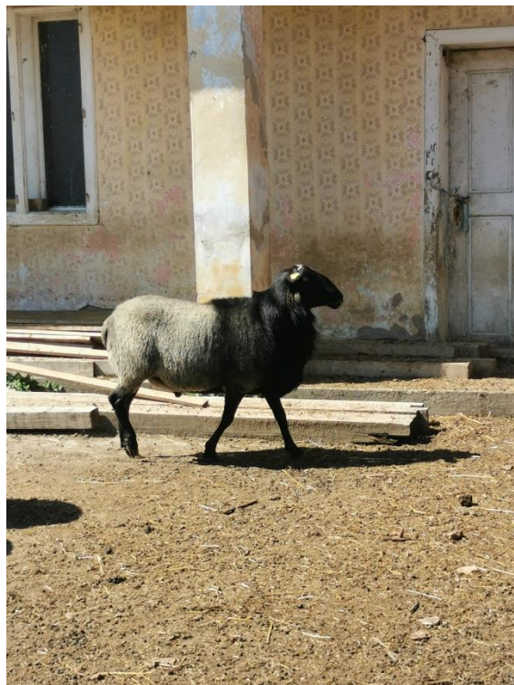
Slika 10. Ovan romanovske pasmine

Gospodarstvo svoju djelatnost temelji na proizvodnji te uzgoju janjadi no dobit još uvijek nije velika. Nadamo se povećanju poslovanja s čime će doći i zadovoljavajuća financijska dobit. U budućnosti uzgoja ovaca značajan čimbenik predstavlja nam potpora uzgajivača ovaca, a jako veliku ulogu ima i Ministarstvo poljoprivrede. Veliku ulogu u budućnosti uzgoja predstavljaju nam državne mjere poput novčanih potpora za upisana i matična grla te uvođenje povoljnih kredita.