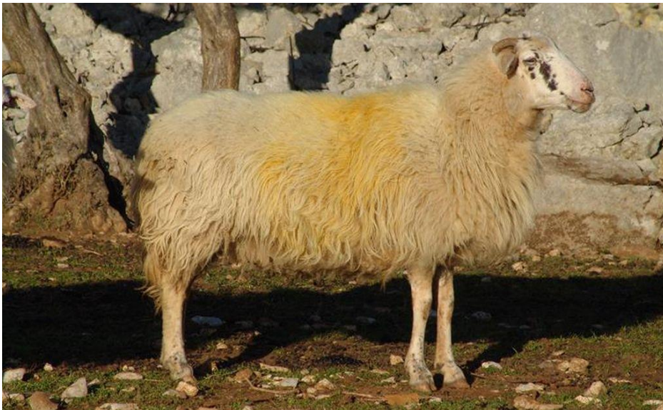
Slika 7. Krčka ovca

Krčka ovca je autohtona pasmina nastala na otoku Krku. Kroz povijest, razvojem tekstilne industrije, došlo je do oplemenjivanja naših lokalnih pramenki s različitim uvoznim pasminama merina. Pretpostavke su da je na taj način nastala i krčka ovca. Krčka je ovca kombiniranih proizvodnih osobina, no trenutno je primarna proizvodnja meso. Visina grebena ovaca iznosi 53 do 58 cm, a ovnova 57 do 62 cm. Tjelesna masa ovaca iznosi 30-40 kg, a ovnova 35-45 kg. Plodnost ove pasmine kreće se od 100 do 140 %. Tjelesna masa janjadi u dobi od 45-60 dana je 12-15 kg. Proizvodnja mlijeka iznosi 100 do 150 litara (HSUOK, 2005.).