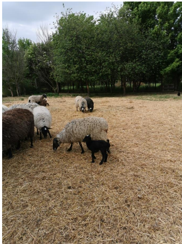
Slika 12. Ovca s janjetom