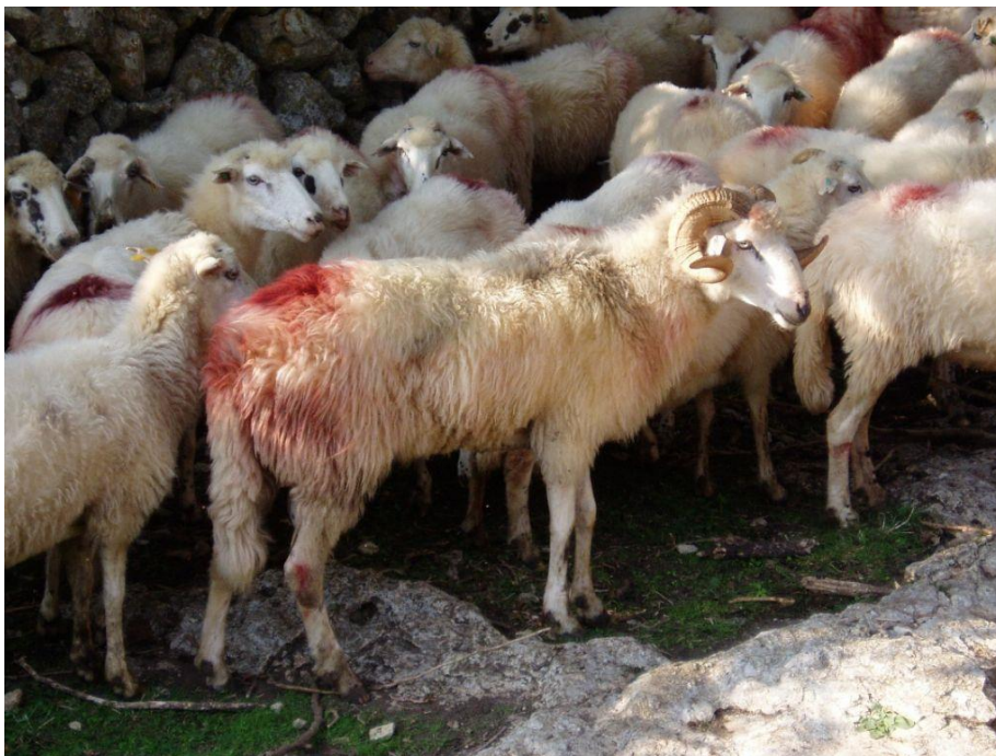
Slika 5. Creska ovca

Uzgojno područje creske ovce su otok Cres i Lošinj. Veliki dio površina na otoku Cresu čine krški pašnjaci gdje se uzgajaju samo autohtone pasmine ovaca. Nešto skromnije proizvodne osobine creske ovce i dalje mogu osigurati relativne prihode poljoprivrednim gospodarstvima. Creska ovca je kombiniranih proizvodnih osobina. Prema potrebama potrošača kroz povijest se mijenjala proizvodna namjena stada. Nekada je glavni proizvod bila vuna, a danas dominira proizvodnja ovčjeg mesa poznata kao mlada creska janjetina. Mali broj gospodarstava proizvodi polumasni ovčji sir. Prema tablici poželjne tjelesne mjere i proizvedene odlike vidljivo je kako bi visina grebena trebala iznositi od 60-65 cm, a kod ovnova 66-70 cm. Poželjna tjelesna masa creske ovce iznosi 35-45 kg, a ovnova 42-50 kg. Dok bi poželjan postotak plodnosti trebao iznositi 120-140 %. Proizvodnja mlijeka iznosi 80-120 litara (HSUOK, 2005.).