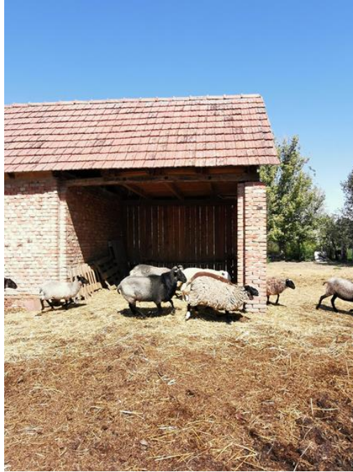
Slika 14. Poluotvoreni tip uzgoja

Na gospodarstvu gdje se trenutno nalazi stado ovaca nema posebne zaštitne ograde od grabežljivaca te je potreban pas čuvar. To je srednjeazijski ovčar (Alabai). Prvobitno su ovi psi uzgajani za čuvanje ovaca od vukova i ostalih predatora iz prirode. Alabai je pogodan za čuvanje stada jer jako dobro procijenjuje stvarnu opasnost te pokazuje nepovjerenje prema strancima koji se nađu među stadom.