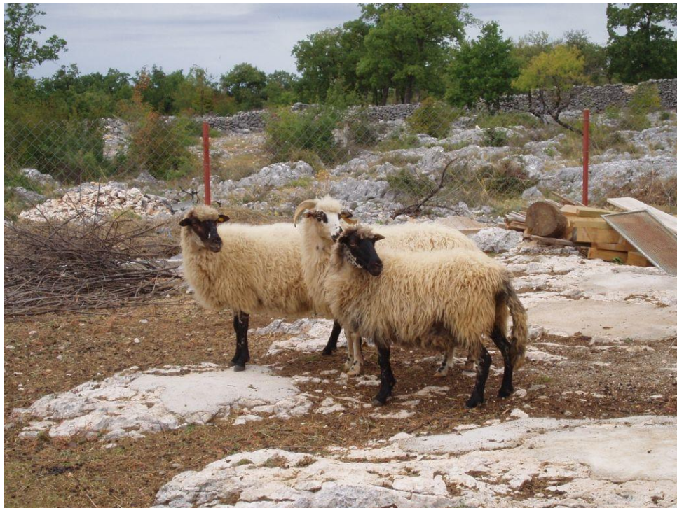
Slika 1. Dalmatinska pramenka

Dalmatinska pramenka najbrojnija je autohtona pasmina u Hrvatskoj. Rasprostranjena je širom Dalmacije i srednjedalmatinskim otocima. Neke od glavnih karakteristika dalmatinske pramenke su otpornost, snalažljivost, prilagodljivost te snažna konstitucija i tjelesna građa zbog koje se upravo ova pasmina većinom koristi za proizvodnju mesa, a u pojedinim slučajevima i gospodarstvima za proizvodnju mlijeka koje se prerađuje u domaći sir i ostale mliječne proizvode. To dovodi do zaključka da je upravo ova pasmina kombiniranih proizvodnih osobina. Prema podacima iz Hrvatskog saveza uzgajivača ovaca i koza poželjne tjelesne mjere i proizvodne odlike dalmatinske pramenke su te da visina grebena iznosi od 55-60 cm kod ovaca, a kod ovnova 60-65 cm. Tjelesna masa ovaca trebala bi iznositi 35-45 kg dok bi ovnovi trebali težiti 45-55 kg. Plodnost dalmatinske pramenke seže od 120-140 %, a tjelesna masa janjadi (dob 45-60 dana) iznosi 28-32 kg (HSUOK, 2005.).