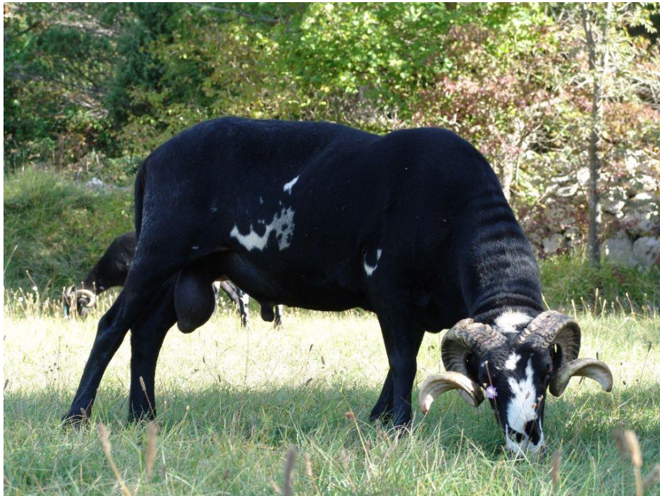
Slika 4. Istarska ovca

Pasmina istarska ovca uzgaja se na području Istre, gdje je i nastala. Ova pasmina pripada skupini ovaca kombiniranih proizvodnih osobina. Istarska ovca isključivo je namijenjena proizvodnji mlijeka, koje se kasnije prerađuje u polutvrđi, punomasni ovčji sir. Istarska ovca proizvodi od 220-350 l mlijeka. Temeljna boja runa je bijela sa smeđim, crnim ili crno-smeđim pjegama. Visina grebena je 76-80, a kod ovnova 82-88 cm. Poželjna tjelesna masa ovaca iznosi 60-70 kg, a ovnova 80-100 kg. Plodnost u postocima iznosi 130-150. Tjelesna masa janjadi u dobi od 45-60 dana iznosi 18-22 kg (HSUOK, 2005.).