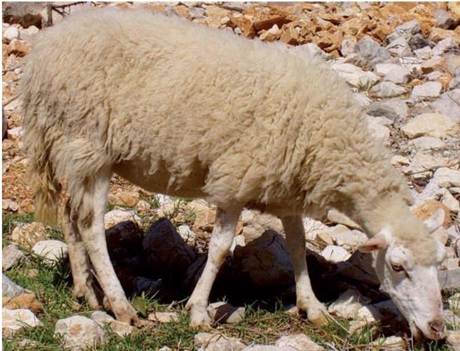
Slika 6. Rapska ovca

Rapska ovca je hrvatska izvorna pasmina ovaca koja je nastala na otoku Rabu, gdje se i uzgaja. Lokalni naziv za ovu pasminu je „Škraparica“. Rapska ovca većinom se uzgaja zbog mesa, jer je mliječnost ove pasmine izrazito skromna, a iznosi od 80 do 100 litara u 150 dana laktacije. Mali broj uzgajivača ove pasmine proizvodi mlijeko od kojeg nastaje punomasni tvrdi rapski sir. Visina grebena rapske ovce iznosi od 55 do 60 cm, a ovnova od 60-64 cm. Tjelesna masa ovaca iznosi 35-45 kg, a ovnova od 40-50 kg. Plodnost je u rasponu od 100 do 140 %. Tjelesna masa janjadi u dobi od 45-60 dana iznosi 15 do 18 kg (HSUOK, 2005.).