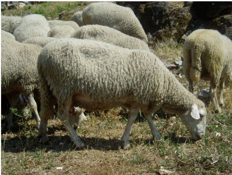
Slika 9. Dubrovačka ruda

Dubrovačka ruda ubraja se među ugrožene izvorne pasmine. Ova pasmina uzgaja se na dubrovačkom području te područje prema Hercegovini. Niska tržišna vrijednost vune uvjetovala je smanjenju broja grla. Zadnjih godina došlo je do povećanja i stabilizacije populacije ove pasmine te spada u manje ugroženu skupinu. Visina grebena Dubrovačke rude iznosi 58-62 cm, a ovnova 62-66 cm. Težina se kreće od 45-50 kg, a kod ovnova 50-55 kg. Tjelesna masa janjadi u dobi od 45-60 dana iznosi 15-18 kg (HSUOK,2005.).