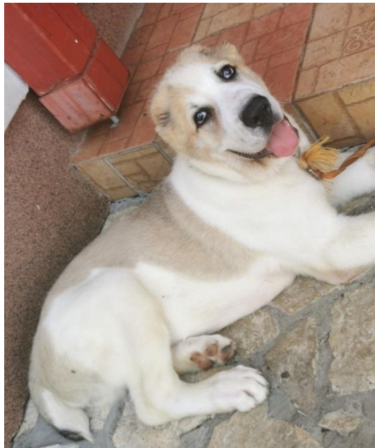
Slika 15. Štene srednjeazijskog ovčara, čuvar stada

Na gospodarstvu gdje se trenutno nalazi stado ovaca nema posebne zaštitne ograde od grabežljivaca te je potreban pas čuvar. To je srednjeazijski ovčar (Alabai). Prvobitno su ovi psi uzgajani za čuvanje ovaca od vukova i ostalih predatora iz prirode. Alabai je pogodan za čuvanje stada jer jako dobro procijenjuje stvarnu opasnost te pokazuje nepovjerenje prema strancima koji se nađu među stadom.