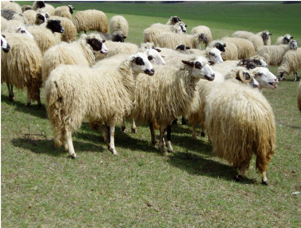
Slika 3. Lička pramenka

Lička pramenka je autohtona pasmina koja se uzgaja u gorskim područjima gdje je i nastala. Lička pramenka ima važnu ulogu u njegovanju tradicije ovog kraja. Tradicionalne ličke narodne nošnje i ličke čarape proizvedene su od vune upravo ove pasmine. Iako je ova pasmina kombiniranih proizvodnih osobina. Primarni proizvod ove pasmine je meso poznato kao lička janjetina. Prosječna je visina grebena od 60-65 cm, dok je kod ovnova 67-72 cm. Tjelesna masa ovaca iznosi 45-55 kg, a ovnova 65-75 kg. Raspon postotka plodnosti kreće se od 120-150. Masa janjadi starih od 90-150 dana iznosi 25-30 kg (HSUOK, 2005.).