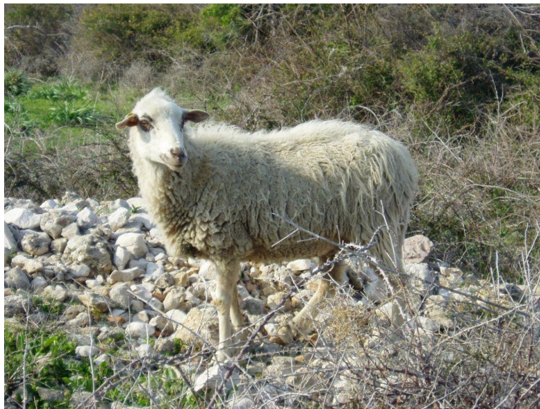
Slika 8. Paška ovca

Paška ovca nastala je oplemenjivanjem izvorne otočke pramenke sa talijanskom pasminom bergamo te pasminom merino negretti iz Španjolske. U prošlosti se uzgajala za vunu, a danas se koristi za proizvodnju mlijeka od kojeg se izrađuje polumasni tvrdi ovčji sir poznat pod nazivom " Paški sir". U 165 dana laktacije paška ovca proizvede od 120 do 150 litara mlijeka. Paški sir prepoznatljiv je proizvod, uz koji se veže i paška janjetina koja je isto tako cijenjen proizvod ove pasmine. Paška janjetina specifičnog je okusa i kakvoće (HSUOK, 2005.).