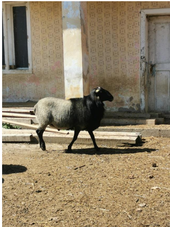
Slika 10. Ovan romanovske pasmine

Gospodarstvo svoju djelatnost temelji na proizvodnji te uzgoju janjadi no dobit još uvijek nije velika. Nadamo se povećanju poslovanja s čime će doći i zadovoljavajuća financijska dobit. U budućnosti uzgoja ovaca značajan čimbenik predstavlja nam potpora uzgajivača ovaca, a jako veliku ulogu ima i Ministarstvo poljoprivrede. Veliku ulogu u budućnosti uzgoja predstavljaju nam državne mjere poput novčanih potpora za upisana i matična grla te uvođenje povoljnih kredita.