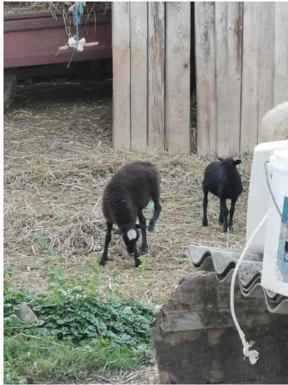
Slika 11. Janjad