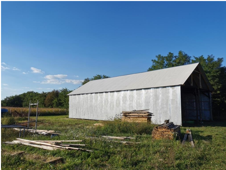
Slika 13. Izgradnja objekta

Ovce se drže nevezane, podjeljene u manje grupe, u otvorenim boksovima ili zatvorenim stajama, s obzirom na godišnja doba i klimatske i tehnološke uvjere. Zatvorene staje uobičajno imaju tzv. duboki pod; tu se nakupljaju gnojivo i stelja za vrijeme dok se ovce drže zatvoreno (Volčević, 2005.). Trenutno na našem gospodarstvu koristimo poluintenzivan sustav uzgoja s tendencijom ka intenzivnom uzgoju. Stado trenutno broji 40 grla romanovskih ovaca, te jednog ovna, od čega 17 janjadi te 13 šilježica. Gospodarstvo se nalazi u Osječko-baranjskoj županiji na lokaciji Nard. Ovce tokom vegetacije držimo na paši, dok tokom zime koristimo kvalitetna krmiva i sijeno koje sami proizvodimo na vlastitim poljoprivrednim površinama od ukupno 4 ha. U samim počecima krenuli smo s uzgojem svega nekoliko grla ove pasmine, uz napomenu da konstantno težimo proširenju stada, izgradnji pratećih objekata, poboljšanju mehanizacije, te ulaganju u obradive površine. Gospodarstvo temeljimo poglavito na proizvodnji janjadi, odnosno proizvodnji mesa.