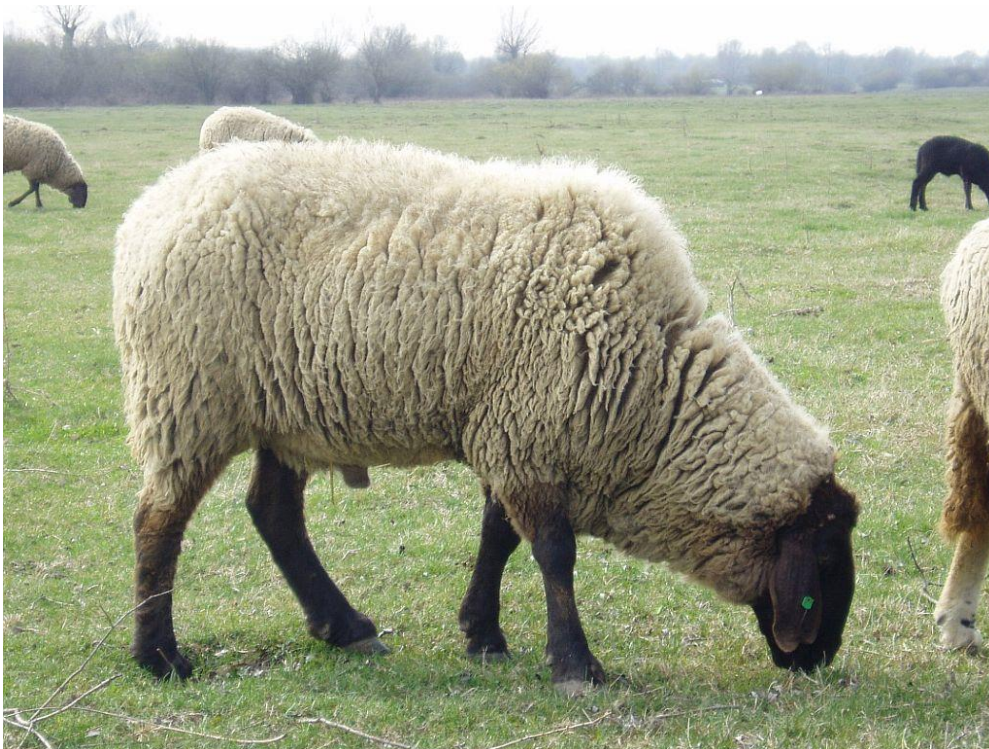
Slika 2. Cigaja

Plodnost ove pasmine kreće se od 140-180 %. Tjelesna masa janjadi kreće se od 3,5 do 5 kg, a nakon 3-4 mjeseca janjad postiže masu od 30-35 kg. Možemo zaključiti da dnevni prirast janjadi iznosi od 270-300 grama (HSUOK, 2005.).