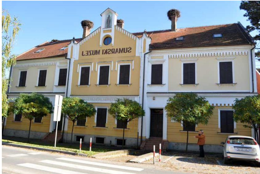
Slika 10. Šumarski muzej u Bošnjacima

povijest šumarstva ovog kraja, a poglavito Spačvanskog bazena poznatog po šumi hrasta lužnjaka odnosno na daleko znanog slavonskog hrasta.