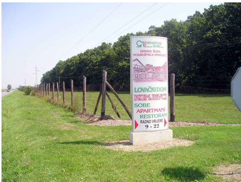
Slika 11. Prilaz Lovačkom domu Kunjevci

Lovište je poznato po atraktivnom zimskom lovu na divlje svinje prigonom uz upotrebu posebno dresiranih lovnih pasa. Lov na plemenitog jelena u rici u barama, poseban je lovački doživljaj ( www.hrsume.hr ).