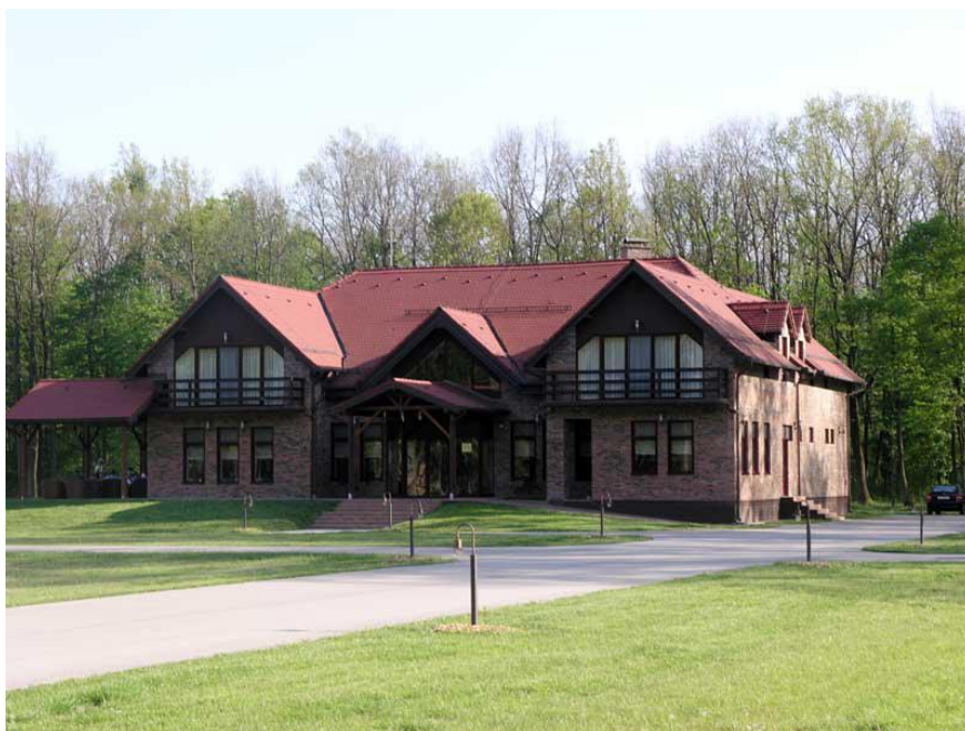
Slika 9. Lovački dom Kunjevci

Hrvatske šume su glavni predstavnik lovnog turizma u Vukovarsko-srijemskoj županiji. One imaju svoja lovačka društva koja su također predstavnici lovnog turizma, gastro ponude, te reklama našeg kraja i naših prirodnih ljepota. Hrvatske šume prodaju 80 % svoga ulova za predstavljanje lovno - turističke ponude. U radu su kao prilog prikazani i opći uvjeti organizacije lovno turističkog paket aranžmana ( www.hrsume.hr ).