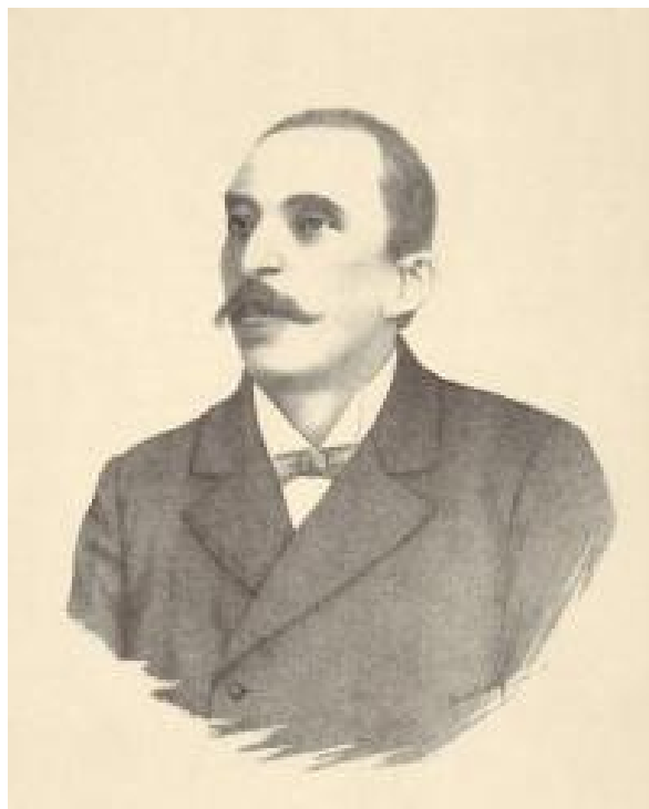
Slika 13. Josip Kozarac