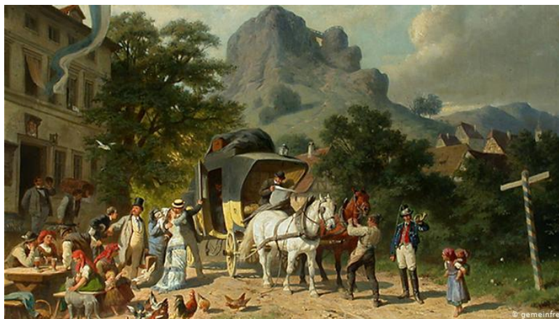
Slika 4. Počeci turizma, DW

Počeci turizma vežu se uz europsku aristokratsku mladež koja je organizirano putovala Europom s ciljem upoznavanja različitih kultura i umjetnosti, a širenje je bilo uvjetovano razvojem prometne infrastrukture, tada razvojem željeznice i parnog stroja.