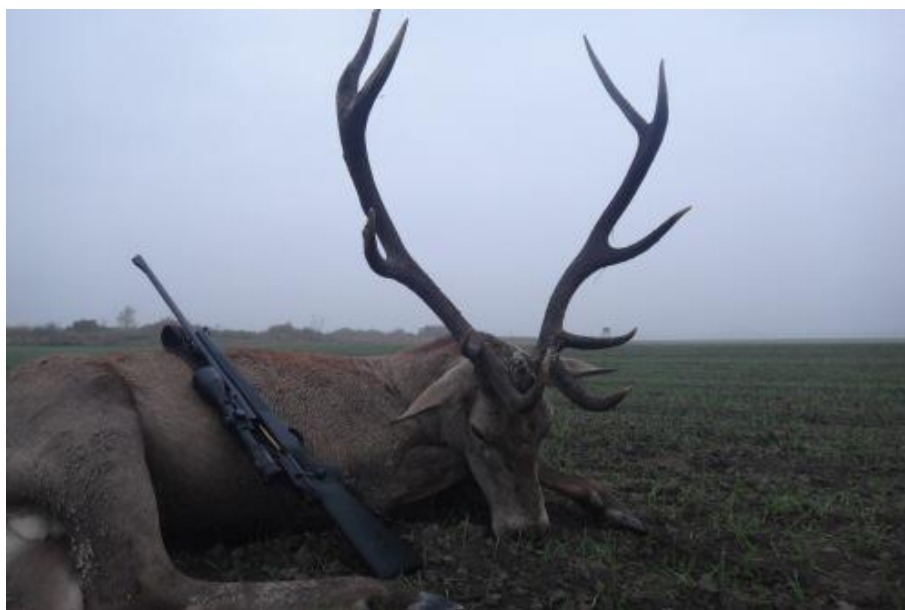
Slika 7 Odstreljen jelen

Lovni turizam, kao specifični oblik turizma, važan je segment u ukupnoj turističkoj ponudi Hrvatske, s osobitim naglaskom na ponudi kontinentalnoga dijela, a Hrvatska ima dugu lovnu tradiciju, lovce entuzijaste, a interes inozemnih lovaca za hrvatske lovne destinacije vrlo je velik. Nažalost još uvijek nismo uspjeli dovoljno promovirati i zaokružiti cijelu turistički proizvod kada pričamo o lovnom turizmu.