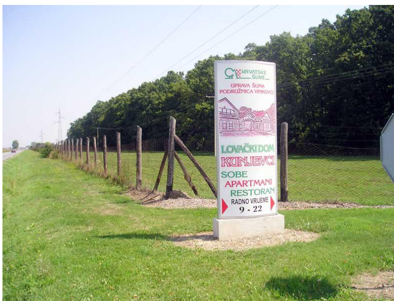
Slika 11. Prilaz Lovačkom domu Kunjevci

Lovište je poznato po atraktivnom zimskom lovu na divlje svinje prigonom uz upotrebu posebno dresiranih lovnih pasa. Lov na plemenitog jelena u rici u barama, poseban je lovački doživljaj ( www.hrsume.hr ).