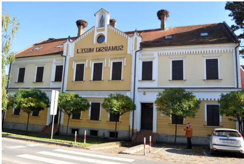
Slika 10. Šumarski muzej u Bošnjacima

povijest šumarstva ovog kraja, a poglavito Spačvanskog bazena poznatog po šumi hrasta lužnjaka odnosno na daleko znanog slavonskog hrasta.