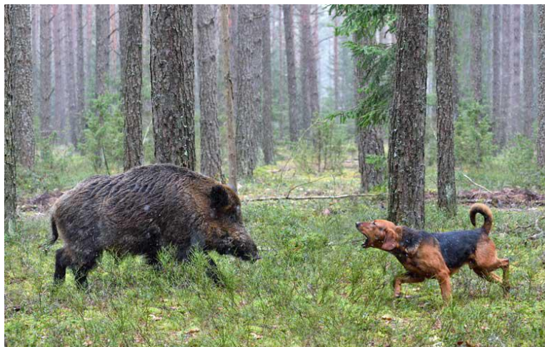
Slika 3. Lov sa psima

Zabranjen je lov krupne divljači skupnim lovom i korištenjem lovačkih pasa, osim divlje svinje. Vrste lovišta prema obilježjima prostora se odnose na otvoreno i ograđeno lovište, te uzgajalište divljači.