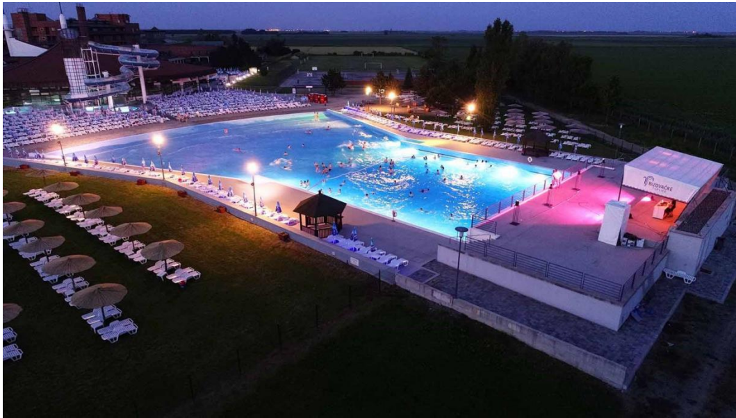
Slika 5. Bizovačke toplice

Prema podacima Državnog zavoda za statistiku, u 2019. godini na području Hrvatske bilo je 1.160.067 stalnih ležajeva te 198.368 pomoćnih.(zavod za statistiku, 2020.).