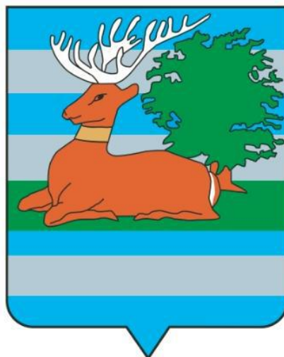
Slika 8. Grb Vukovarsko-srijemske županije

Kolika je povezanost Vukovarsko-srijemske županije s prirodom i prirodnim okruženjem vidi se već u prvom koraku pogledom na grb Vukovarsko-srijemske županije u kojem dominira jelen. Na taj način odana je počast ovoj predivnoj životinji, ali i poslana poruka svim dobronamjericima i turistima kako je riječ o županiji u kojoj dominira prirodno okruženje s očuvanom biološkom raznolikošću i staništem krupne divljači.