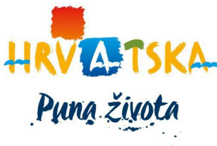
Slika 1. Slogan Hrvatske turističke zajednice

Turizam je jedna od komponenata nacionalne ekonomije svake države, a zbog svog geostrateškog položaja, prirodnih, kulturnih i povijesnih ljepota, turizam je jedna od najznačajnijih komponenata BDP-a Republike Hrvatske. Prema podacima Hrvatske narodne banke (Turizam, 2018.), prihodi od turizma čine 19,6% udjela u BDP-u za 2017. godinu.