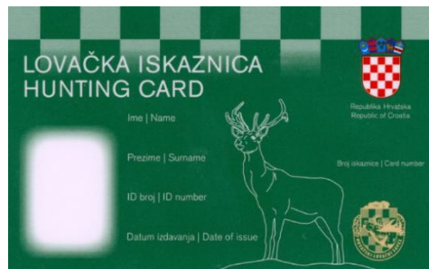
Slika 2. Lovačka iskaznica

Isto tako, temeljem Zakona u primjeni je Pravilnik o uvjetima i načinu lova, nošenju lovačkog oružja, obrascu i načinu izdavanja lovačke iskaznice, dopuštenju za lov i evidenciji o obavljenom lovu (NN 70/10) kojim se propisuju uvjeti i način lova, nošenje lovačkog oružja, obrazac i način izdavanja lovačke iskaznice, davanje dopuštenja za lov i vođenje evidencije o obavljenom lovu.