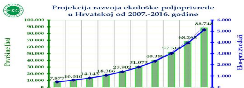
Slika 5. Projekcija razvoja ekološke poljoprivrede u Hrvatskoj od 2007. - 2016. godine Izvor: ruralnirazvoj.hr, 2020.

Zajedničkom poljoprivrednom politikom (ZPP) je utvrđen opći okvir za razvoj poljoprivrede u EU za razdoblje 2014. – 2020. Cilj je novih odredaba uspostaviti održivu konkurentnost kako bi se postigao gospodarski održiv sektor proizvodnje hrane te održivo gospodarenje prirodnim resursima EU u kojemu je ekološka proizvodnja prepoznata kao ključan element. U ovom se programskom razdoblju pridaje još veći značaj okolišu i utjecaju poljoprivrede na okoliš. Ekološka poljoprivreda je izdvojena iz mjere agro-okoliš kao zasebna mjera čime se dodatno naglasio njezin povoljni utjecaj na okoliš. U sklopu Programa ruralnog razvoja potpora se daje ekološkim proizvođačima koji tek ulaze u sustav ekološke proizvodnje kao i onima koji nastavljaju ovaj vid proizvodnje (ruralnirazvoj.hr, 2020).