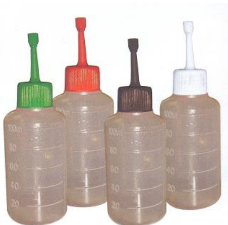
Slika 6. Bočice za umjetno osjemenjivanje svinja

Provođenje umjetnog osjemenjivanja zahtjeva korištenje bočice s razrijeđenim sjemenom i katetera za jednokratnu ili višekratnu upotrebu. Kateter je cjevčica dužine 45cm do 55cm koja je napravljena od tvrde gume, a na jednom kraju završava poput svrdla.