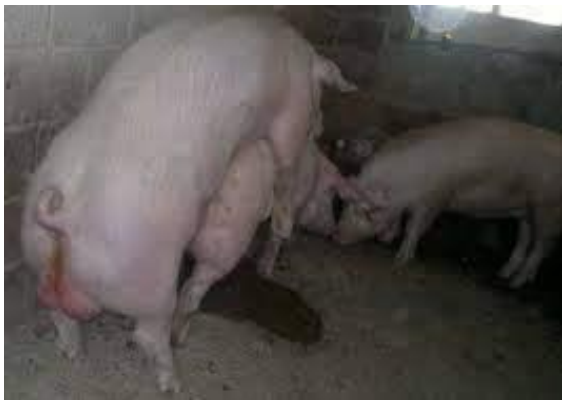
Slika 3. Grupni pripust

Umjetno osjemenjivanje svinja jest jedna od tehnika pripusta krmača uz grupni pripust odnosno „divlji skok“ te pojedinačni pripust. Divlji skok predstavlja držanje nerasta ili više njih u grupi s više krmača. Nedostaci ovog načina osjemenjivanja je to što se ne zna točno vrijeme osjemenjivanja koja krmača (Stančić, 2014.).