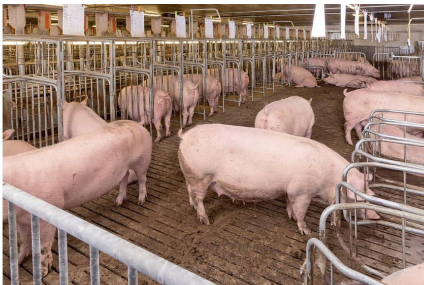
Slika 2. Boksovi za vrijeme nadzora u prasilištu