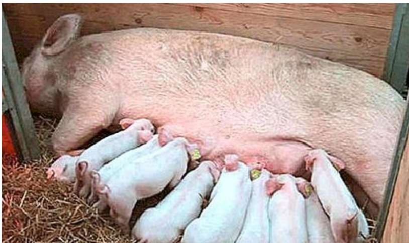
Slika 1. Krmača i prasad

Povećanje i poboljšanje legla kroz selekciju se uvijek smatralo teškom zadaćom. Jedan od razloga je upravo taj što reproduktivna sredstva nisu bila izražena upravo u tim komercijalnim programima ugoja. Nizak heritabilitet ograničena veličina početne populacije, fenotipska ekspresija samo u ženskih životinja te kasno obavljena mjerenja bili su glavni razlozi sporog napretka. Upravo zbog tih razloga selekcija na veličinu legla smatrala se neučinkovitom. Iako, podaci koji su prikupljeni o izravnoj aditivnoj genetskoj varijanci i sama dostupnost podataka koji se tiču srodnika pruža i proširuje mogućnost za još uspješnije povećanje legla putem kvantitativne i molekularne genetike. (Luković i Škorput, 2015.).