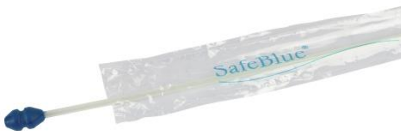
Slika 5. Kateter za umjetno osjemenjivanje svinja

Kao što možetmo vidjeti, postoji nekoliko prednosti, zbog kojih većina poljoprivrednika više koristi umjetnu metodu oplodnje životinja. Za provedbu umjetnog osjemenjivanja potrebna je posebna oprema bez koje postupak nije moguće provesti. Osim toga, potrebno je odrediti najbolje vrijeme za provođenje postupka; najoptimalnije je 12 – 24 sata od početka stajanja. Pogreška u određivanju vremena osjemenjivanja dovesti će do produženja vremena tijekom kojeg krmače mogu ostati bređe (Stančić, 2014.).