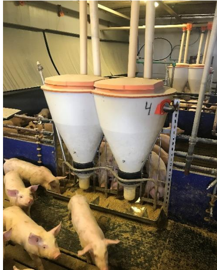
Slika 2. Hranidba u uzgajalištu