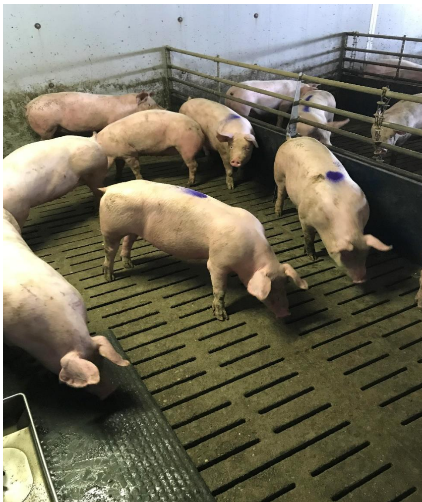
Slika 1. Selekcija nazimica

Proizvodnja na nukleus farmi je kružna što znači da se svakim određenim danom u tjednu poslovi ponavljaju. Takav način posla je bitan jer prati tjedni ulaz i izlaz životinja s farme s naglaskom na zoohigijenu i zdravstvenu zaštitu.