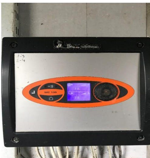
Slika 4. Klima računalo