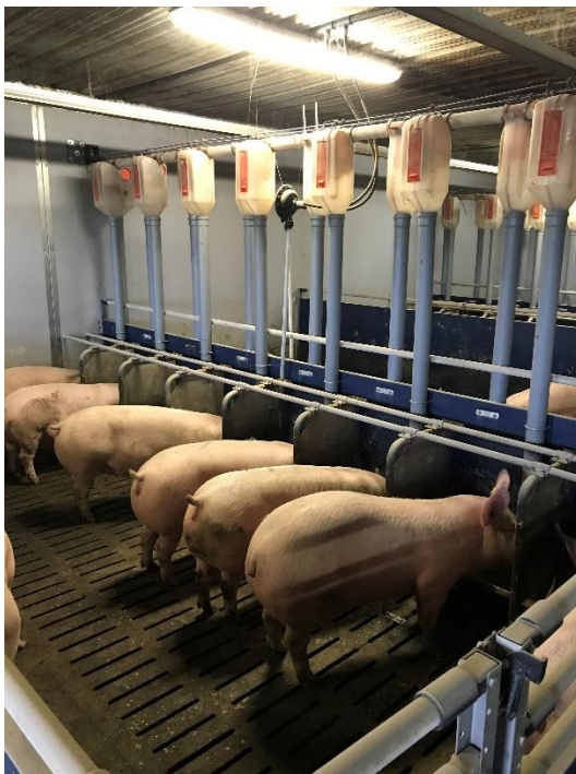
Slika 3. Restriktivna hranidba nazimica

dozatori su im namješteni na 1700 grama, te se nakon deset dana oni povećavaju na 2500 grama te ta težina ostaje do izlaza. Prosječna izlazna kilaža nazimica je 113-115 kg uz starost od 180 dana, životni prirast 630 grama uz konverziju od 2,7 kg. (Kralik i sur., 2007. ; Domaćinović i sur., 2015.)