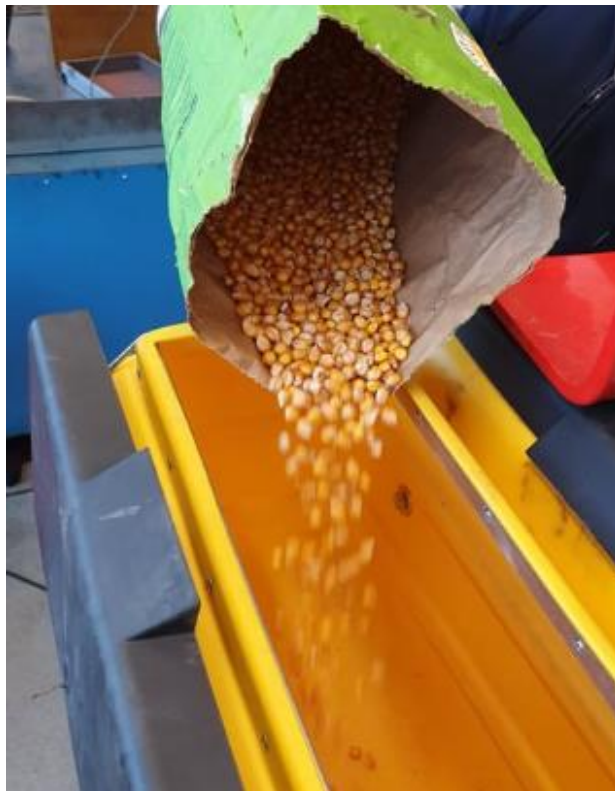
Slika 8. Sjeme osječkog hibrida Os 4014

Dobar je za sve namjene proizvodnje (zrno, klip, silaža). Stabljika mu je srednje visine, robusna s bujnim listovima i visoke tolerantnosti na polijeganje. Ima dubok i razgranat korijen jake upojne moći te visoku energija klijanja i klijavost (izražen vigor zrna). Klip mu je krupniji, cilindričan i srednje visoko nasaden. Sadrži 16-18 redi zrna u tipu pravog zubana. Izraženo mu je svojstvo gubitka vode u zriobi što rezultira manjom vlagom pri berbi.