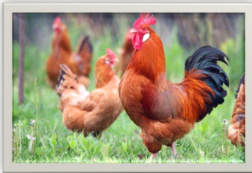
Slika 3. Kokoš hrvatica

vitamin E, beta-karoten i vitamin C, ne sadrže rezidue antibiotika ili drugih lijekova, a meso i jaja imaju prirodan miris s naglašenom aromom livadske flore. Hrvatica se uzgaja slobodnim susatvom držanja koji podrazumijeva da životinje veći dio života provode na otvorenom, slobodno se kreću livadama, voćnjacima i drugim vegetacijom bogatim staništima. Samo u nepovoljnim vremenskim uvjetima i noću, životinjama se osigurava čvrsto sklonište, odnosno peradarnik. Masa odraslih kokica iznosi 1,6-1,8 kg, a pijetlova 2,2-2,6 kg. Godišnje snesu, u povoljnim uvjetima držanja, oko 200-220 komada jaja svijetlosmeđe boje ljuske (Janječić, 2011.).