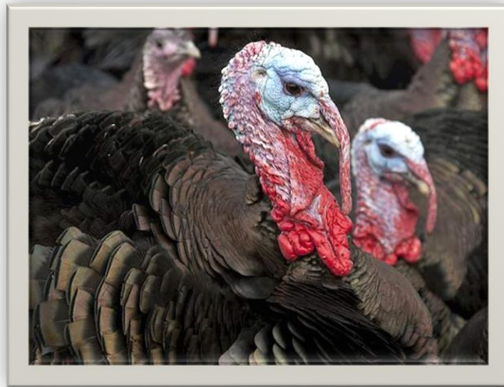
Slika 2. Zagorski puran

Posljednjih godina potražnja za mesom zagorskih pura nadmašila je njihovu ponudu. S obzirom na vrlo kratko vremensko razdoblje koje je potrebno da se sadašnja populacija rasplodnih zagorskih purana umnoži, može se računati da bi se za nekoliko godina moglo doći do broja uzgojenih životinja koji bi zadovoljavao potrebe hrvatskoga tržišta, a kasnije i potrebama izvoza (Janječić i sur., 2014.).