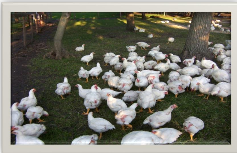
Slika 6. Pilići na ispustu

Perad nije dopušteno držati u kavezima. Određene vrste peradi moraju imati omogućen pristup vodenim površinama (potok, jezero i sl.) gdje god to vremenski i higijenski uvjeti omogućuju. (Pravilnik o ekološkoj proizvodnji životinjskih proizvoda – NN 13/02 ).