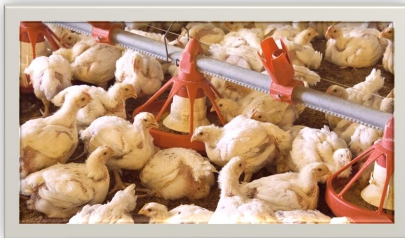
Slika 5. Hranidba peradi

U ekološkoj proizvodnji nije dopuštena upotreba mesnog brašna, koštanog brašna i genetski modificirane hrane te tvari kojima se potiče rast i proizvodnja (antibiotici, kokcidiostatici, stimulatori rasta). Hrana i svježa voda trebaju biti dostupni životinjama cijeli dan. Što se tiče vode za napajanje, treba naglasiti da ona mora kvalitetom i količinom zadovoljavati potrebe životinja. Naime, uzgoj na ekološki prihvatljiv način podrazumijeva konzumiranje (potrošnju) zdravstveno ispravne vode, a organoleptički, fizikalno, kemijski i bakteriološki parametri ocjenjuju se po istim kriterijima kao i oni u vodi za piće ljudi (Pravilnik o zdravstvenoj ispravnosti vode za piće – NN 46/94). Naime, pogoršana kvaliteta vode može negativno utjecati na zdravlje životinja kao i na njihove proizvodne sposobnosti, prirast, nesivost i kvalitetu jaja. Osigurati dovoljne količine vode zavisi o potrebi životinja za vodom. Dnevne količine za perad zavisno da li se radi o nesilicama ili brojlerima te o dobi iznose.