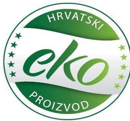
Slika 1. Oznaka Eko proizvoda u Hrvatskoj

Svaki ekološki proizvod koji je proizveden prema zakonskoj regulativi, dobiva eko znak što mu na tržištu daje oznaku eko proizvoda te tako kupcu garantira da je taj proizvod proizveden u strogo kontroliranim uvjetima. Da bi se nekom proizvodu dodijelio navedeni znak mora proći postupak za stjecanje, koji provodi radno tijelo koje je imenovano od strane ministra poljoprivrede, a znak se dodjeljuje na period od dvanaest mjeseci, tj. za jednu godinu proizvodnje.