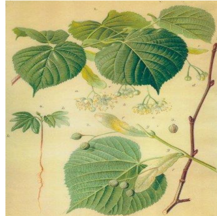
Slika 4. Tillia platyphyllos Scop., velelisna lipa

www.sumfak.unizg.hr/dendoflora/nastava/06.htm