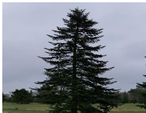
Slika 6 Abies nordmanniana Spach, kavkaska jela