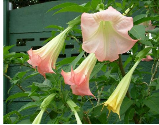
Slika 2. Brugmansia suaveolens (Humb. & Bonpl. ex Willd.) Bercht. & J.Presl, anđeoska truba, nježno roza boje

www.sumfak.unizg.hr/dendoflora/nastava/06.htm