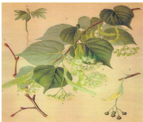
Slika 5 Tilia cordata Mill., sitnolisna lipa