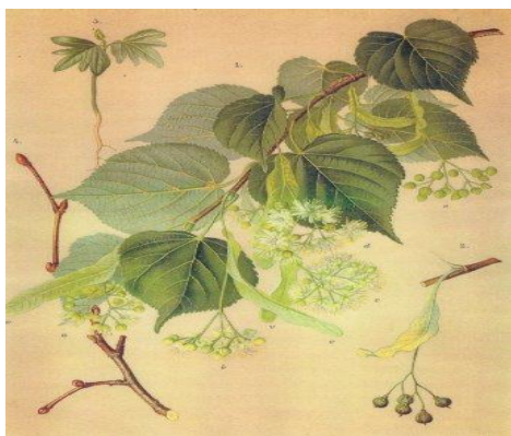
Slika 5 Tilia cordata Mill., sitnolisna lipa