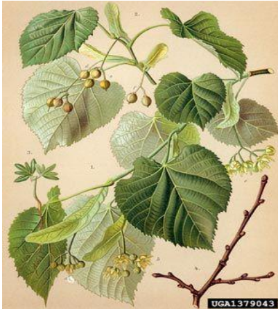
Slika 3. Tillia tomentosa Moench, srebrna lipa

Latinsko ime Tillia tomentosa odnosilo bi se na dlakavu lipu. No, u prijevodu toj lipi nadjenut je naziv „srebrna lipa“, što je prijevod engleskoga naziva Silver linden (slika 3). Lipa latinskoga naziva Tillia platyphyllos , što bi u prijevodu glasilo „ravnolisna lipa“, nosi naziv „velelisna lipa“, po uzoru na engleski pučki naziv Large-leaved linden (slika 4).