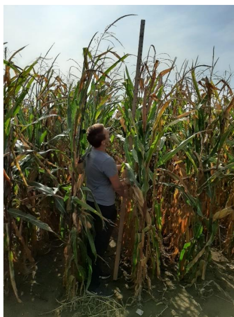
Slika 4. Mjerenje visine biljaka pomoću metra

Visina biljke do zadnjeg nodija na stabljici u centimetrima mjerena je 03.09.2019. pomoću drvenog metra dužine 3 m na slučajnom uzorku od 30 biljaka na svakom ponavljanju. Također, istog dana je obavljeno mjerenje visine klipa na slučajnom uzorku od 30 biljaka na način da se mjerila visina od razine tla do prvog nodija ispod klipa. Ukupno je tijekom provedenog istraživanja obavljeno 960 mjerenja visine klipa i visine biljke (Slika 4.).