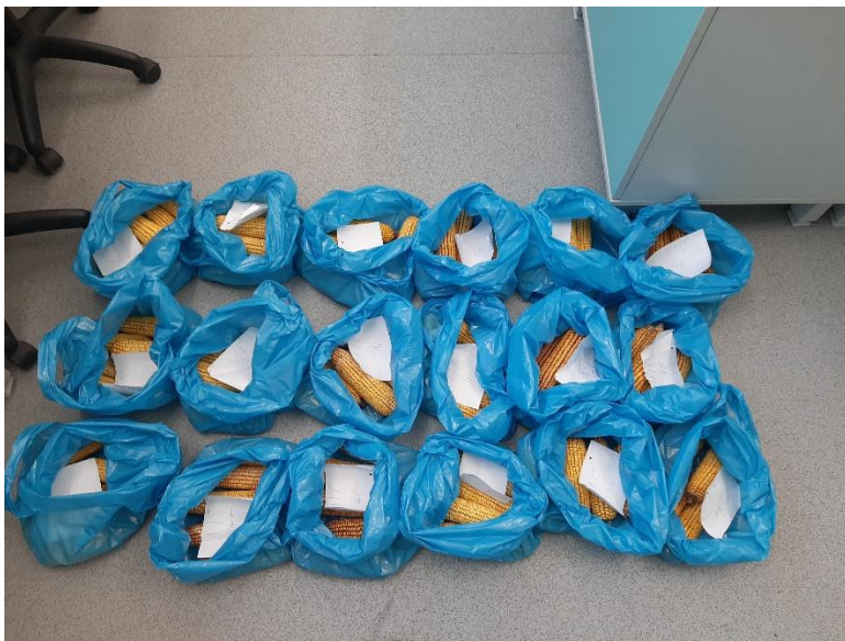
Slika 6. Uzorci hibrida kukuruza u laboratoriju

Masa svakog klipa određena je vaganjem na digitalnoj vagi, a zatim se pomoću ravnala mjerila dužina u centimetrima. Promjer svakog klipa određen je pomoću digitalnog pomičnog mjerila na sredini klipa (Slika 7.). Nakon obavljenih mjerenja uzorak klipa se ručno runio u plastičnu kantu i ponovo vagao na digitalnoj vagi kako bi se utvrdila masa čistog zrna bez oklaska klipa.