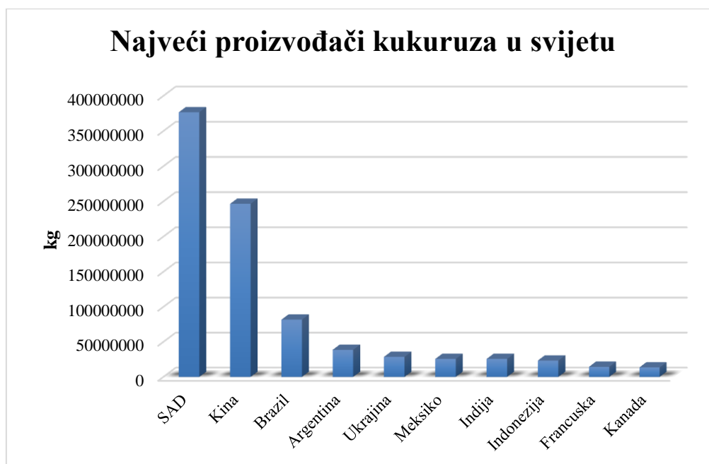
Grafikon 1. Top 10 najvećih proizvođača kukuruza u svijetu u petogodišnjem razdoblju (2013.-2018.)

Prema podacima FAOSTAT deset najvećih proizvođača kukuruza u svijetu su Sjedinjene Američke Države (SAD), Kina, Brazil, Argentina, Meksiko, Indija, Ukrajina, Indonezija, Francuska i Kanada ( www.fao.org/faostat/en/ ). Daleko najveće vrijednosti postižu SAD i Kina dok su sve ostale zemlje zastupljene s puno manjim udjelom. Od top 10 proizvođača kukuruza u svijetu treba spomenuti kako su dvije s područja Europe pri čemu ujedno i predstavljaju najveće proizvođače kukuruza u Europi (Grafikon 1.).