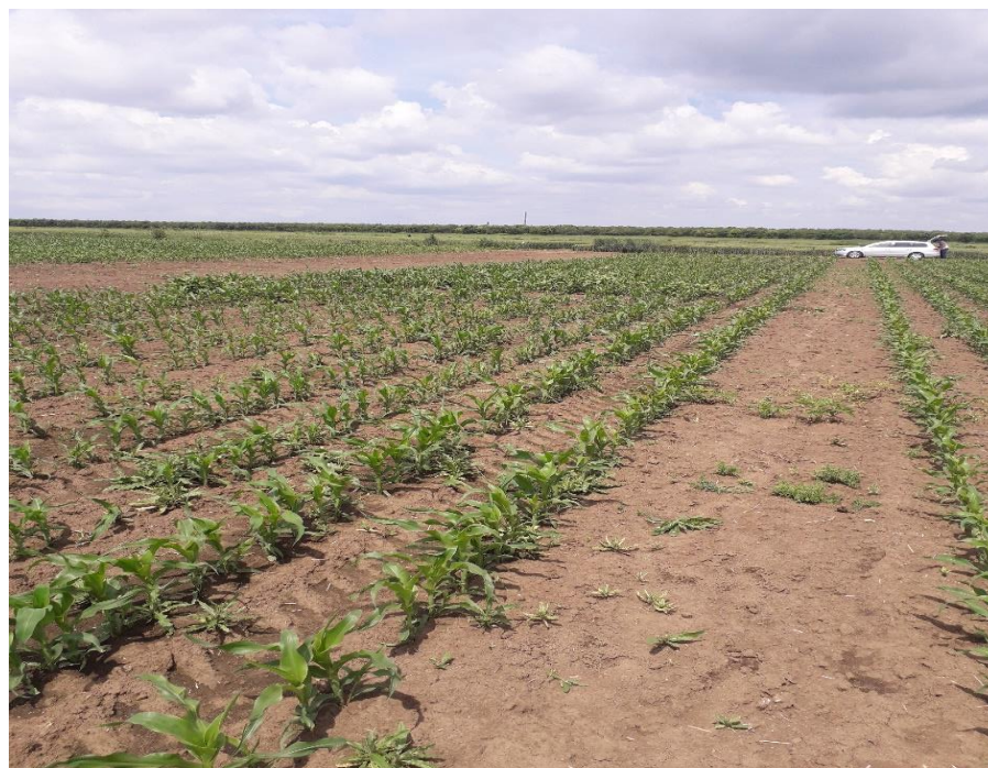
Slika 2. Izgled kukuruza u fazi 5 do 6 listova – prije međuredne kultivacije

dodano je 300 kg/ha NPK u formulaciji 0:20:30, a predsjetvenom gnojdbom dodano je 200 kg/ha UREE. Zaštita od korova obavljena je 8. svibnja 2019. godine kada je kukuruz bio u fazi BBCH 13 s herbicidom Adengo u količini od 0,44 l/ha, a kultivacija s prihranom obavljena je 4. lipnja 2019. godine uz primjenu 250 kg/ha amonijevog sulfonitrata (Slika 2.).