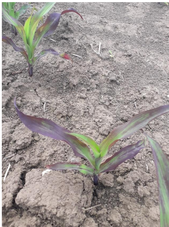
Slika 9. Pojava ljubičastog obojenja kukuruza izazvanog vjerojatno niskim temperaturama

Tijekom vegetacije kukuruza 2019. uočene su promjene povećanja temperature za 11% u odnosu na VGP (Tablica 3.). Tijekom svih promatranih mjeseci prosječne temperature zraka su bile iznad VGP osim svibnja kada je zabilježena vrijednost bila oko 12% niža što ne ide u prilog kukuruza kao termofilnoj biljci. Tako su temperature zraka bile više u travnju za 2 °C, u lipnju za čak 4,1 °C, srpnju za 2,2 °C, kolovozu za 3,7 °C i rujnu za 1,4 °C. Zbog nižih temperatura koje su zabilježene u svibnju na mladim biljkama kukuruza je uočeno plavo ljubičasto obojenje od antocijana što je pokazatelj stresa izazvanog niskim temperaturama (Slika 9.).