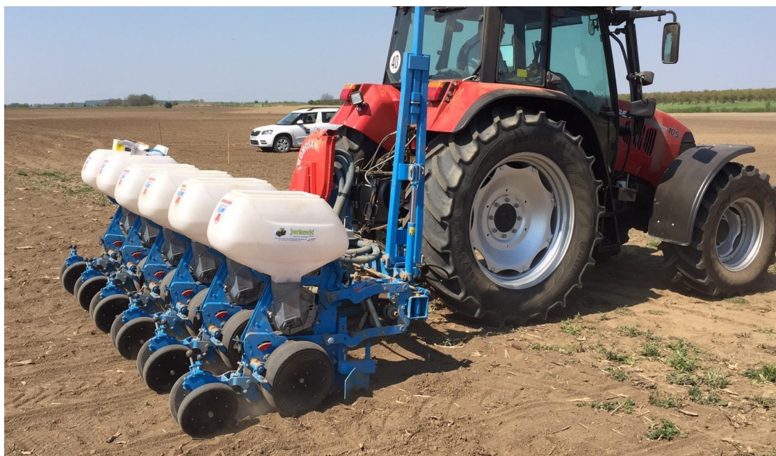
Slika 1. Sjetva kukuruza

Istraživanje je provedeno tijekom vegetacije kukuruza 2019. godine na površinama pokušališta Fakulteta agrobiotehničkih znanosti Osijek (45.51'79" sjeverne geografske širine, 18.77'83" južne geografske širine). Sjetva je obavljena 18. travnja 2019. godine pneumatskom šestorednom sijačicom na međuredni razmak od 70 cm (Slika 1.). Uzgajano je ukupno šest hibrida kukuruza različite FAO skupine Bc instituta iz Zagreba (FAO 330 - BC 323, FAO 390 - Agram, FAO 410 - Tesla, FAO 450 - BC 415, FAO 490 - Instruktor i FAO 570 – Majstor). Prema preporuci proizvođača sjemena sklop je iznosio 78 000 biljaka po hektaru za hibride FAO grupe 300, 74 000 biljaka po hektaru za FAO grupe 400 i 70 000 biljaka po hektaru za FAO grupe 500. Poljski pokus je postavljen u 3 ponavljanja pri čemu je površina osnovne parcele iznosila 10 m 2 , odnosno sastojala se od dva reda kukuruza dužine 14,3 m.