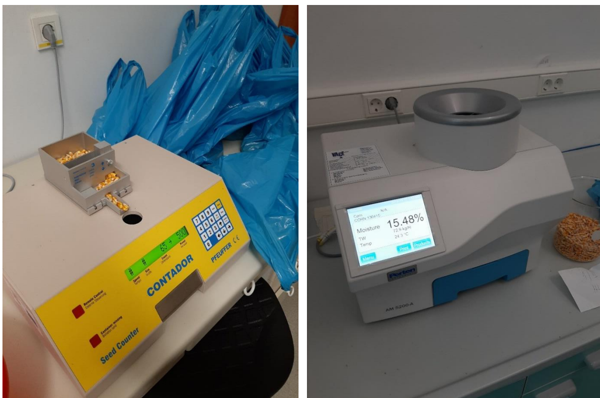
Slika 8. Uređaji za brojanje zrna i određivanje hektolitarske mase

Iz mase zrna pet klipova je pomoću brojača zrna (Slika 8.) izbrojano dva puta po 500 neoštećenih zrna po principu slučajnog odabira nakon čega je obavljeno vaganje uz pomoć digitalne vage KERN 440 35 A. Hektolitarska masa određena je pomoću uređaja Aqua Matic 5200-A (Perten) u koji se usipa suho zrno iz uzorka te se nakon nekoliko trenutaka dobije prikaz parametra (Slika 8.).