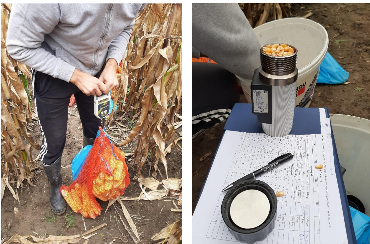
Slika 5. Vaganje klipa kukuruza i utvrđivanje vlage zrna

Ručna berba kukuruza svih 6 hibrida u tri ponavljanja obavljena je 10. rujna 2019. godine sa cijele osnovne parcele. Neposredno prije berbe obavljeno je brojanje biljaka, a nakon berbe brojanje klipova na svakoj osnovnoj parceli nakon čega su uzorci stavljeni u mrežaste vreće i izvagani uz pomoć ručne digitalne vage (Kern). Nakon provedene odvage slučajnim odabirom uzeto je po 5 klipova sa svakog ponavljanja za potrebe daljnjeg istraživanja koje se provodilo u Laboratoriju za analizu ratarskih usjeva na Fakulteta agrobiotehničkih znanosti Osijek. Također, za potrebe određivanja vlage zrna u trenutku berbe orunjeno je 5 klipova sa svakog ponavljanja i izmjereno uz pomoć digitalnog vlagomjera Wile 55 (Slika 5.).