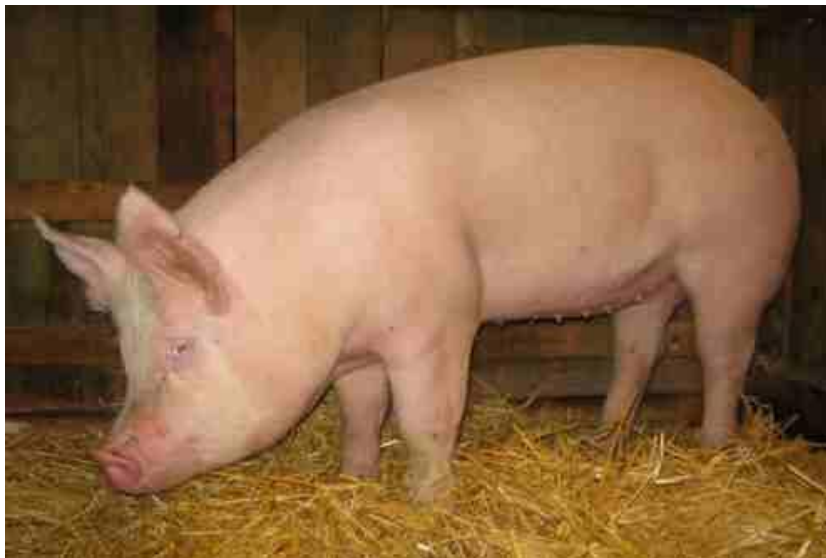
Slika 1: Svinja jorkšir pasmine

Veliki jorkšir - najraširenija pasmina svinja u svijetu. Nastala u Engleskoj. Velikog okvira, dug i dubok trup, obrasla je finom čekinjom bijele boje, uši su uzdignute prema gore. Plodnost krmača je vrlo dobra i kreće se 11 - 13 prasadi u leglu. Krmače su izrazito dobre majke i mliječnost im je velika. Tovljenici ostvaruju relativno visok prosječni dnevni prirast u tovu od 800 - 850 g uz utrošak hrane ispod 3 kg za kilogram prirasta. Postotak mišićnog tkiva u polovicama kreće se od 55 - 60%. U tovu sa 6 - 7 mjeseci starosti tovljenici postižu težinu od 100 do 110 kg. Općenito se može reći da je to univerzalna pasmina snažne konstitucije pogodna za namjene u uzgojnom i proizvodnom pogledu. U križanjima sa drugim pasminama korist se kao majčinska pasmina.