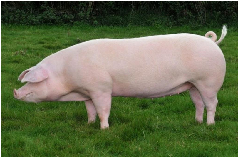
Slika 2: Danski landras

Danski landras je srednja do velika pasmina svinja koja je nastala križanjem domaće danske svinje i velikog jorkšira. Ove svinje imaju srednje dugu i široku glavu sa teškim i položenim ušima. Trup je dug, u prednjem dijelu uži nego u zadnjem. Leđna linija je ravna, srednje širine. Plećke su slabije razvijene a butovi snažni i mesnati. Izuzetno dobra pasmina za proizvodnju tovljenika jer ostvaruje vrlo visoke proizvodne rezultate u tovu.