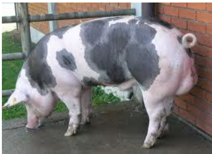
Slika 4: Nerast pietren pasmine

Pasmina svinja nastala u Belgiji, do pojave hibridnih svinja ovo je bila najmesnatija pasmina svinja na svijetu. Udio mesa u polovicama iznosi 60-65%. Ima odlično razvijene butove i plećke, te dobro izražene leđne mišiće. Bijele je boje, ali najčešće ima crne fleke po tijelu. Krmače prase 9 prasadi u leglu. Pietren pasmina je stresno osjetljiva pasmina i ima lošiju kvalitetu mesa kao posljedicu intenzivne selekcije na visoku mesnatost.