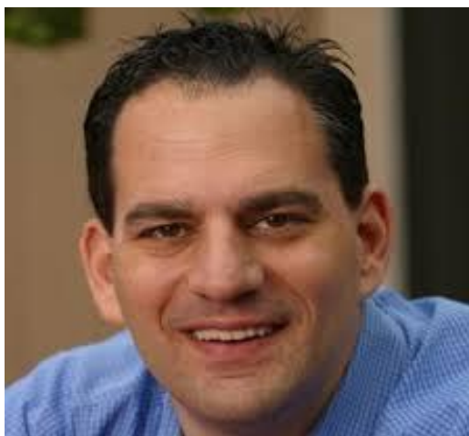
Slika 3. Barry Minkow