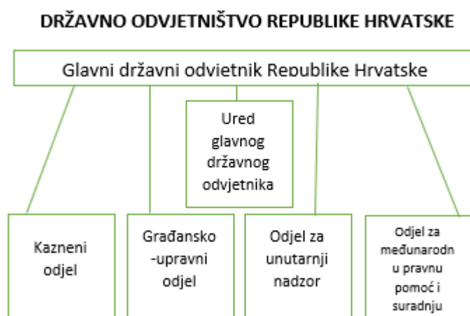
Slika 4. Ustroj DORH-a

Državno odvjetništvo Republike Hrvatske poduzima pravne radnje iz svoje nadležnosti pred međunarodnim i stranim sudovima i drugim tijelima. (Državno odvjetništvo RH, Ustroj)