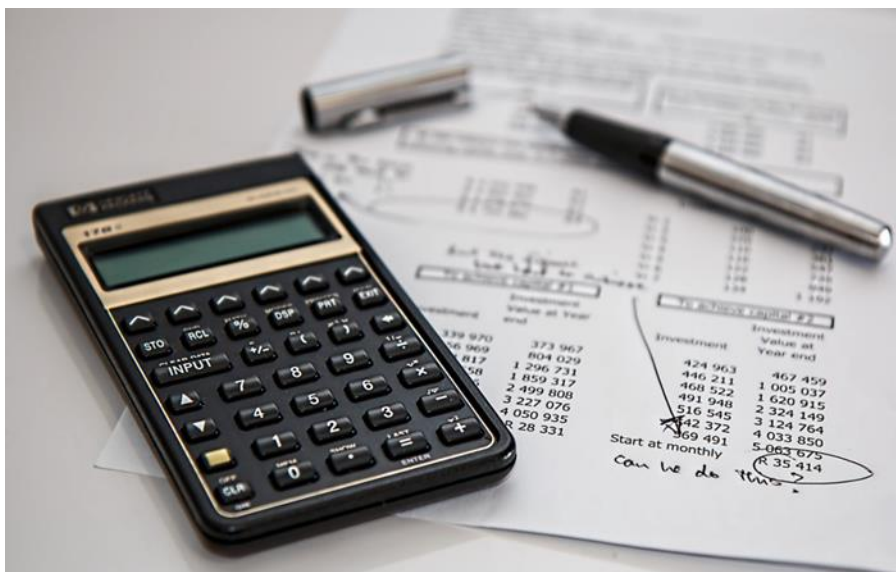
Slika 1. Računovodstvena evidencija