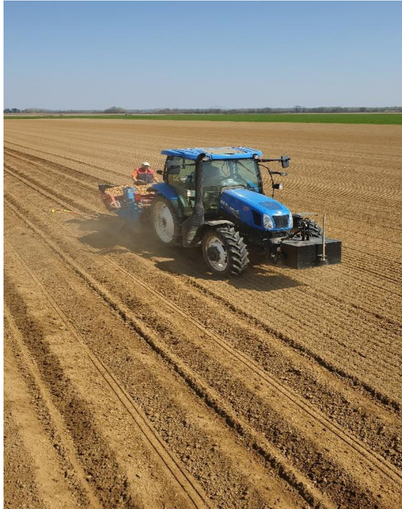
Slika 13. Sadnja krumpira