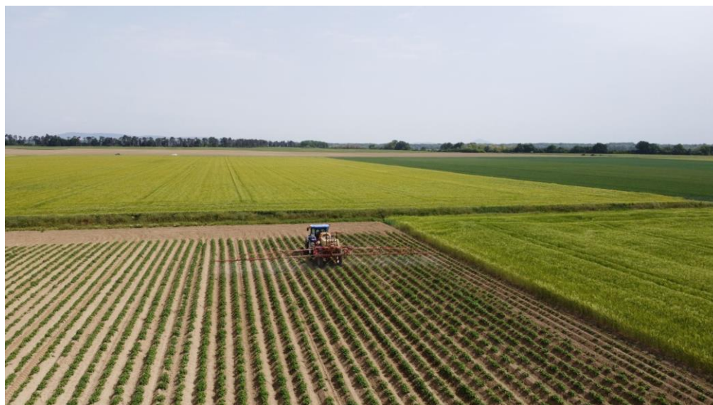
Slika 7. Folijarna gnojidba

Folijarna gnojidba (Slika 7.) je primjena u vodi topivih gnojiva direktno preko lista biljke. Folijarna gnojiva se brzo asimiliraju u biljci, a namijenjena su prije svega kao pomoć pri prihrani mikroelementima. Folijarna gnojidba se primjenjuje kao nadopuna gnojidbi preko tla i alternativna gnojidba u uvjetima kada biljka pokazuje najveće potrebe za hranjivima ili u uvjetima nedostatka hranjiva u tlu (Kovačević, 2012.; Lester i sur.,2006).