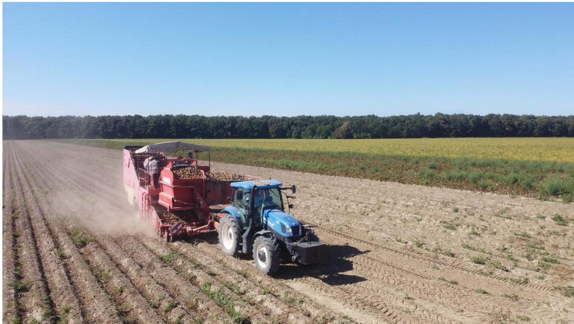
Slika 15. Berba krumpira

Berba krumpira (Slika 15.) na poljoprivrednom obrtu „Beta“ obavlja se dvorednim kombajnom Grimme 150-60.