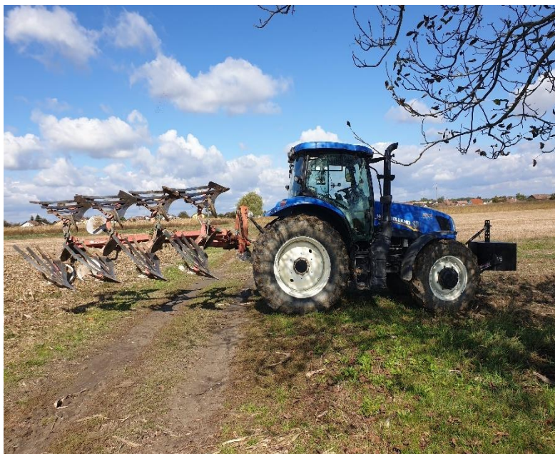
Slika 11. Zimska brazda

Na poljoprivrednom obrtu „Beta“ najčešća predkultura krumpiru je ječam. Obrada tla počinje ljetno-jesenskim zaoravanjem ostataka predkulture na dubinu 10-15 cm. Vrlo često s osnovnom obradom u tlo se unosi i odgovarajuća količina stajskog gnoja. Obrada mora biti kvalitetno obavljena jer omogućava dobar prohod stroja u sadnji i brzo klijanje i razvoj korijena, što je uvjet za jednakomjerno nicanje gomolja. Dok je zemlja suha u ljetnim razdobljima prolazi se podrivačem na dubinu 45-50 cm. Zimska brazda (Slika 11.) ore se na dubinu 35 cm.