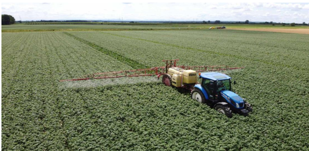
Slika 8. Zaštita od korova

Prskanjem korova veličine 6-7 mm, gdje su upotrebljavane dizne DI 12003 i voda od 260 l/ha dokazalo se da je efikasnost bila visoka, kako u teoriji tako i u praksi. Dobar uspjeh postiže se i u krumpiru s upotrebom vode od 250 – 300 l/ha s maksimalnom brzinom rada od 6 km/h (Đukić i Sedlar, 2002.).