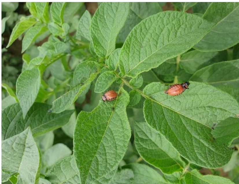
Slika 9. Krumpirova zlatica

Tretiranjem po listu i tretiranjem gomolja protiv ličinke krumpirove zlatice dobivaju se identični rezultati (Igrc i sur., 1999.).