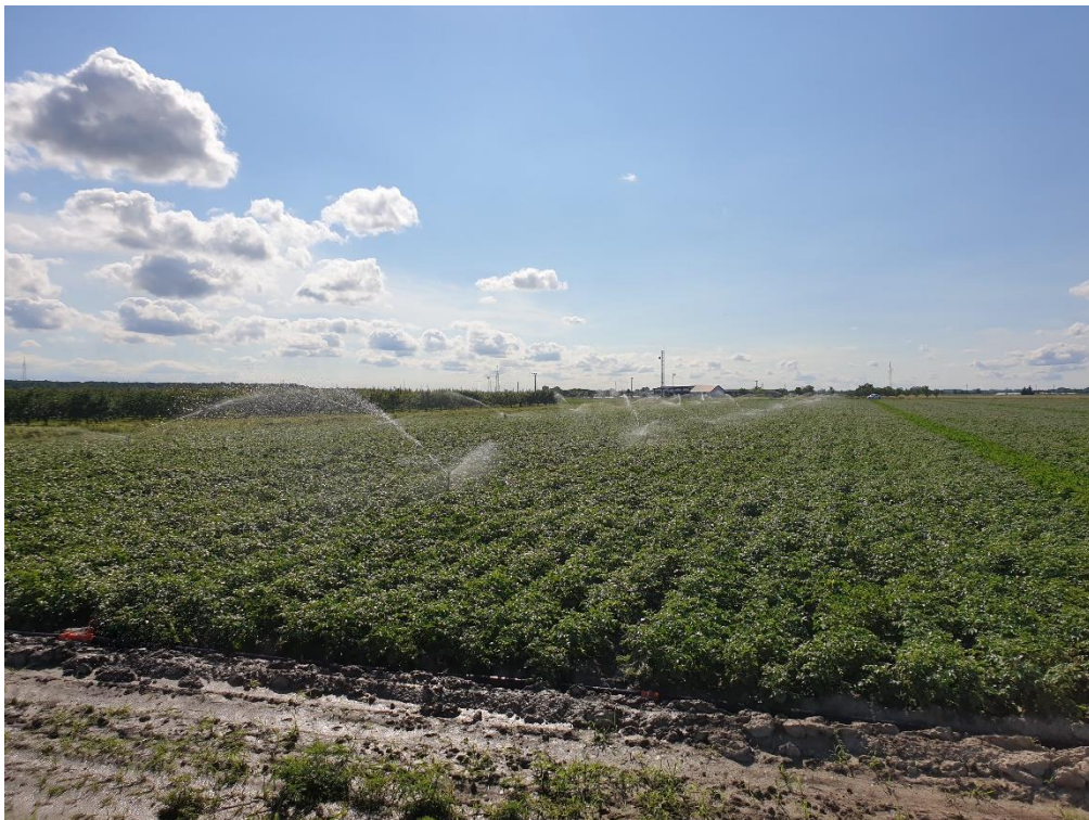
Slika 16. Navodnjavanje

Biljka nije u mogućnosti koristiti hranjiva iz tla bez dovoljne količine vode. Danas je gotovo nezamislivo baviti se intenzivnom proizvodnjom krumpira bez navodnjavanja i uporabe vodo-topivih gnojiva pomoću kojih se može osigurati dovoljna količina hranjivih tvari za biljke, koje bi trebale dati onakav prinos i kvalitetu plodova kakvu smo sami željeli. Poljoprivredni obrt „Beta“ raspolaže s dva rolomata s topom, te mikrorasprkivačima. Navodnjava se 15 od ukupno 25 ha površine pod krumpirom. Sljedeće godine planira se navodnjavati svih 25 ha krumpira.