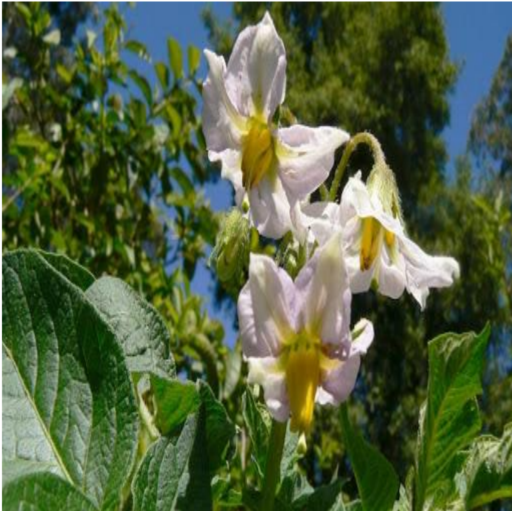
Slika 4. Cvat

Cvat (Slika 4.) je grozdastog oblika, smještena na vrhu stabljike. Sastoji se od 5 lapova, 5 latica, 5 prašnika, 1 tučka. Latice su međusobno srasle. Boja latica sortno je svojstvo – mogu biti bijele, ljubičaste, crvene itd.