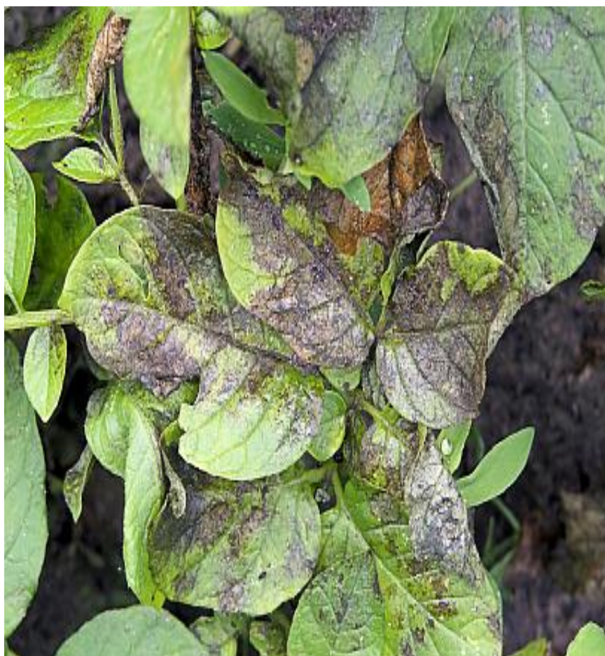
Slika 10. Plamenjača

Pojava koncentrične pjegavosti a ovisi i o vremenu sadnje te otpornosti sorte krumpira (Šubić, 2013.).