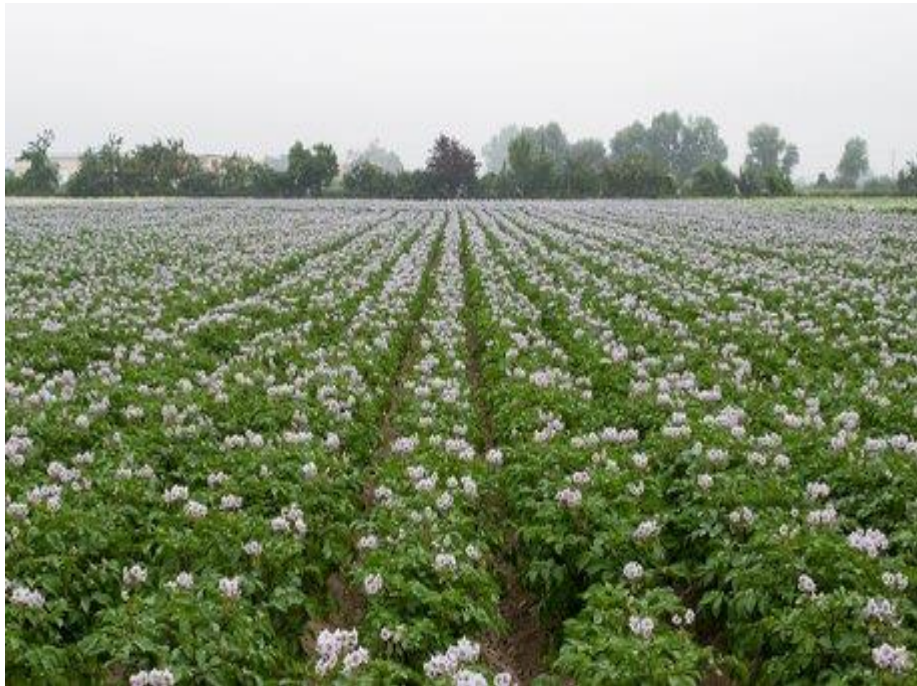
Slika 1. Krumpir

Botanički gledano, krumpir se smatra trajnicom, jer se klonovi biljke majke mogu razviti preko gomolja kćeri koji su ostali neubrani (Slika 1.). Ovisno o sorti i okolišu, gomolji kćeri se mogu razvijati i dok je biljka majka živa, međutim gomolji kćeri obično prolaze fazu mirovanja prije započinjanja novog rasta. Faza mirovanja je obično duža od prirodnog tijeka života majke biljke. Krumpir je godišnji usjev, jer pri sadnji krumpira za komercijalnu upotrebu, biljka majka stari prirodnim putem ili odlazi branjem gomolja kćeri (Wohleb i sur., 2014).