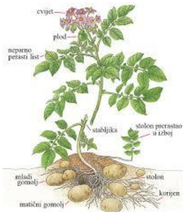
Slika 2. Nadzemni i podzemni organi

Biljka krumpira, nadzemni i podzemni dio, se sastoji od cime, stolona, korijena i gomolja (Slika 2.). Cimu kao nadzemni dio čine stabljika i listovi, a kao podzemni dio čine stabljika na kojoj se razvijaju stoloni i gomolji te korijen. Na kraju stolona, kao njegovo proširenje nastaje gomolj, a stolon može u specifičnim uvjetima, kao što je slučaj temperaturni šok, izrasti u izboj (Buturac i Bolf, 2000.)