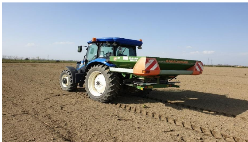
Slika 6. Gnojidba