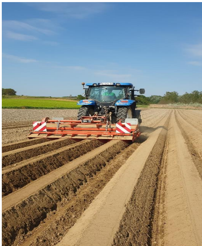
Slika 14. Ogrtanje