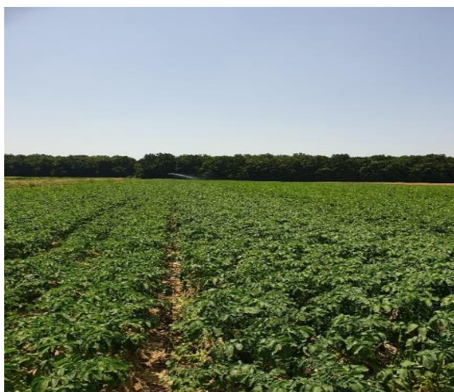
Slika 3. Nadzemna stabljika

Podzemnu čine stoloni i gomolj. 6-8 stolona (također poznatih i kao vriježe) formiraju se iz uspravnog dijela podzemne stabljike. Razvoj počinje oko 10 dana nakon nicanja. Na vrhovima stolona se razvijaju gomolji, modificirani stoloni, koji služe za skladištenje hranjiva. U uzgoju je cilj što kraća vriježa zbog manje međusobne udaljenosti gomolja, a lakše se kultiviraju i vade. Mjesto povezivanja gomolja i stolona se zove pupak a njemu nasuprot leži tjeme gomolja. Po površini kore se nalaze čvorići tj. okca koja su nepoželjna jer povećavaju gubitke pri guljenju.