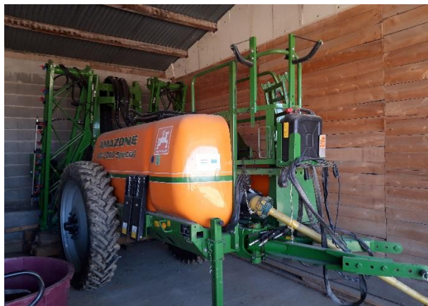
Slika 14. Prskalica „Amazone 2200 special“

Prskalica „Amazone 2200 special“, slika 14., je vučena prskalica radnog zahvata 15 metara. Volumen glavnog spremnika prskalice je 2400 litara, a volumen spremnika za ispiranje je 280 litara. Prskalica koristi crpku koja ima protok 250 l/min. ispravnosti prskalice te za dobivanje trenutnih podataka tijekom rada prskalice koristi se uređaj "Amaspray+", slika 15., koji je smješten u kabini traktora. Prskalica je opremljena GPS ( Global Positioning System ) uređajima te u slučaju preklapanja prohoda gasi mlaznice kako ne bi bilo nepotrebnog trošenja sredstva za zaštitu.