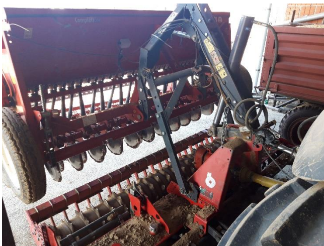
Slika 11. Sijačica „Gaspardo Nina 300“

Sijačica „Gaspardo Nina 300“, slika 11., nošena je žitna sijačica radnog zahvata 3 metra. Volumen spremnika sijačice iznosi 500 litara. Sijačica sije 25 redova u jednom proходу, te se na njoj nalaze ulagači sjemena s raončićima i diskovima. Sijačica također ima mogućnost centralnog podešavanja dubine sjetve. Na gospodarstvu se koristi za sjetvu žitarica i uljane repice, te se uvijek koristi agregatirana sa rotodrljačom.