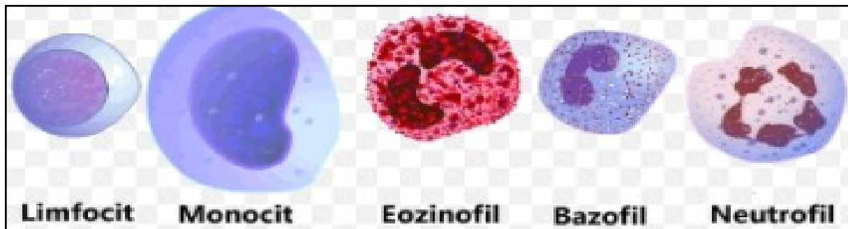
Slika 3. Mikroskopski prikaz leukocita