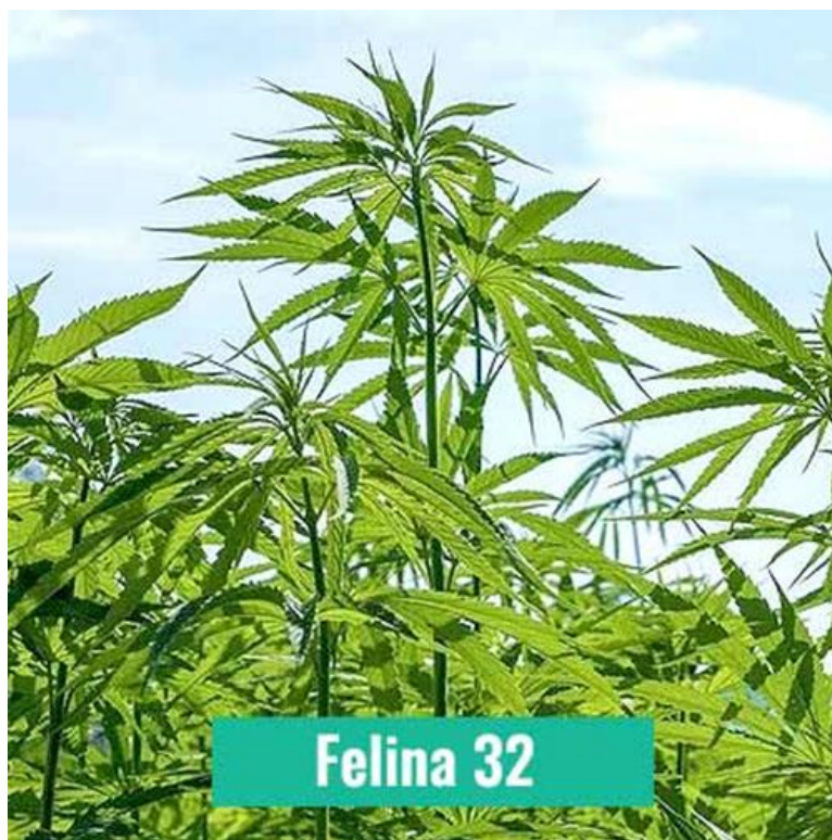
Slika 9. Sorta Felina 32

spreparatima, što odgovara i konvencionalnom i ekološkom uzgoju. Zbog nepovoljnih vremenskih uvjeta sjetva nije bila u odgovarajućem agrotehničkom roku te je obavljena nekoliko dana kasnije. U Tablici 3. prikazani su utvrđeni datumi fenoloških faza rasta i razvoja sorte Felina 32.