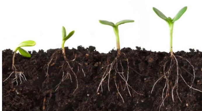
Slika 3. Korijenov sustav konoplje

Korijenov sustav (Slika 3.) konoplje je vretenast te jake upojne moći kada se potpuno razvije i čini gustu podzemnu mrežu. Prodire i do 2 m u dubinu tla ukoliko je tlo dobro pripremljeno te prozračno, a u širinu do 1,5 m. Većina se aktivnog korijenja nalazi na dubini od 10-40 cm. Razvoj mu je u početku vegetacije nešto sporiji. Korijen ženskih biljaka bolje je razvijen od korijena muških biljaka. To je zato što muške biljke ranije završavaju vegetaciju, a ženske biljke poslije oplodnje dohranjuju sjeme do njegova dozrijevanja, za što trebaju više hrane i vode, a to im osigurava jači korijenov sustav.