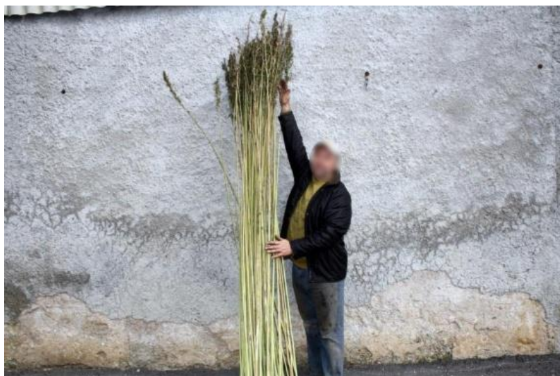
Slika 4. Stabljika konoplje

koljenaca i međukoljenaca. Visine je od 50 cm do 6 m ovisno o području uzgoja, tipu tla, agrotehnici, sortama kao i o uvjetima uzgoja. Muške biljke su nešto više od ženskih biljaka. Debljina iznosi oko 1 cm, dok se kod sjemenske konoplje debljina povećava kako bi izdržala težinu sjemena ( https://www.vrtlarica.hr/sadnja-uzgoj-industrijske-konoplje/ ).