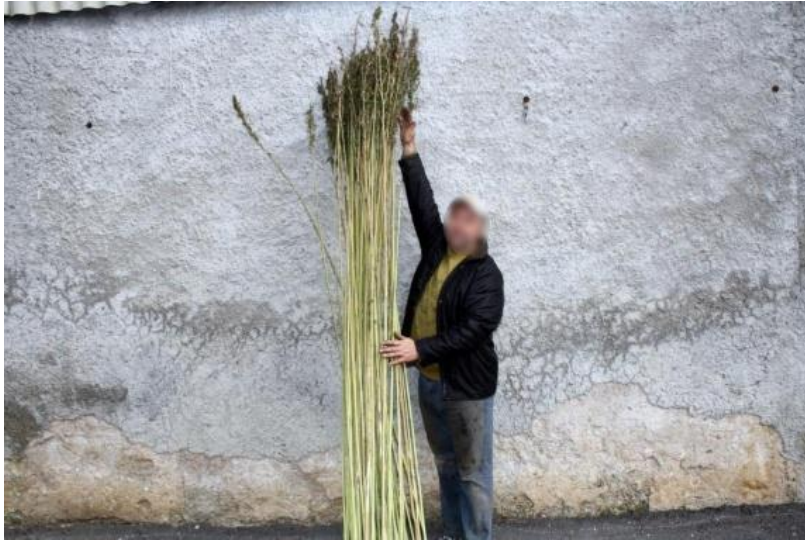
Slika 4. Stabljika konoplje

koljenaca i međukoljenaca. Visine je od 50 cm do 6 m ovisno o području uzgoja, tipu tla, agrotehnici, sortama kao i o uvjetima uzgoja. Muške biljke su nešto više od ženskih biljaka. Debljina iznosi oko 1 cm, dok se kod sjemenske konoplje debljina povećava kako bi izdržala težinu sjemena ( https://www.vrtlarica.hr/sadnja-uzgoj-industrijske-konoplje/ ).