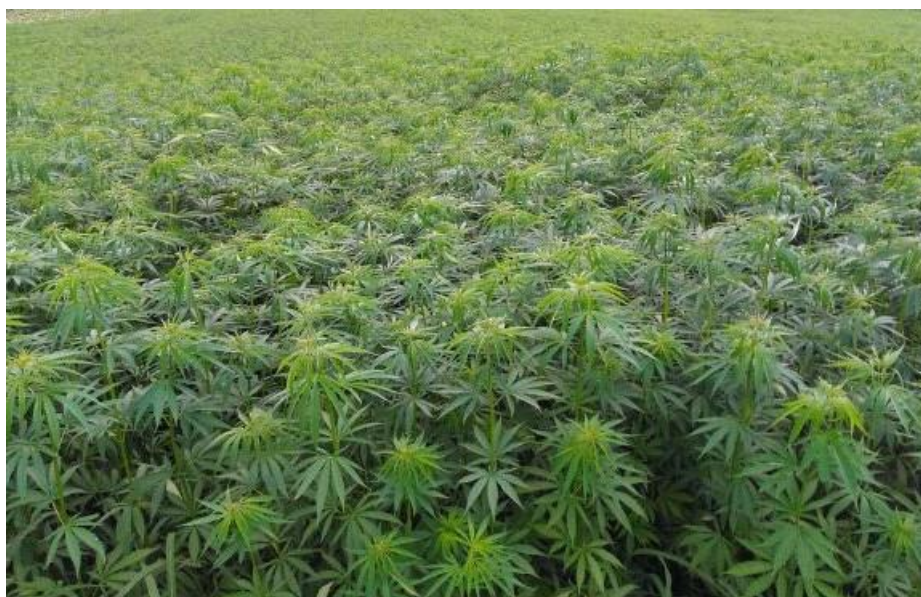
Slika 1. Polje konoplje