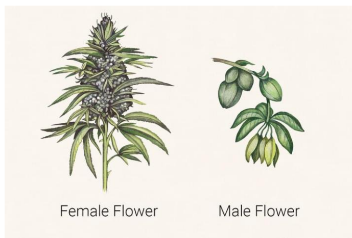
Slika 6. Ženski i muški cvijet konoplje

Cvjetovi su smješteni na vrhovima stabljike i bočnih grana. Muški cvjetovi (na muškim biljkama) imaju dulje cvjetne peteljke i su skupljeni u metličaste cvati, dok su ženski cvjetovi sjedeći (nemaju peteljke) u grozdastim cvatima, kako je prikazano na Slici 6. Konoplja je prirodno dvodomna biljka, no selekcijom su stvorene i jednodomne biljke. U usjevu se obično nalazi više ženskih nego muških biljaka (Mediavilla i sur., 1999.; Petrović i sur., 2018.), pa tako i Augustinović i sur. (2012.) u svojim istraživanjima bilježe omjere ženski i muških biljaka 57:43, 61:39 i 57:43.