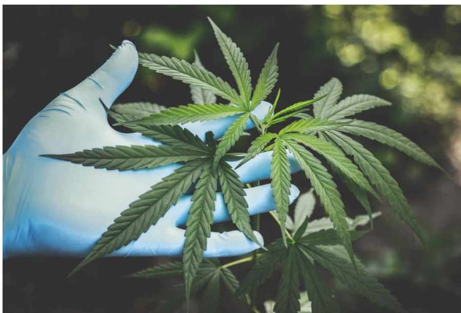
Slika 5. List konoplje

Listovi su nasuprotni i nalaze se na svakomkoljencu sve do gornje trećine biljke, odakle se počinju odvajati da bi u predjelu cvata bili gusto postavljeni.