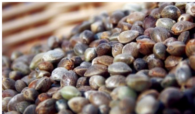
Slika 7. Plod konoplje

Plod je dvokrilni orašac, okruglasto-jajolikog oblika i spljošten (Slika 7.). Površina mu je glatka i sjajna, a boja tamno-zelena, smeđe-zelena, srebrnasto-siva s crnom primjesom. Masa 1 000 sjemenki iznosi oko 20 g, a hektolitarska težina oko 50 kg.