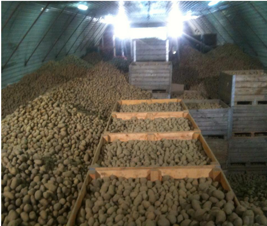
Slika 2. Krumpir u poljoprivrednoj zadruzi Stella

Glavni proizvod PZ Stella su poljoprivredni proizvodi, odnosno jabuke, krumpir, luk i mrkva te nešto lisnatog povrća, to je glavna proizvodnja udruženih zadrugara, ali i pšenica i kukuruz kao plodoredne kulture. Kao što je već navedeno, u mogućnosti su izaći sa 3000 tona luka, 5000 tona krumpira, 1000 tona jabuka te 100 tona celera i 200 tona mrkve. Te do 2.000 tona kukuruza i do 320 tona pšenice, zbog plodoreda. Dodatne usluge su nabavka repromaterijala. Ljudski rad je iskorišten 30 % te tehnologija 70%. Danas zadrugari raspolažu sa preko 700 ha obradivih površina, te raspolažu najnovijom modernom poljoprivrednom mehanizacijom za uzgoj voća, povrća i žitarica, a nedostatak su premali skladišni kapaciteti.