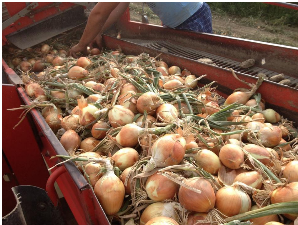
Slika 5. Luk u poljoprivrednoj zadruzi Stella