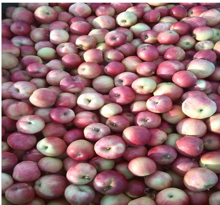
Slika 4. Jabuke u poljoprivrednoj zadruzi Stella