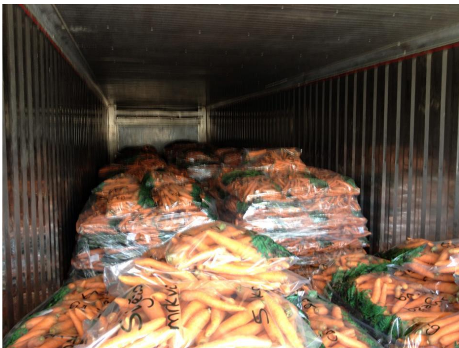
Slika 3. Mrkva u poljoprivrednoj zadruzi Stella