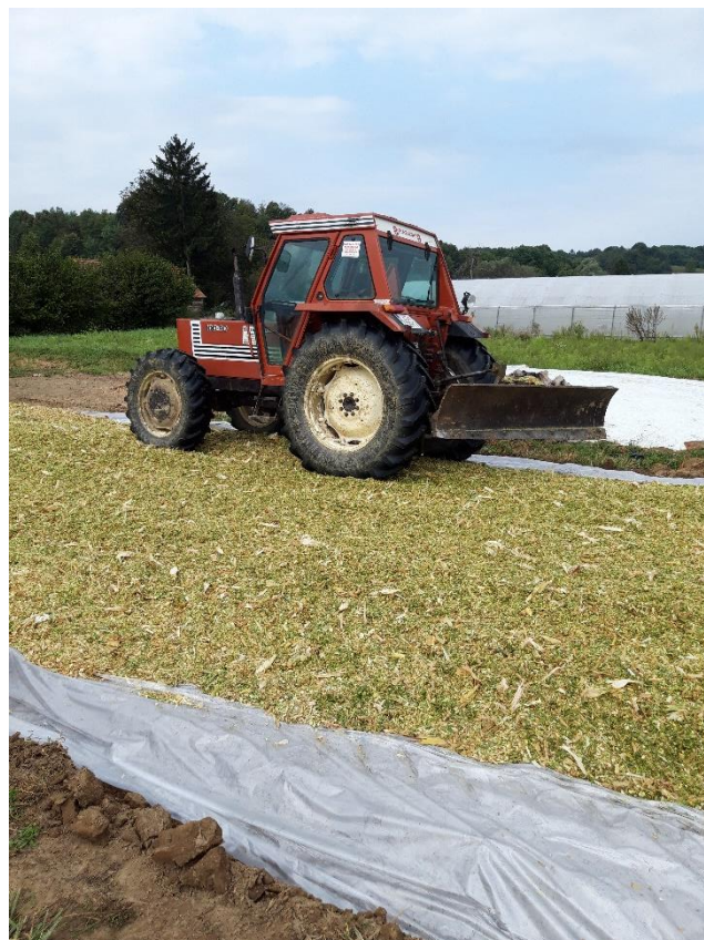
Slika 6. Gaženje silaže

Košnja kukuruza odnosno priprema silaže na obiteljskom poljoprivrednom gospodarstvu Šolinić vrši se početkom rujna iz razloga što se silažni kukuruz sije kasnije pa samim time i kasnije dostiže svoju fiziološku zrelost. Siliranje se vrši s četverorednim silokombajnom te se traktorima i prikolicama silirana masa prevozi do mjesta gdje će biti silosi. Pošto silosi nisu izbetonirani na tlo se postavi folija na koju se tada istrpava silirani kukuruz te se potom, uz pomoć traktora, to sve dobro nagazi kako zrak odnosno kisik ne bi mogao ući unutra i potaknuti kvarenje silaže. Na kraju se silos pokrije s dvije folije, zrak se istisne pomoću pijeska van te se stavi neka vrsta tereta da vjetar ne može nadići folije.