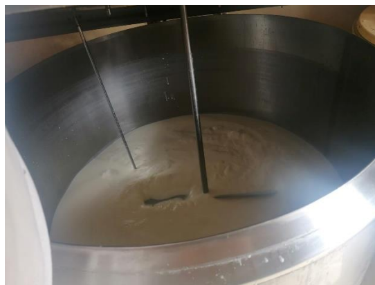
Slika 5. Hlađenje mlijeka u laktofrizu