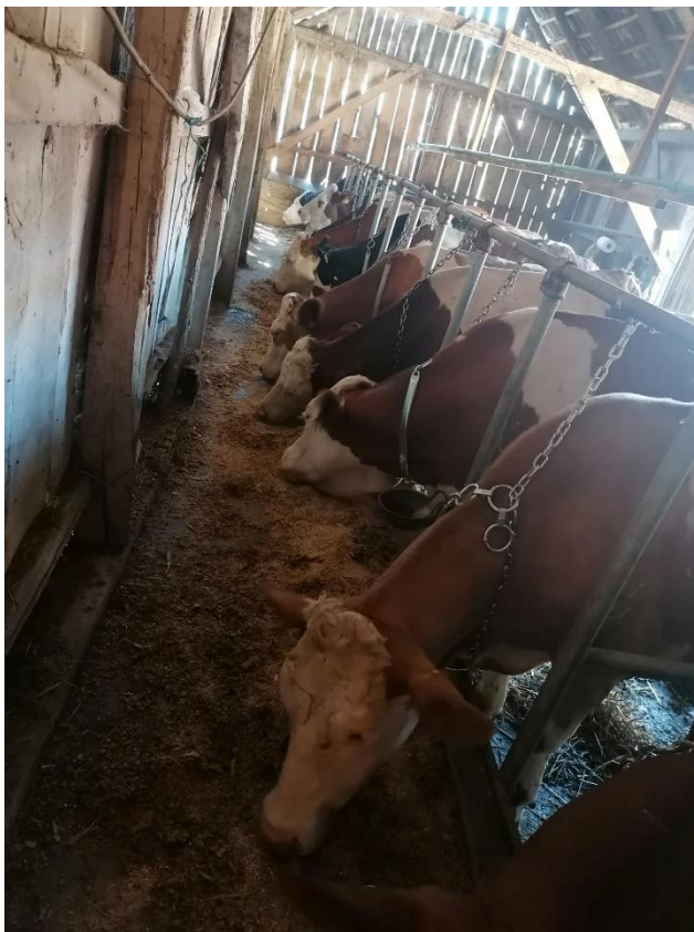
Slika 3. Krave u staji

Broj krava se vrlo brzo povećava, što iz razloga jer je kupljeno nekoliko visoko gravidnih junica tako i jer imamo nekoliko vlastitih junica koje su gravidne. Isto tako smo postigli rekordan broj teladi kojih je sada trenutno 10, a kroz mjesec dana bi se taj broj trebao povećati za još tri teleta. Uz goveda na gospodarstvu ima i nekoliko svinja, no one se koriste za vlastite potrebe.