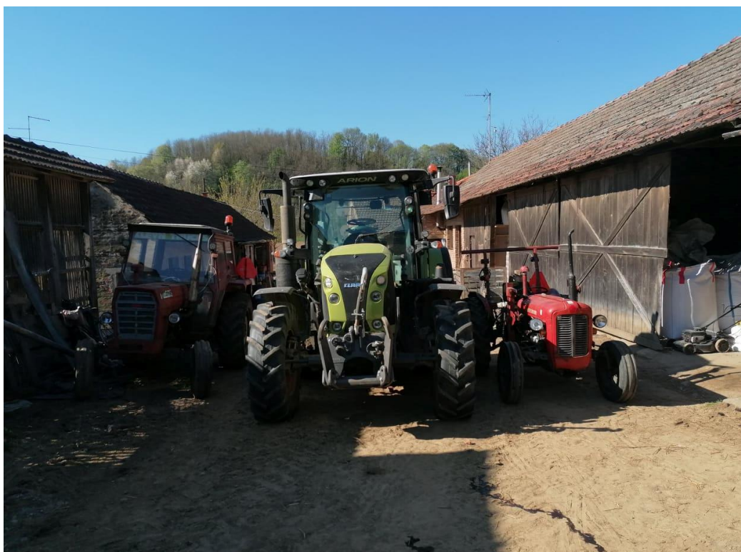
Slika 2. Traktori u vlasništvu gospodarstva

Jedan od glavnih napredaka je svakako bila nabavka novog traktora, Class Arion 510. Samom kupnjom tog traktora, omogućena je i kupnja većih plugova, sijačice za žitarice te brojnih ostalih priključaka koji imaju veći obuhvatni zahvat. Uz Claas posjedujemo još dva traktora IMT 539 te IMT 560. Prije nekoliko godina kupljena je rolo balirka sa omotačem što je uvelike olakšalo, ali i ubrzalo proizvodnju. Iste godine je kupljena i mješaona za smjesu kapaciteta 800 kg što je omogućilo pripremu veće količine smjese za goveda. Isto tako su kupljeni plugovi prekretači, sjetvospremač te sijačica.