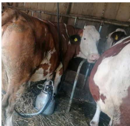
Slika 4. Mužnja krava

Sam proces mužnje traje oko 1,5-2 sata. Prije nego što se krene musti očiste se staje i balega ispod krava te se osiguraju čisti uvjeti za mužnju. Kravama se vimena i sise peru pomoću pjene i zatim se svakoj kravi vime obriše čistim ubrusom. Nakon toga slijedi stavljanje sisnica na sise i sama mužnja koja traje od 6-10 minuta ovisno o kravi.