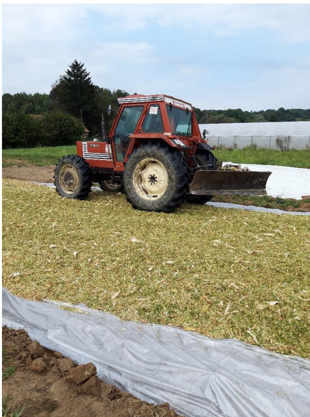
Slika 6. Gaženje silaže

Košnja kukuruza odnosno priprema silaže na obiteljskom poljoprivrednom gospodarstvu Šolinić vrši se početkom rujna iz razloga što se silažni kukuruz sije kasnije pa samim time i kasnije dostiže svoju fiziološku zrelost. Siliranje se vrši s četverorednim silokombajnom te se traktorima i prikolicama silirana masa prevozi do mjesta gdje će biti silosi. Pošto silosi nisu izbetonirani na tlo se postavi folija na koju se tada istrpava silirani kukuruz te se potom, uz pomoć traktora, to sve dobro nagazi kako zrak odnosno kisik ne bi mogao ući unutra i potaknuti kvarenje silaže. Na kraju se silos pokrije s dvije folije, zrak se istisne pomoću pijeska van te se stavi neka vrsta tereta da vjetar ne može nadići folije.