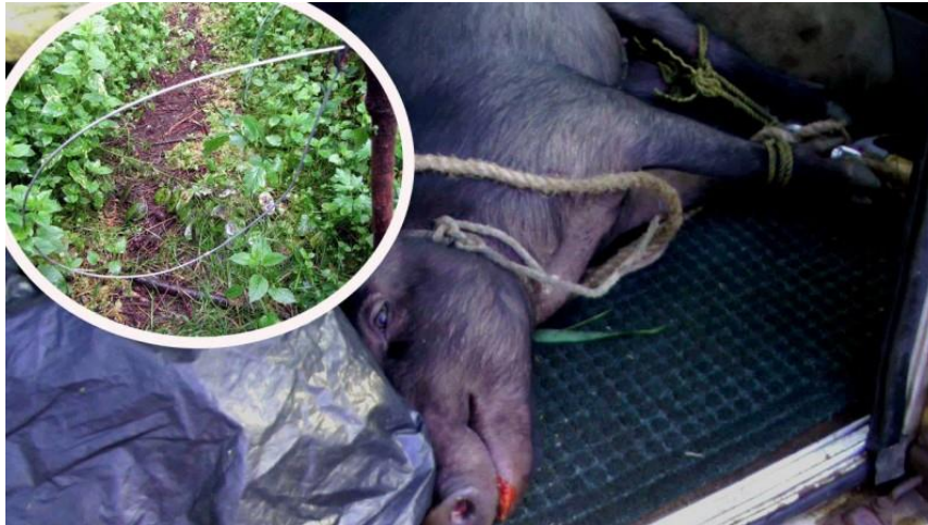
Slika 7. Nehumani krivolov

životinjskog svijeta. Naravno, ovakvi postupci nanose štetu i ruše ugled lovcima koji savjesno i pošteno obavljaju svoj posao, koji čuvaju prirodu, a većina kojih osjeća osobnu odgovornost prema očuvanju prirode i okoliša ( http://www.huntfairchase.com/illegal-hunting/ ).