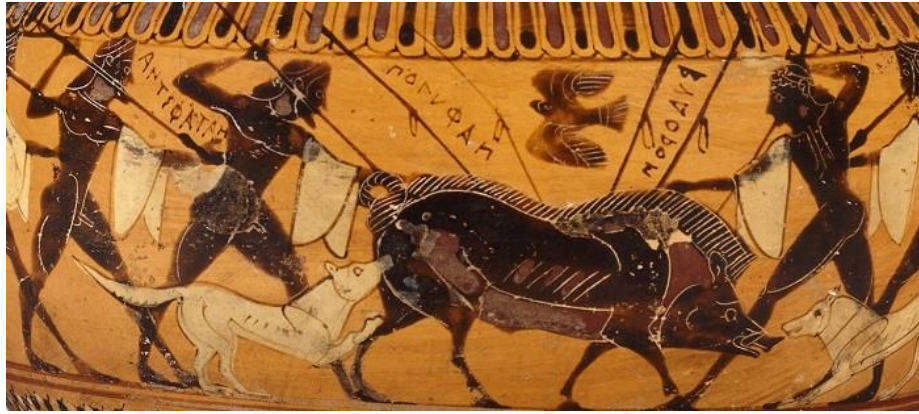
Slika 1. Lov u drevnoj Grčkoj

https://sarastamey.com/the-rambling-writers-reflections-on-greece-ancient-hunters-of-the-wild-boar/