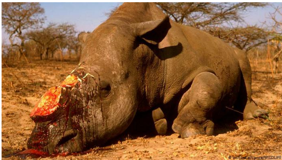
Slika 9. Nosorog ubijen u krivolovu