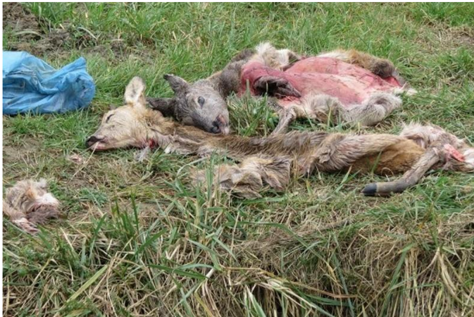
Slika 5. Odbačeni ostaci srneće od strane lovokradica

https://www.034portal.hr/index.php?id=16663