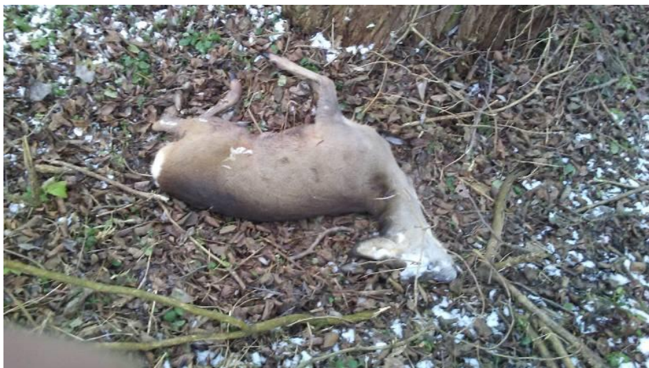
Slika 6. Srna pronađena u nedozvoljenom lovu

https://www.034portal.hr/index.php?id=16663