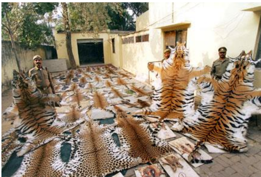
Slika 3. Zaplijenjena krzna tigrova ulovljenih ilegalnim načinom lova

Nedozvoljeni lov, osim što se njime krše zakonski propisi, ima i etičku konotaciju. Lov i ostale aktivnosti vezane uz bavljenje lovstvom zahtijevaju određene zahvate čovjeka u prirodi i mogu nesmotrenim, namjernim ili nenamjernim i nestručnim djelovanjem znatno utjecati na odnose u prirodi. Ugroženost nekih vrsta divljih životinja, posebno mesoždera, potiče sve veće sukobe među ljudima koji su lovci i protivnika lova na mnogim mjestima širom svijeta. Sukobi su posebno pojačani u slučaju vrsta koje mogu živjeti u blizini ljudi i imaju koristi od konzumiranja hrane. Nezakonitim načinom lova vrlo negativno utječemo na smanjenje pojedinih životinjskih vrsta u prirodi i prirodne cikluse što može uzrokovati dugotrajne posljedice. Nezakoniti način lova možemo spriječiti ili barem smanjiti provođenjem nekih aktivnosti kao što su uspostavljanje brzog protoka informacija i prijava o počinjenom krivolovu, postavljanje video nadzora kao dokazni materijal, češće uključivanje inspeksijskih službi u nadzor na terenu, te proširivanje suradnje i uključivanje građana da prijavljuju počinjena nezakonita djela. Ako građani primijete sumnjivu aktivnost, potrebno je odmah dojaviti policiji i dati točne informacije kao što su mjesto i vrijeme primijećene aktivnosti. Policija je dužna po zaprimljenoj prijavi izaći na teren te obavijestiti nadležnog lovočuvara i ostale nadležne institucije ovisno o tipu prekršaja.