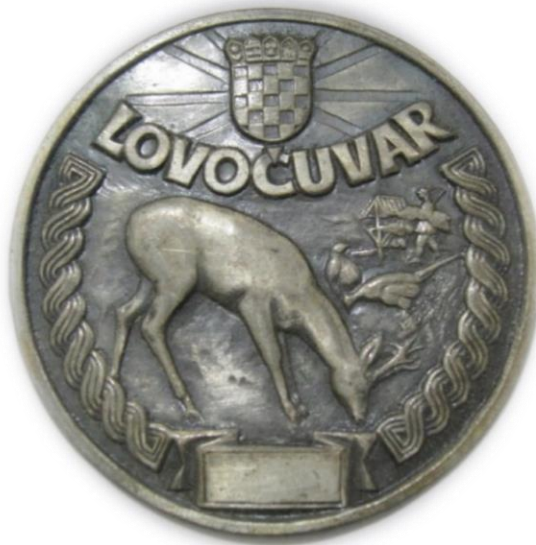
Slika 4. Značka lovočuvara