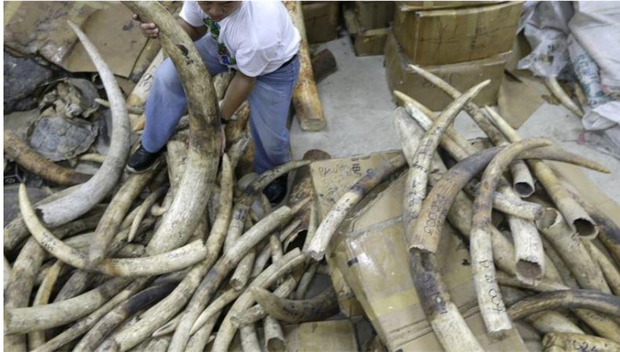
Slika 8. Zaplijenjena slonovača stečena u nedozvoljenom lovu