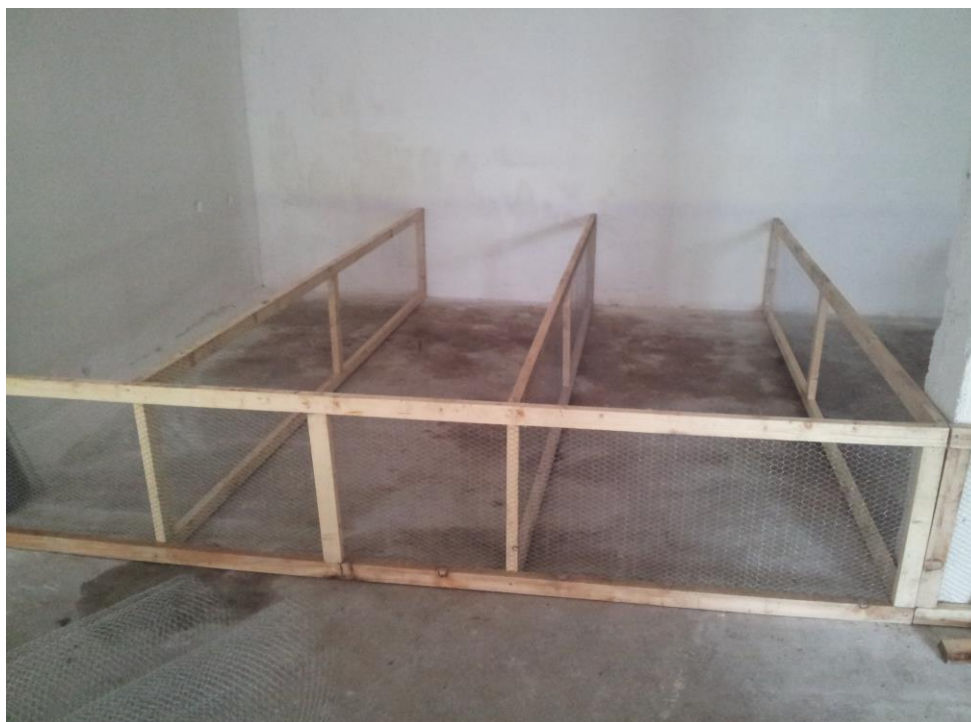
Slika 1. Priprema objekta za tov pačića