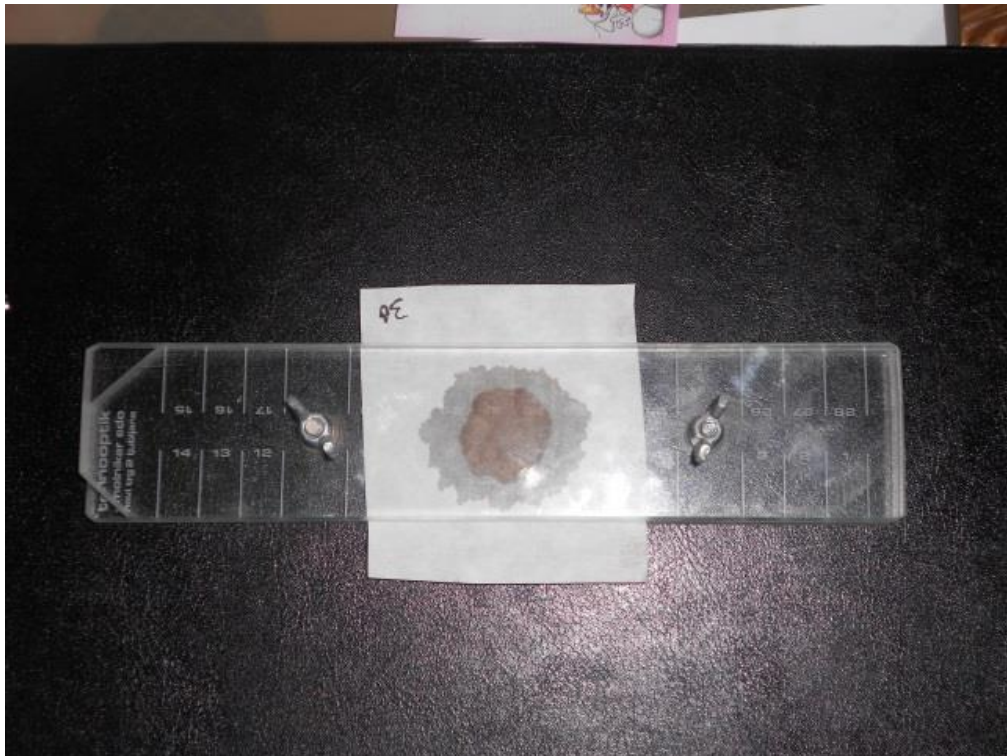
Slika 7. Mjerenje sposobnosti vezanja vode (Sp.v.v.)