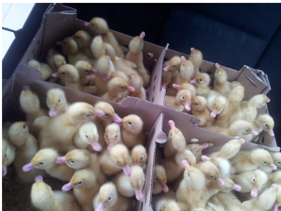
Slika 2. Jednodnevni pačići Cherry Valley