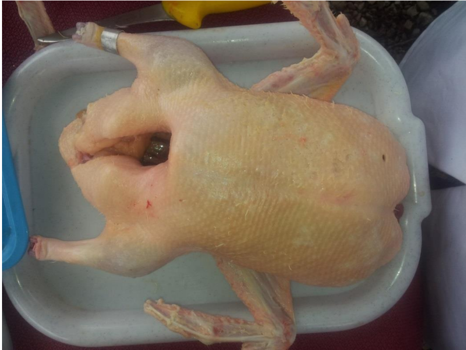
Slika 4. Klaonički obrađeni pačji trup

Za mjerenje pH vrijednosti korišten je digitalni pH-metar Mettler MP 120-B (Slika 8.). Boja je izmjerena uporabom Minolta CR-300 kolorimetra (Minolta Camera Co. Ltd., Osaka Japan) kalibriranim na bijelu pločicu ( L^*=93,30 ; a^*=0,32 i 1,8 ; b^*=0,33 ). Promjer optičke leće je bio veličine 8 mm, osvjetljenje D65, a standardno opažanje 10^\circ . Vrijednosti boje izražene su kao CIE-Lab (Commission Internationale de l'Eclairage, 1976.), a odnose se na bljedoću (os crno-bijelo), stupanj crvenila (crveno-zeleni spektar) i stupanj žute boje (žuto-plavi spektar). Boja svakog prsnog mišića je rezultat tri uzastopna mjerenja, i predstavljena je kao njihova srednja vrijednost (Slika 5. i 6.).