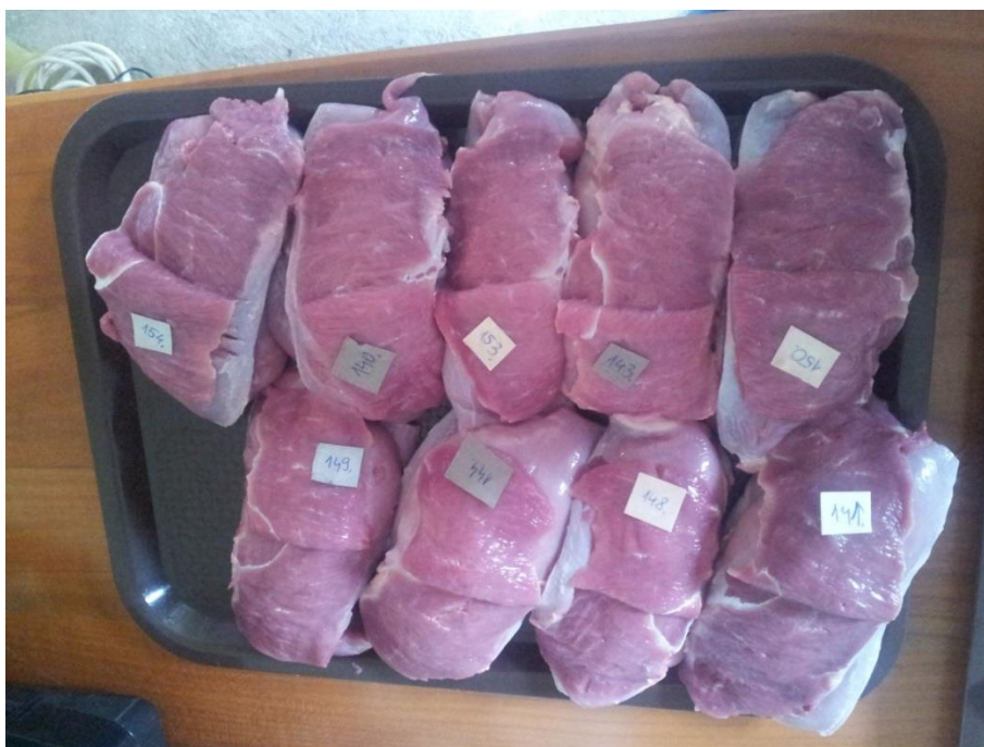
Slika 6. Uzorci mesa prsa pripremljeni za analizu boje