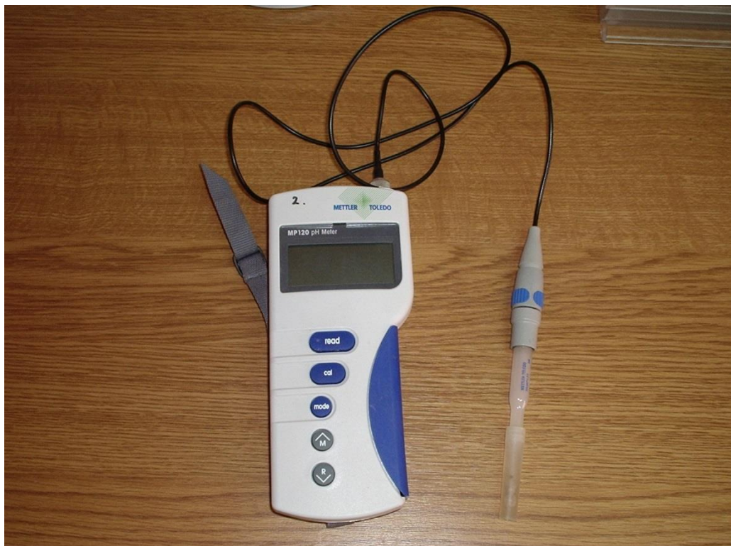
Slika 8. Digitalni pH-metar Mettler MP 120-B