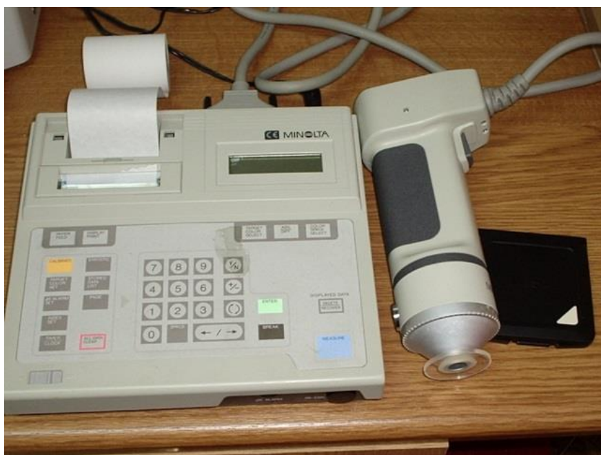
Slika 5. Minolta CR-300 kolorimetra (Minolta Camera Co. Ltd., Osaka Japan)