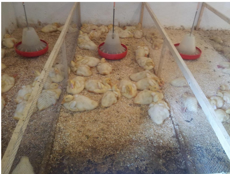
Slika 3. Izgled objekta za vrijeme tova brojlerskih pačića