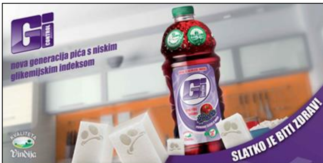
Slika 6. GI Control funkcionalno piće

Zbog velikih očekivanja kupaca Vindija sustavno radi i na novim metodama pakiranja hrane. Ambalaža je iznimno bitna značajka kod pakiranja hrane, dok kvaliteta ambalaže smanjuje troškove skladištenja, doprinosi stabilnosti i očuvanju kakvoće hrane tijekom roka njezine trajnosti te istodobno pruža i pogodnost informiranja potrošača. Zbog velikih očekivanja kupaca vezanih za sigurnost hrane Vindija već dugo radi na novim metodama procesiranja hrane. U te postupke mogu se svrstati procesuiranje hrane visokim tlakom, ozonom, ionizacijom, zračenjem, ultrazvučno i pasterizacijom. U sklopu svog proizvodnog procesa Vindija osobitu pozornost posvećuje kvaliteti pakiranja svih svojih proizvoda, pri čemu se vodi isključivo najsvremenijim svjetskim trendovima. Upotrebljavaju najnapredniju raspoloživu tehnologiju, strojeve, uređaje i vrste ambalaže proizvođača čija je kvaliteta prepoznata na svjetskoj razini. U suradnji s proizvođačima neprestano rade na primjeni novih i kvalitetnih rješenja, prateći zahtjeve potrošača i suvremene trendove u pakiranju. Održavanje i unaprjeđenje kvalitete pakiranja proizvoda sastavni je dio razvoja proizvoda. Novo ekološko pakiranje 'z bregov proizvoda, odnosno redizajnirana linija 'z bregov čokoladnog mlijeka, kakaa i ledene kave od sada dolazi i u ekološki prihvatljivijoj tetrapak ambalaži.