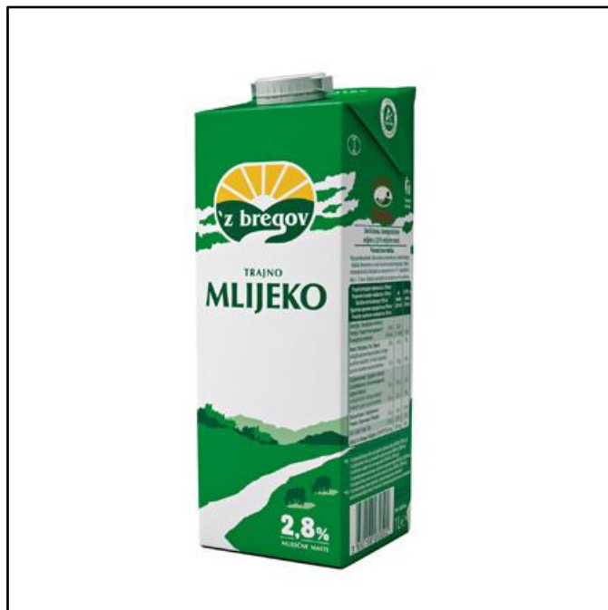
Slika 2. Nova ambalaža