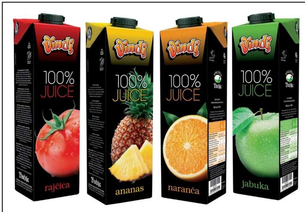
Slika 3. Vindi sokovi

Osim mliječnih proizvoda, novu ambalažu Vindija uvodi i kod Vindi sokova. Novi oblik pakiranja osigurava bolju vidljivost i diferencijaciju na prodajnim mjestima, a riječ je o modernom dizajnu koji je u skladu s najnovijim grafičkim trendovima u svijetu. Novoj su ambalaži dodali i najnoviju generaciju čepova koji omogućuju otvaranje u samo jednom koraku, dok njegov širi vanjski promjer omogućuje lakše točenje. Na slici 3. prikazani su Vindi sokovi u novoj ambalaži.