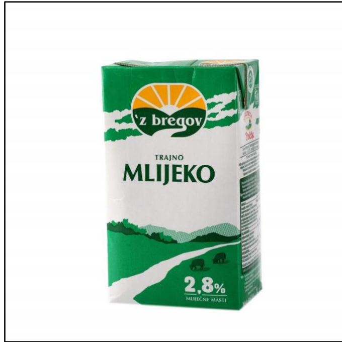
Slika 1. Stara ambalaža