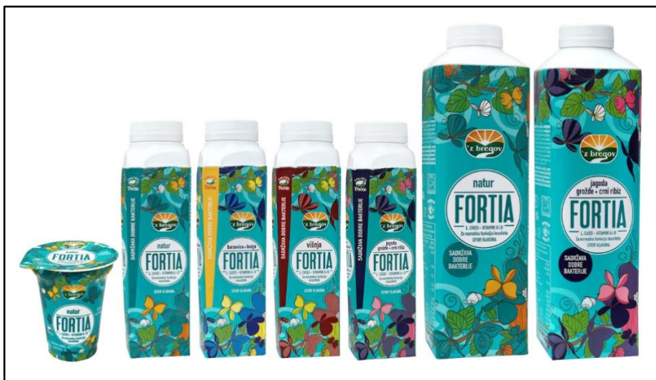
Slika 8. Mliječni jogurt Fortia

Uz novu liniju čokoladnih mlijeka, uvode i linije funkcionalnih jogurta Fortia odnosno fermentiranih napitaka koji sadrže bakterijsku kulturu Lactobacillus casei , L. casei koja djeluje na povećanje imunološkog sustava. Novost je da odsad dolaze u novoj, ekološki prihvatljivoj ambalaži koja čuva okoliš. Dosadašnje plastično pakiranje Vindija je zamijenila inovativnim pakiranjem, kartonskom bocom proizvedenom od papira iz obnovljivih izvora.