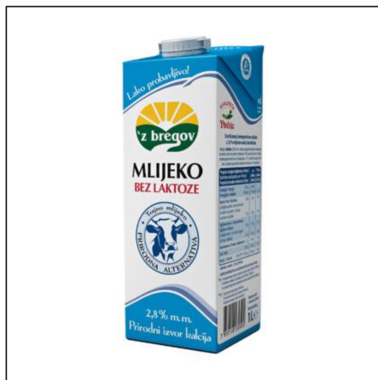
Slika 5. z' bregov funkcionalno mlijeko bez laktoze

Na svim prodajnim mjestima Vindijinih proizvoda može se pronaći tri jedinstvena trajna mlijeka Efekt koja sadrže posebno važne funkcije za zdravlje ljudskog organizma. Na taj način Vindija je omogućila građanima da prvi put uz temeljnu funkciju mlijeka kao prirodnog izvora kalcija za organizam biraju i dodatne funkcije poput trajnog mlijeka obogaćenog fitosterolima za aktivno snižavanje kolesterola, trajnog mlijeka obogaćenog omega 3 masnim kiselinama i vitaminima A, D i E za bolje funkcioniranje srčano-žilnog sustava, poboljšavanje koncentracije i jačanje imuniteta te trajnog mlijeka obogaćenog kalcijem, vitaminima C, E, B6, B12 i folnom kiselinom koji se posebno preporučuje mladim ženama koje planiraju trudnoću ili su trudne. ( http://www.vindija.hr )