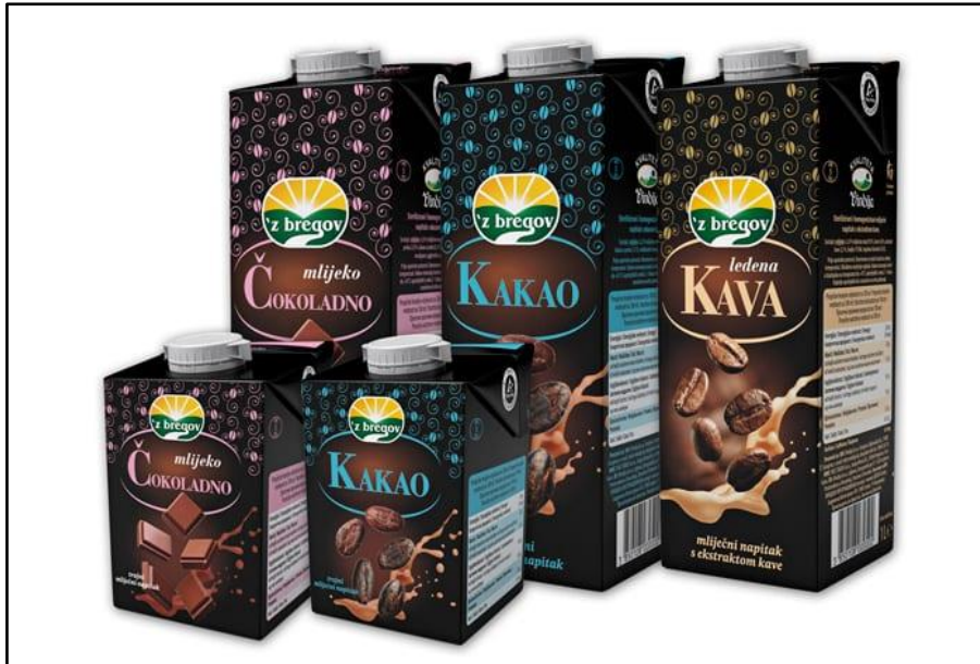
Slika 7. Novo ekološko pakiranje z' bregov čokoladnog mlijeka, kakaa i kave