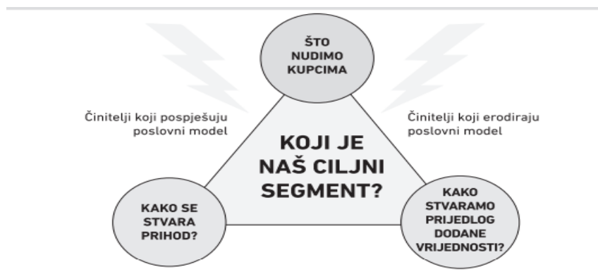
Slika 1. Odrednice racionalnog područja za odabir poslovnog modela