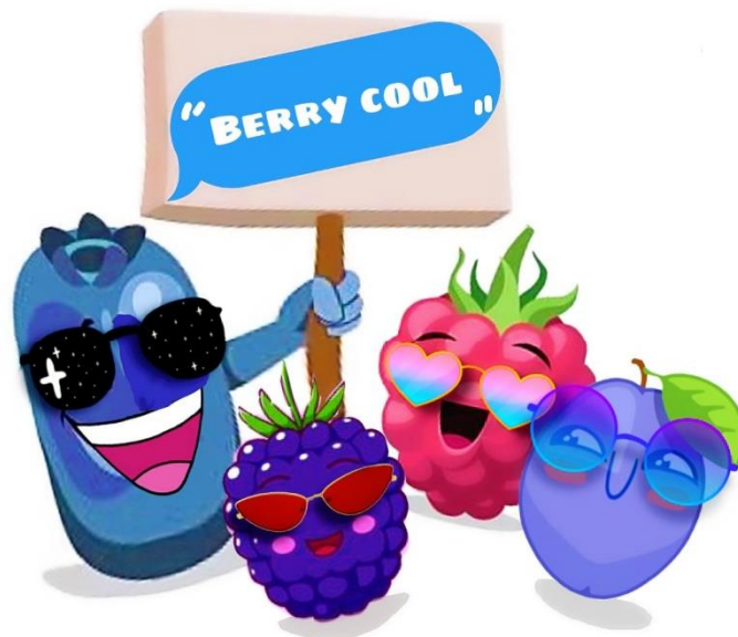
Slika 3. Logo linije proizvoda „Berry cool

Razvit će se linija proizvoda koja će imati zajednički naziv „Berry cool“. Osim naziva bit će napravljen i prepoznatljivi logo.