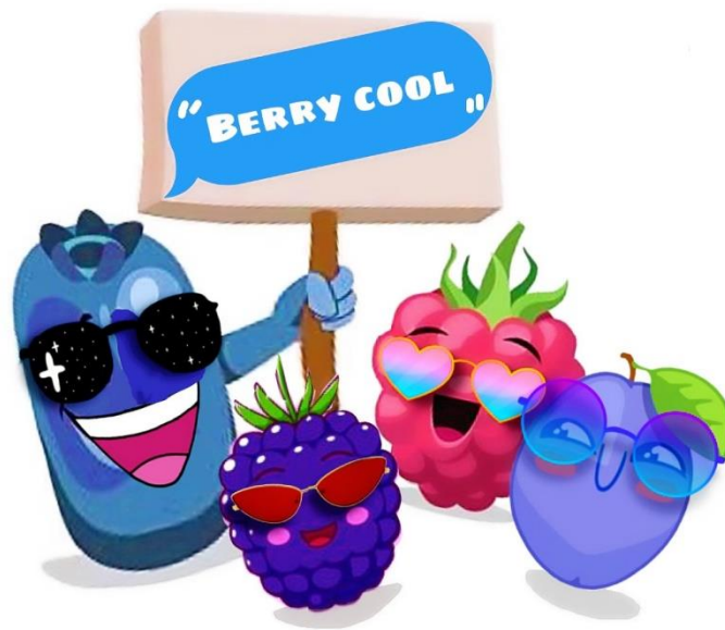
Slika 3. Logo linije proizvoda „Berry cool“

Razvit će se linija proizvoda koja će imati zajednički naziv „Berry cool“. Osim naziva bit će napravljen i prepoznatljivi logo.