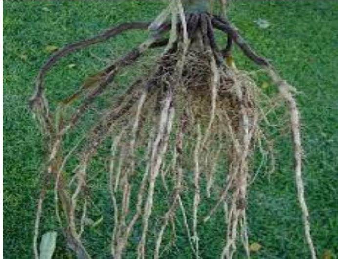
Slika 2. Korijen kukuruza šećerca