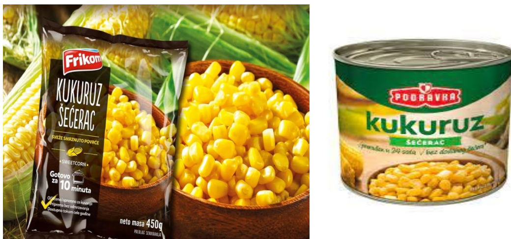
Slika 4. Smrznuti i konzervirani kukuruz šećerac