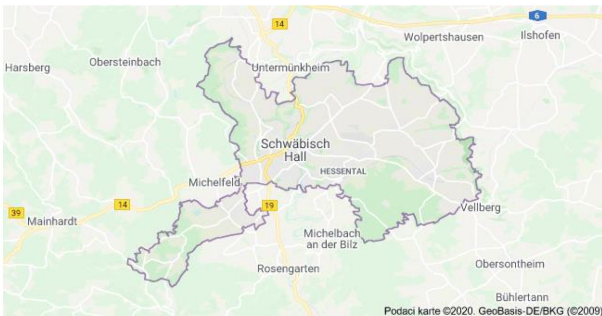
Slika 3. Schwabisch hall pokrajina

U dolje prikazanoj slici je pokrajina Schwabisch Hall gdje se schwabisch hall pasmina i uzgaja.