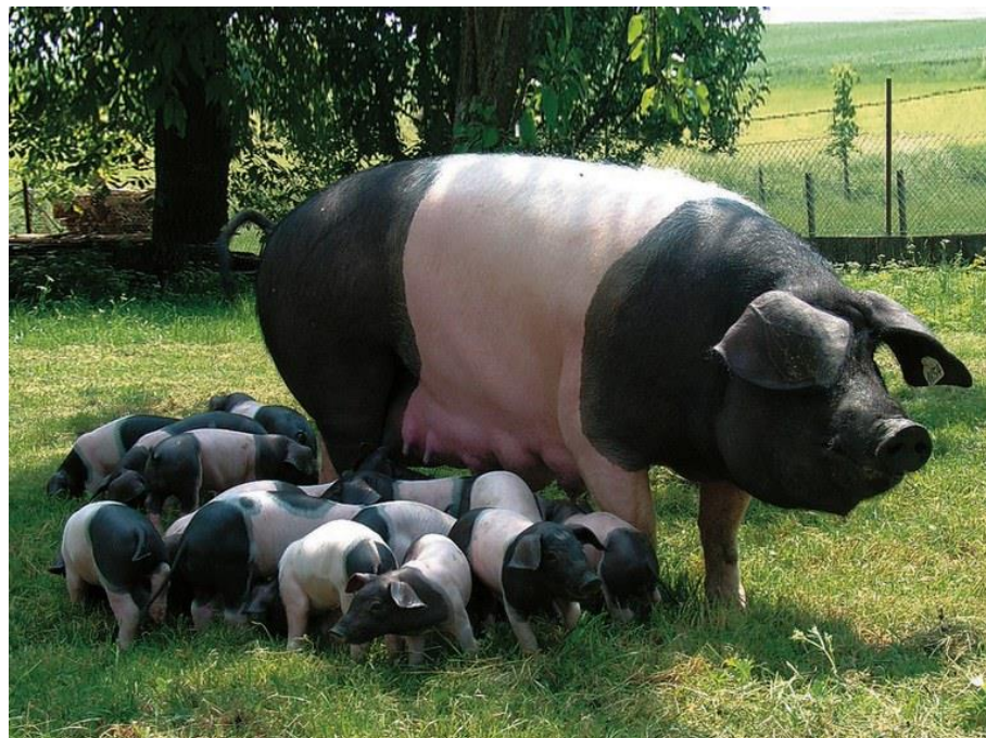
Slika 2. Schwabisch hall