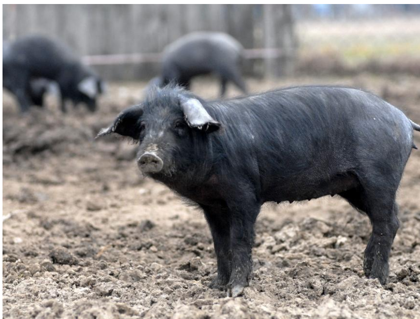
Slika 4. Crna slavonska svinja

Cilj križanja pasmina svinja bio je stvoriti svinju koja će biti ranozrela, plodnija i mesnatija od primitivnih pasmina. Pripada u srednje velike pasmine svinja, a narastu do 75 cm. Na slijedećoj slici nalazi se Crna slavonska svinja.