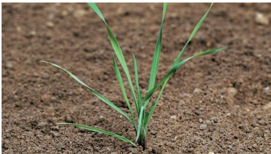
Slika 3. Alopecurus myosuroides Hunds. – poljski repak

( https://www.agro.basf.hr/hr/Novosti-i-dogadjaji/Pest-Guide/Poljski-repak.html )